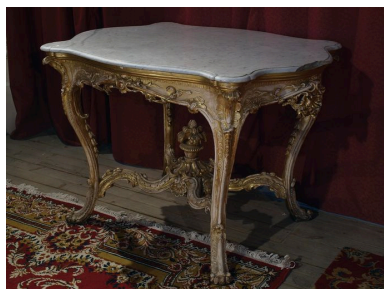
Vue générale IVR31_20106204765NUCA