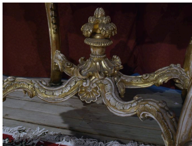
Vue de détail : entretoise IVR31_20106204768NUCA