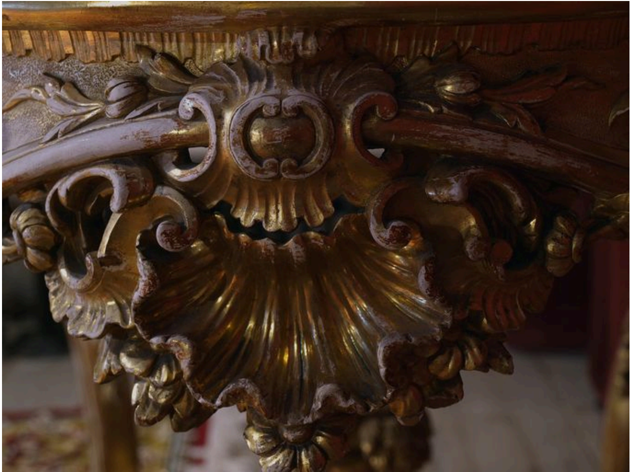
Vue de détail : coquille centrale