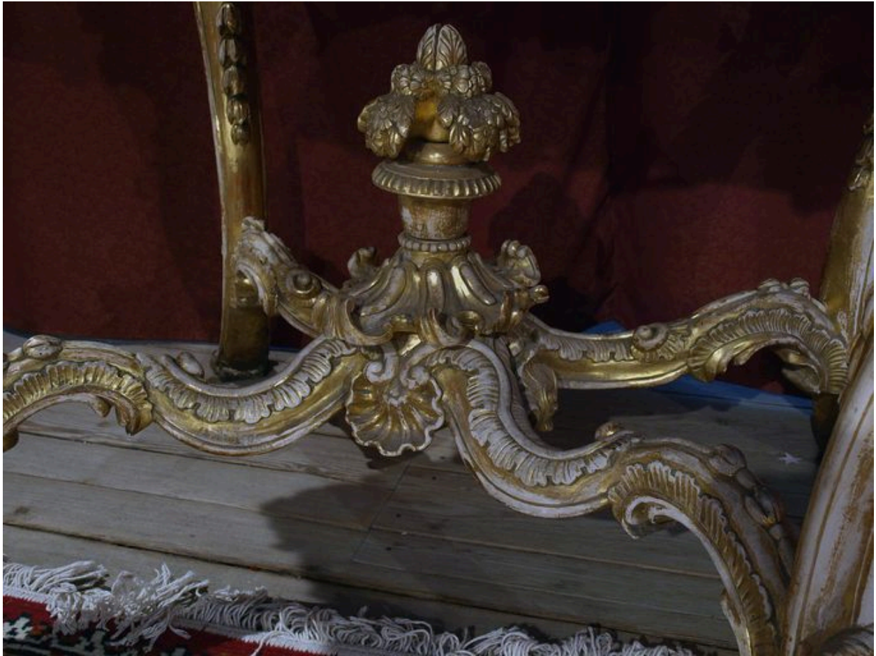
Vue de détail : entretoise