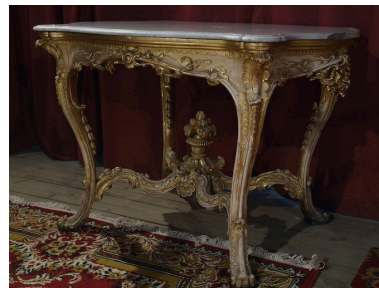
Vue générale IVR31_20106204766NUCA