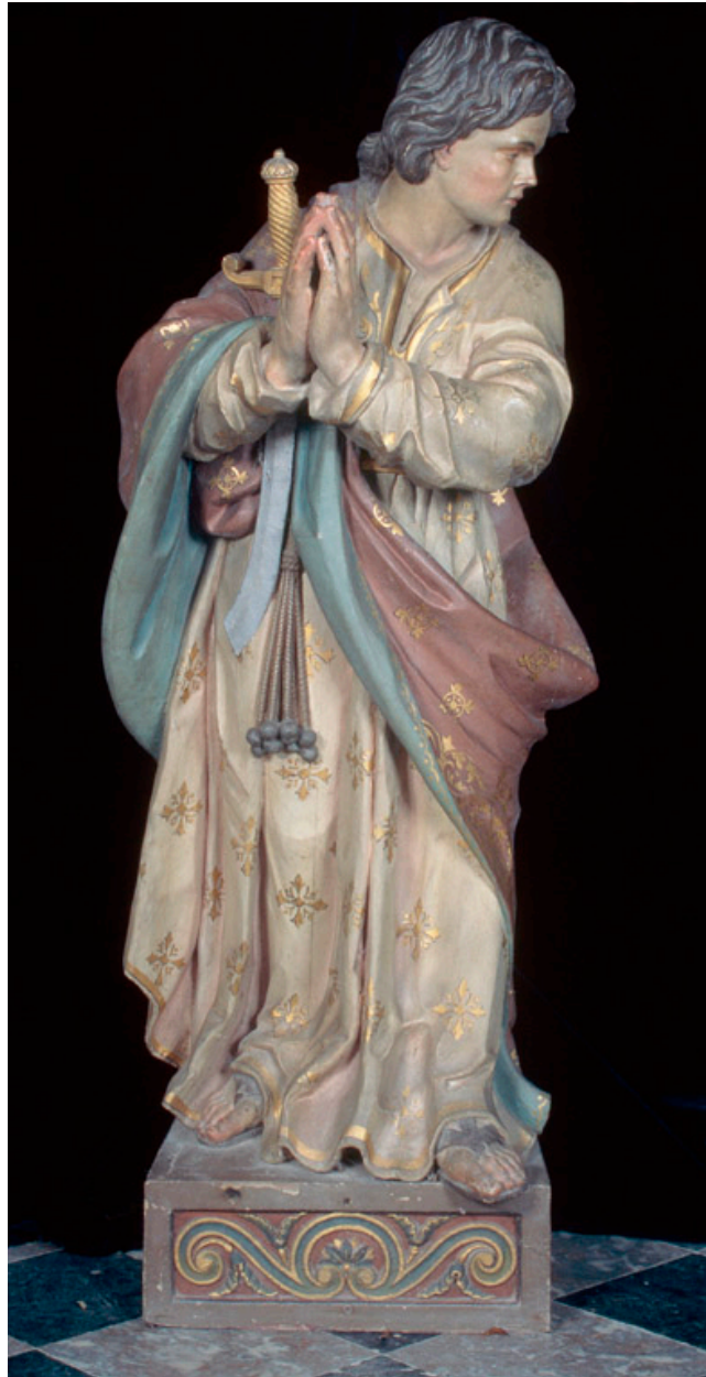
Vue antérieure de l'une des deux statues.