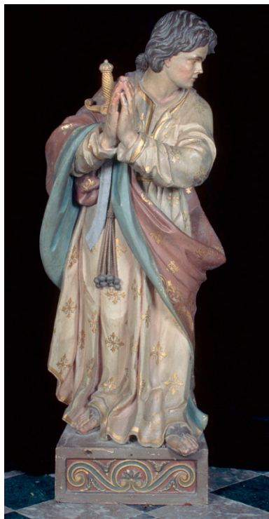
Vue antérieure de l'une des deux statues. IVR22_19988000115ZA