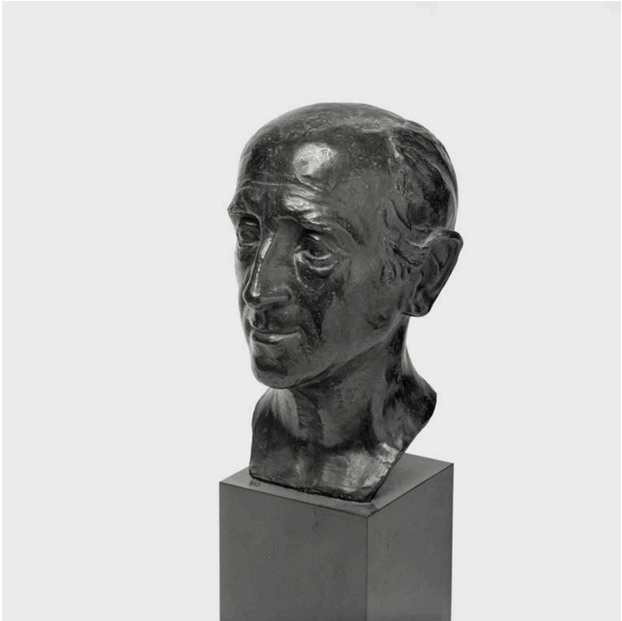
Vue de l'oeuvre.