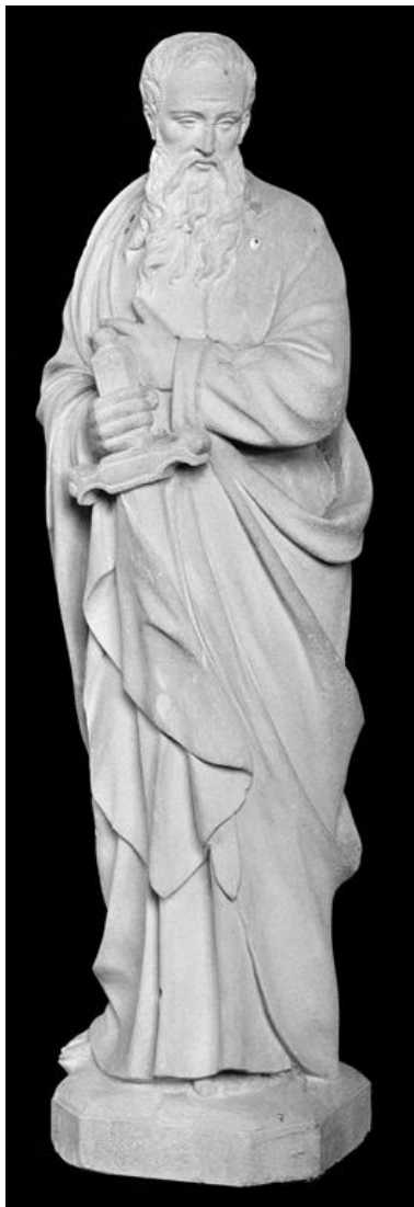
Vue de la statue de Saint-Paul.