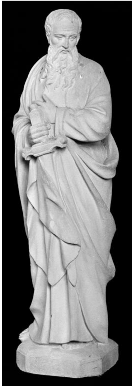
Vue de la statue de Saint-Paul.