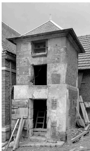
Colombier.