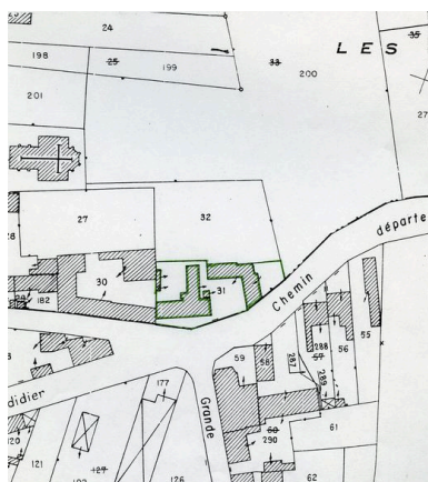
Plan de situation. Extrait du plan cadastral de 1982, section AC 31. IVR22_20096000129NUCA