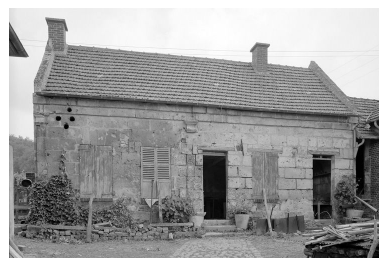
Logis. Elévation antérieure. IVR22_19856000973X