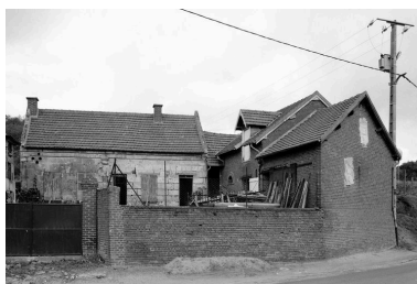
Vue générale sur rue. IVR22_19856000971X