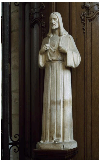
Vue générale, de trois-quarts.

IVR22_20050200006ZA