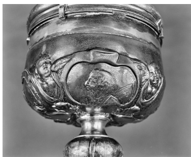
Détail de la fausse coupe, buste en médaillon d'un père de l'Eglise : saint Augustin ?