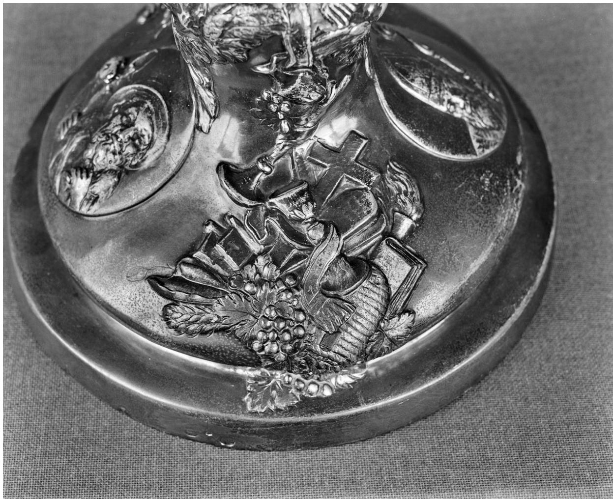
Détail du pied : trophée d'objets à symbolisme chrétien.