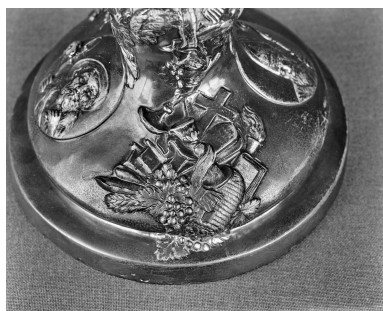
Détail du pied : trophée d'objets à symbolisme chrétien.