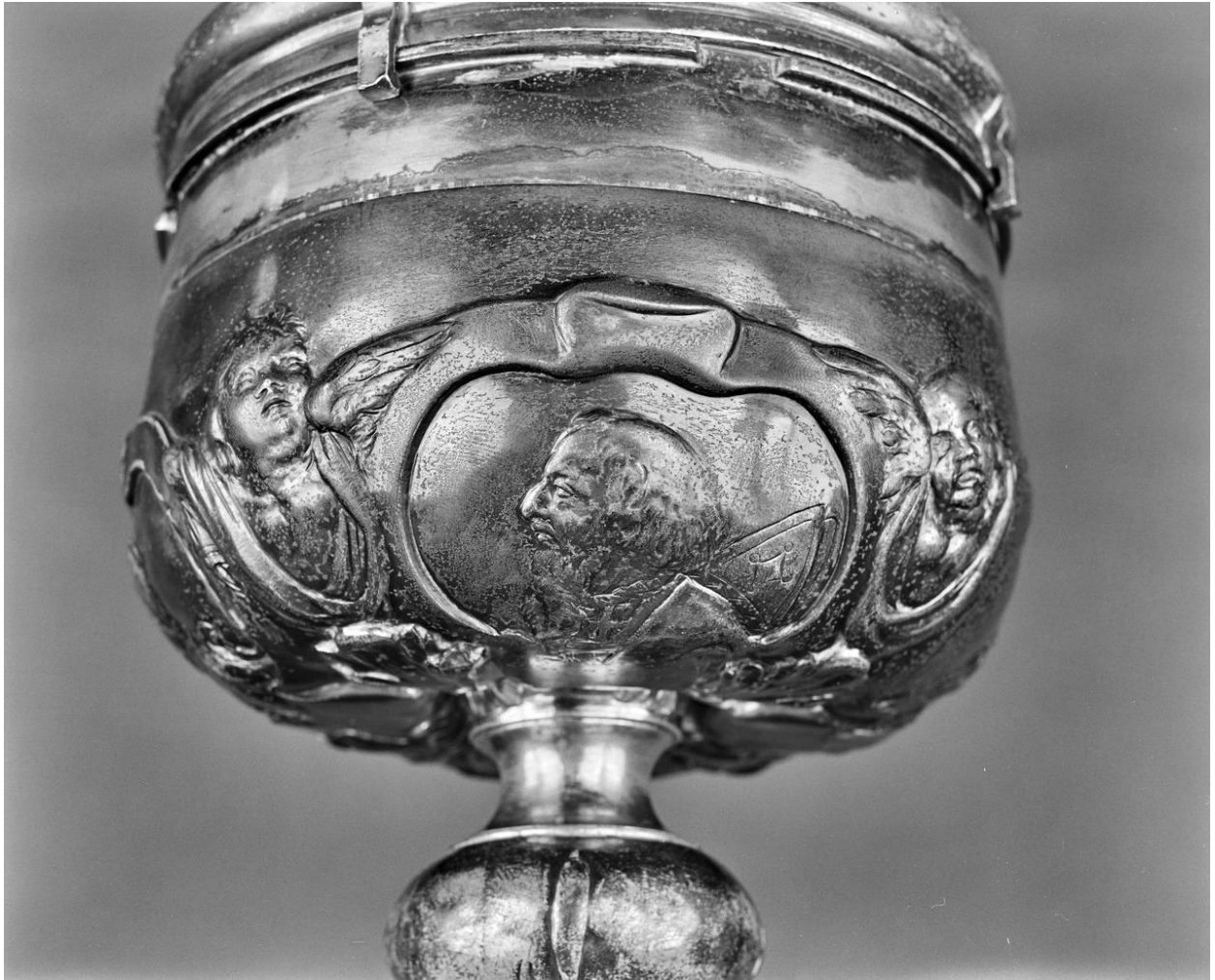
Détail de la fausse coupe, buste en médaillon d'un père de l'Eglise : saint Augustin ?