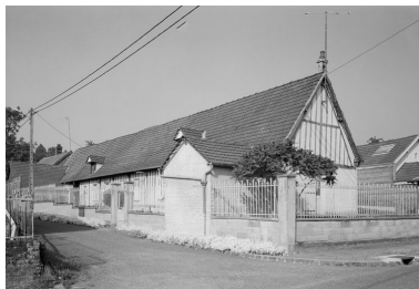
Elévation antérieure. IVR22_19856000881X