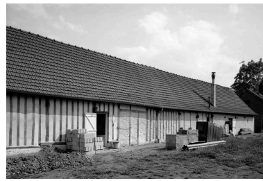
Elévation postérieure.