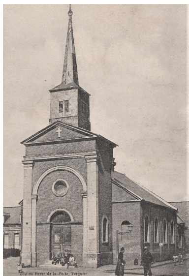
Tergnier. L'ancienne église (coll. part.).