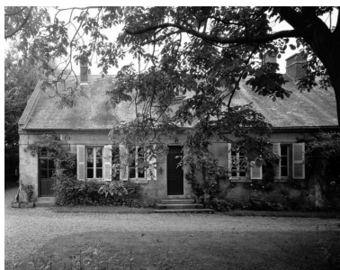
Élévation antérieure. IVR22_19846001114V