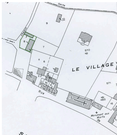
Plan de situation. Extrait du plan cadastral de 1982, section B1 8. IVR22_20096000017NUCA