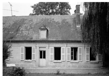
Élévation postérieure. IVR22_19846001057X