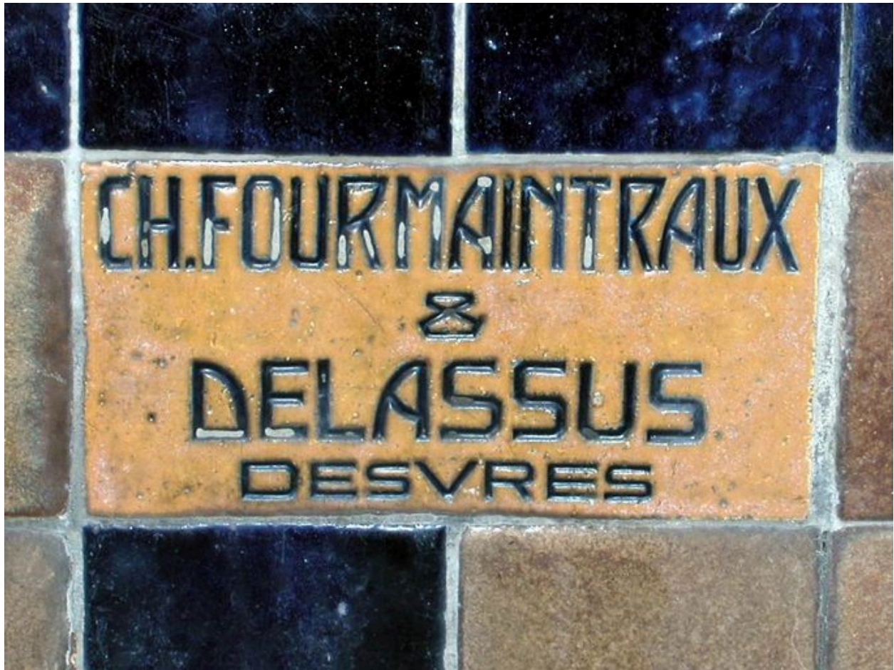
Détail du carreau de céramique portant signature du décor porté.