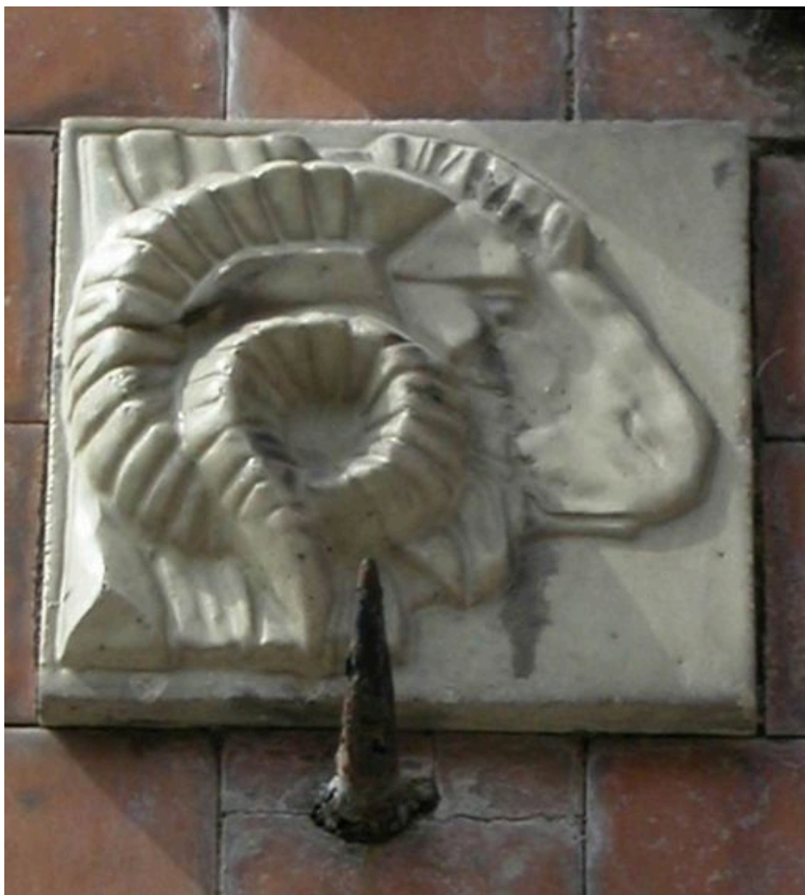
Détail du carreau de céramique figurant un bélier.