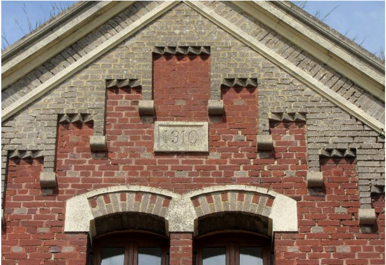
Détail de la date de 1910.