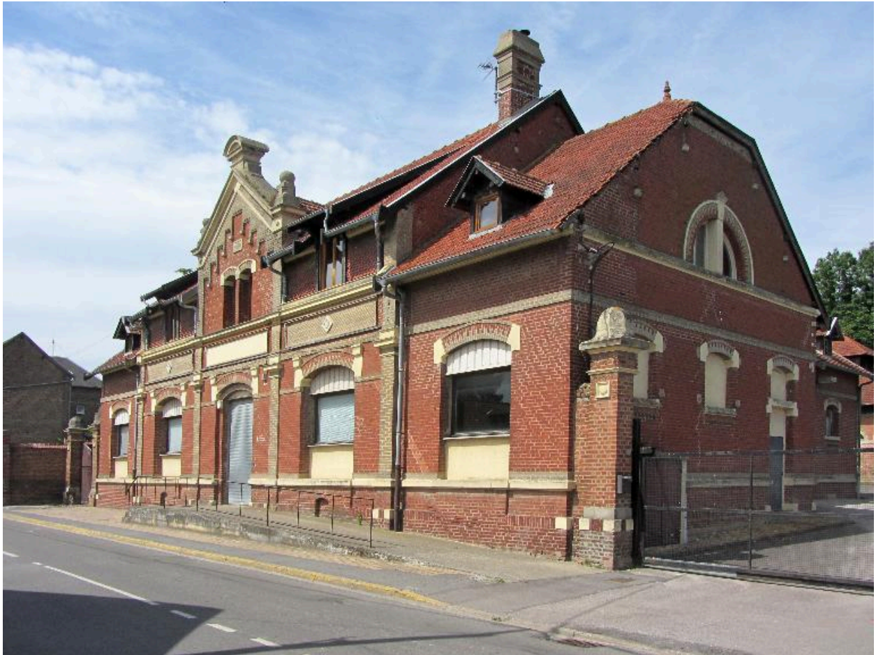
Façade sur rue, vue des trois quarts.