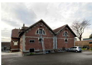
Façade postérieure du magasin de la Prévoyance. IVR22_20138000501NUC2A