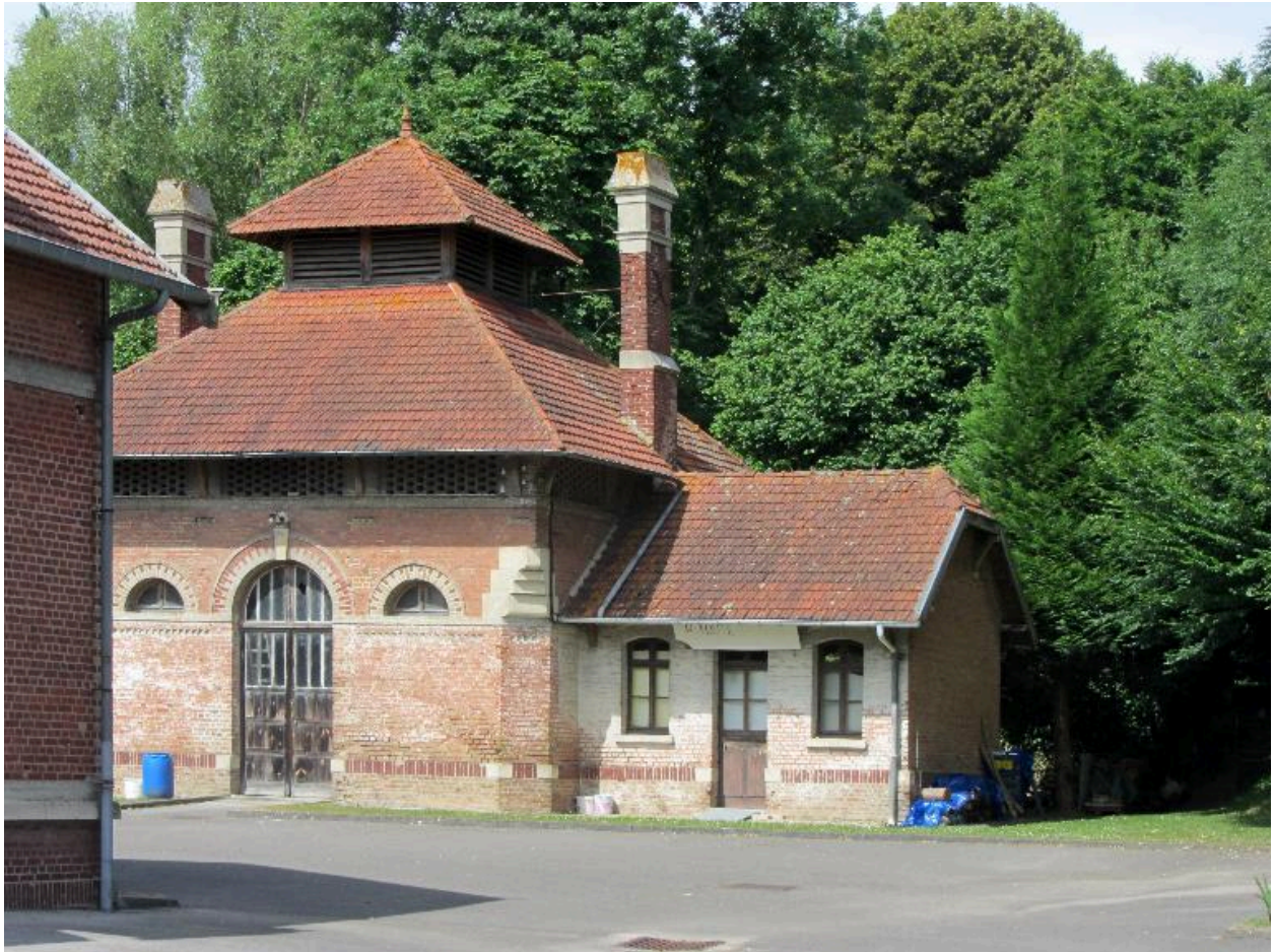
Façade sur cour des anciens abattoirs de la Prévoyance.