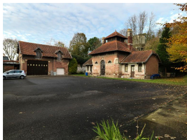
Vue d'ensemble des bâtiments sur cour. IVR22_20138000502NUC2A