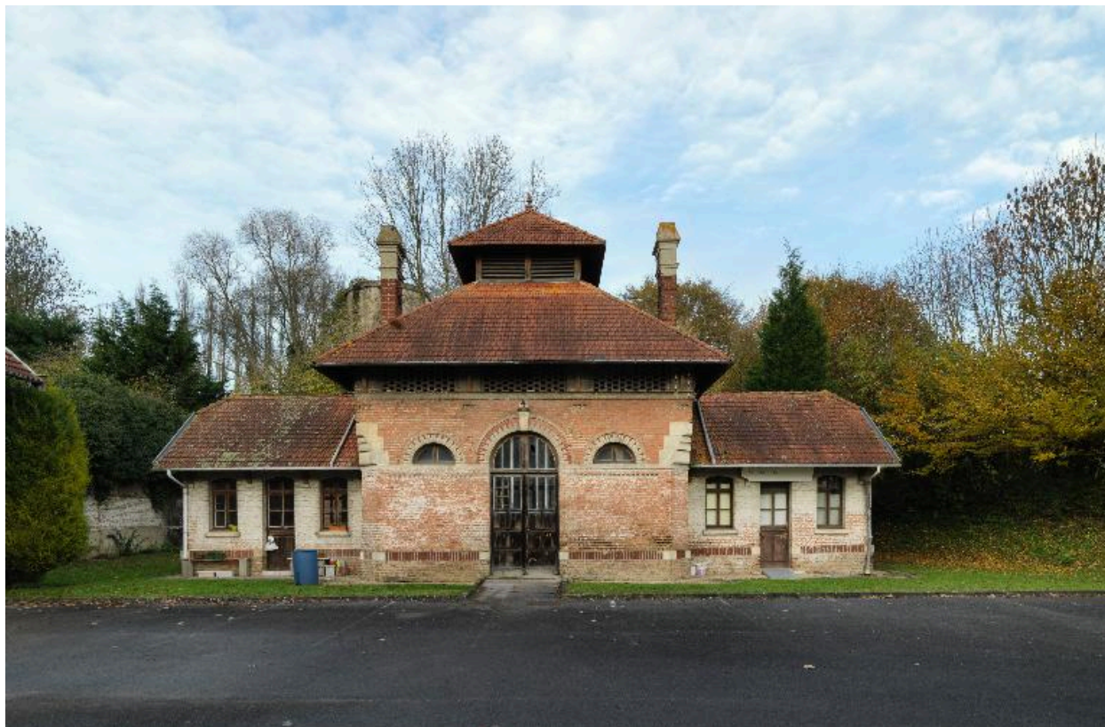
Façade sur cour de l'ancien abattoir, vue de face.