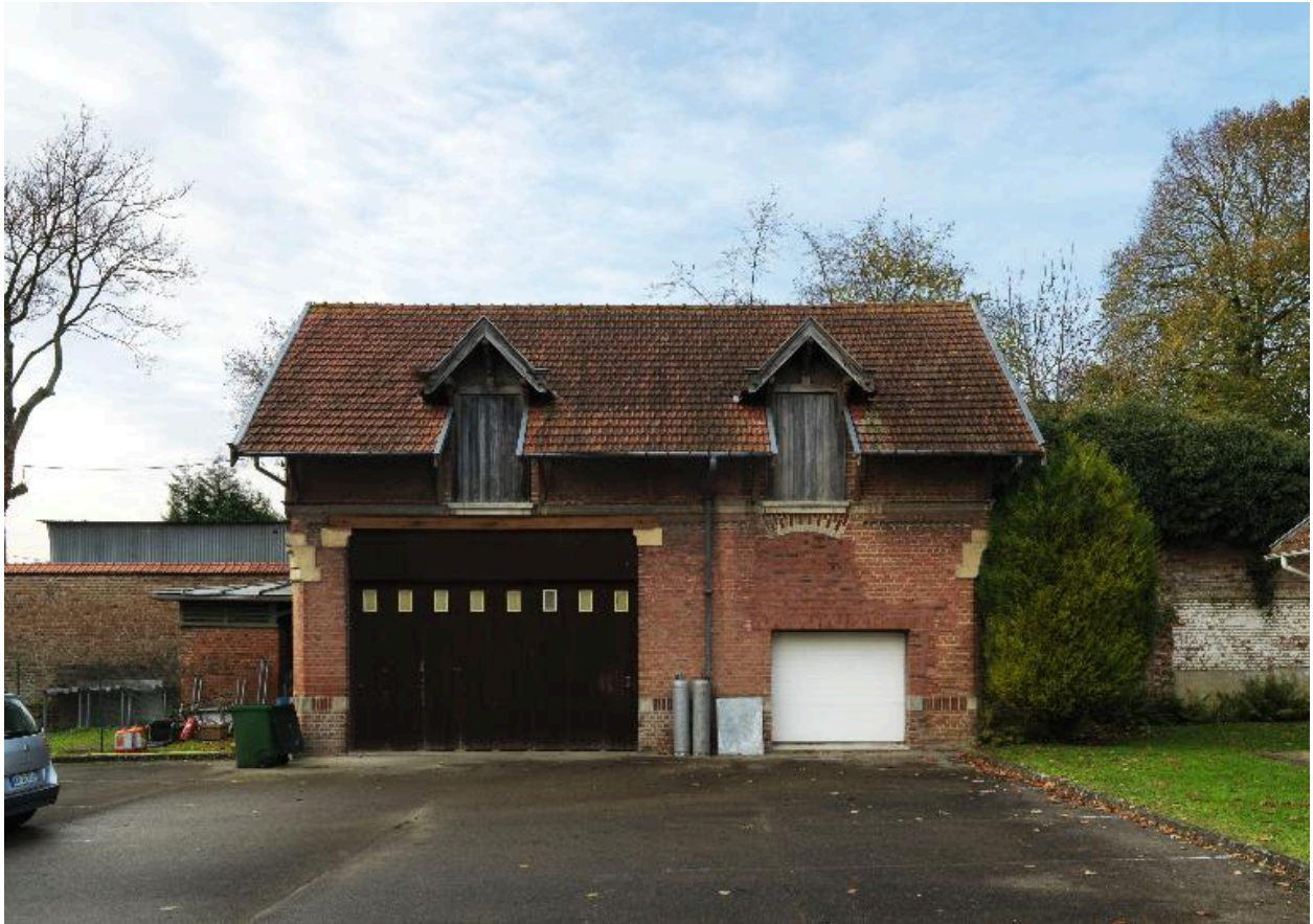
Façade sur cour du bûcher et de la la remise de la Prévoyance.