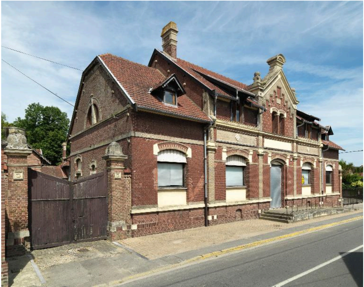
Vue d'ensemble de la façade sur rue.

IVR22_20138000425NUC2A Auteur de l'illustration : Thierry Lefébure (c) Région Hauts-de-France - Inventaire général reproduction soumise à autorisation du titulaire des droits d'exploitation