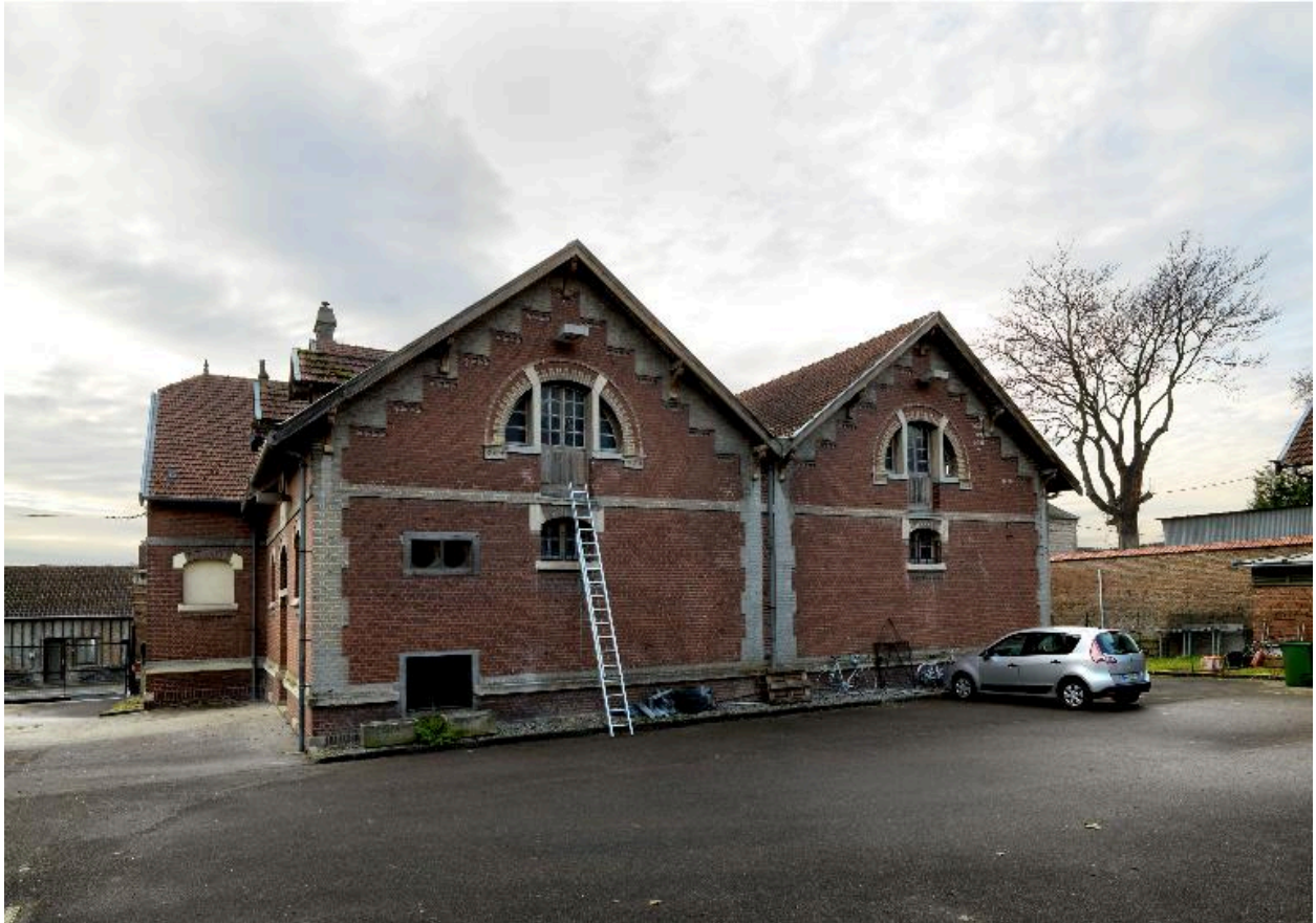
Façade postérieure du magasin de la Prévoyance.