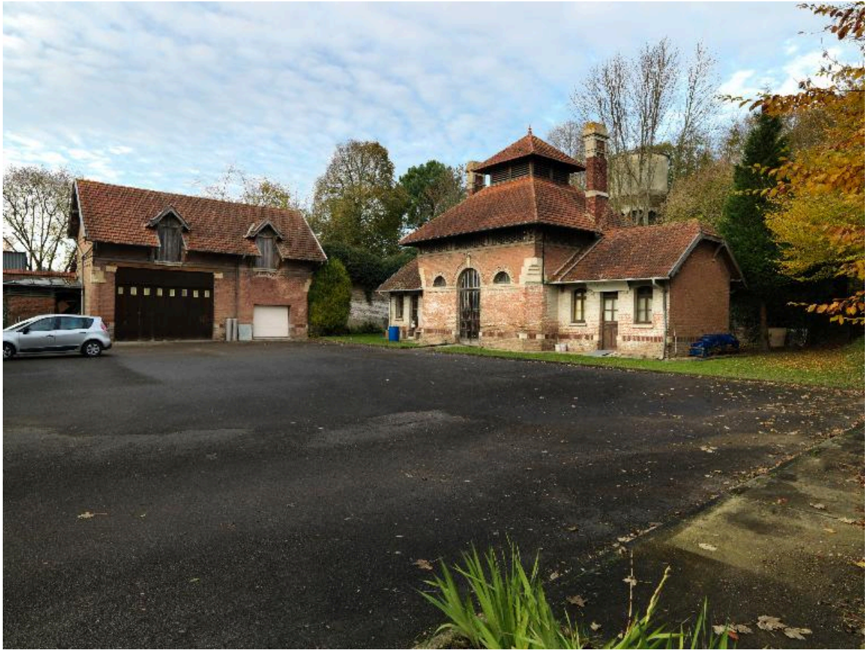
Vue d'ensemble des bâtiments sur cour.