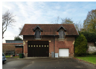
Façade sur cour du bûcher et de la la remise de la Prévoyance.