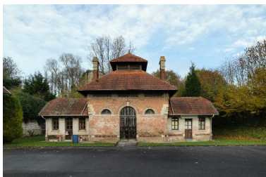
Façade sur cour de l'ancien abattoir, vue de face. IVR22_20138000504NUC2A