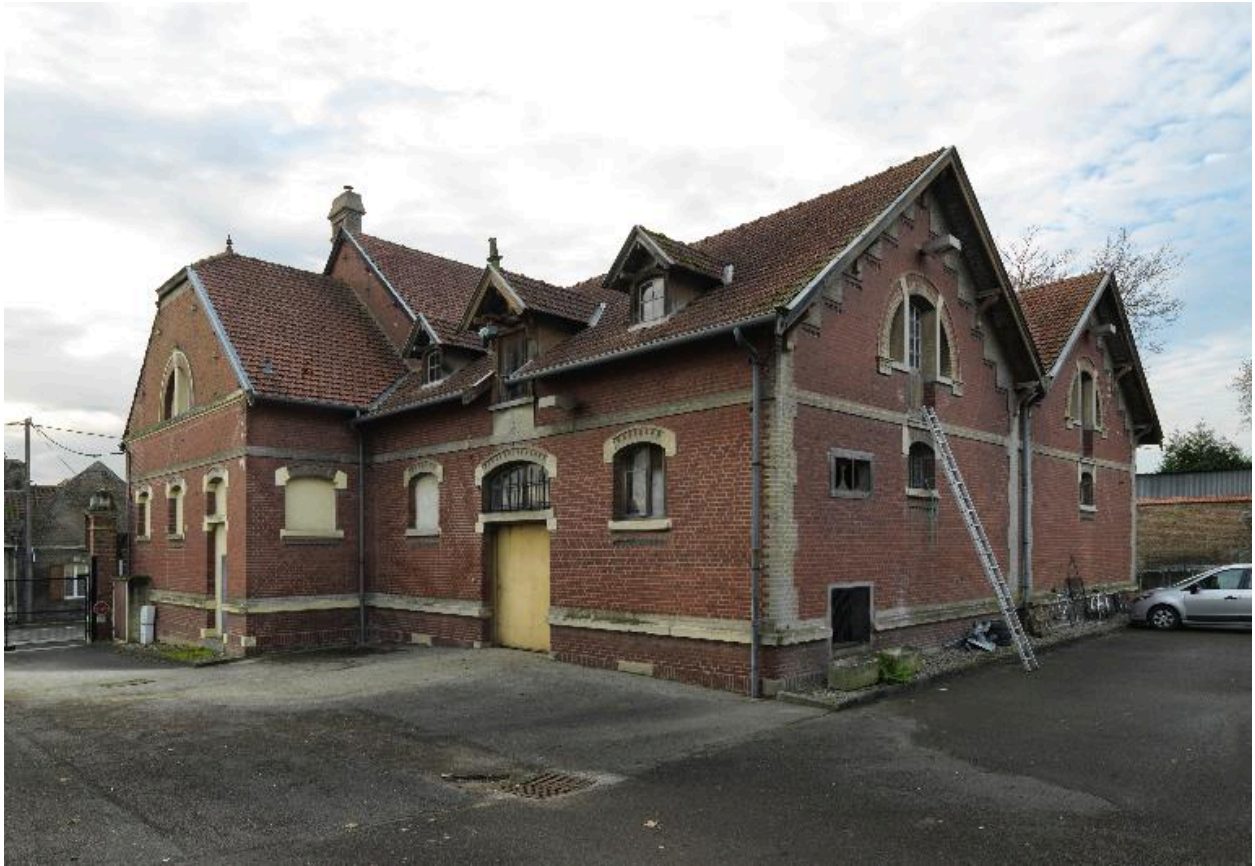
Vue d'ensemble du magasin de la prévoyance, vue de trois-quarts.