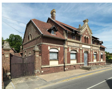
Vue d'ensemble de la façade sur rue. IVR22_20138000425NUC2A