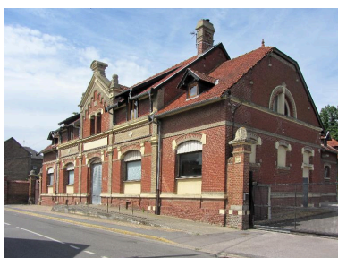
Façade sur rue, vue des trois quarts.