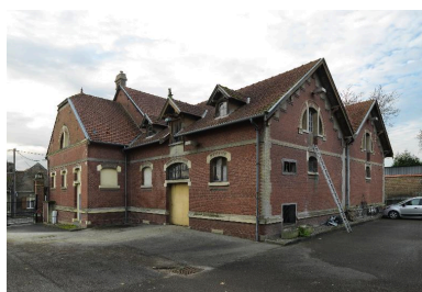
Vue d'ensemble du magasin de la prévoyance, vue de trois-quarts. IVR22_20138000500NUC2A