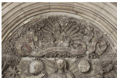
Vue de détail : registre supérieur du relief.