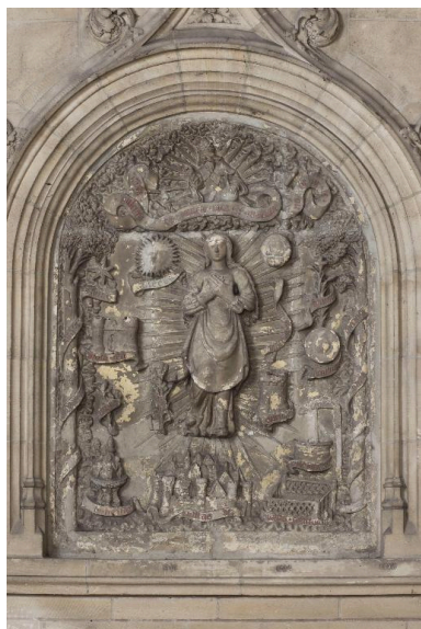
Vue générale. IVR22_20148000266NUC2A