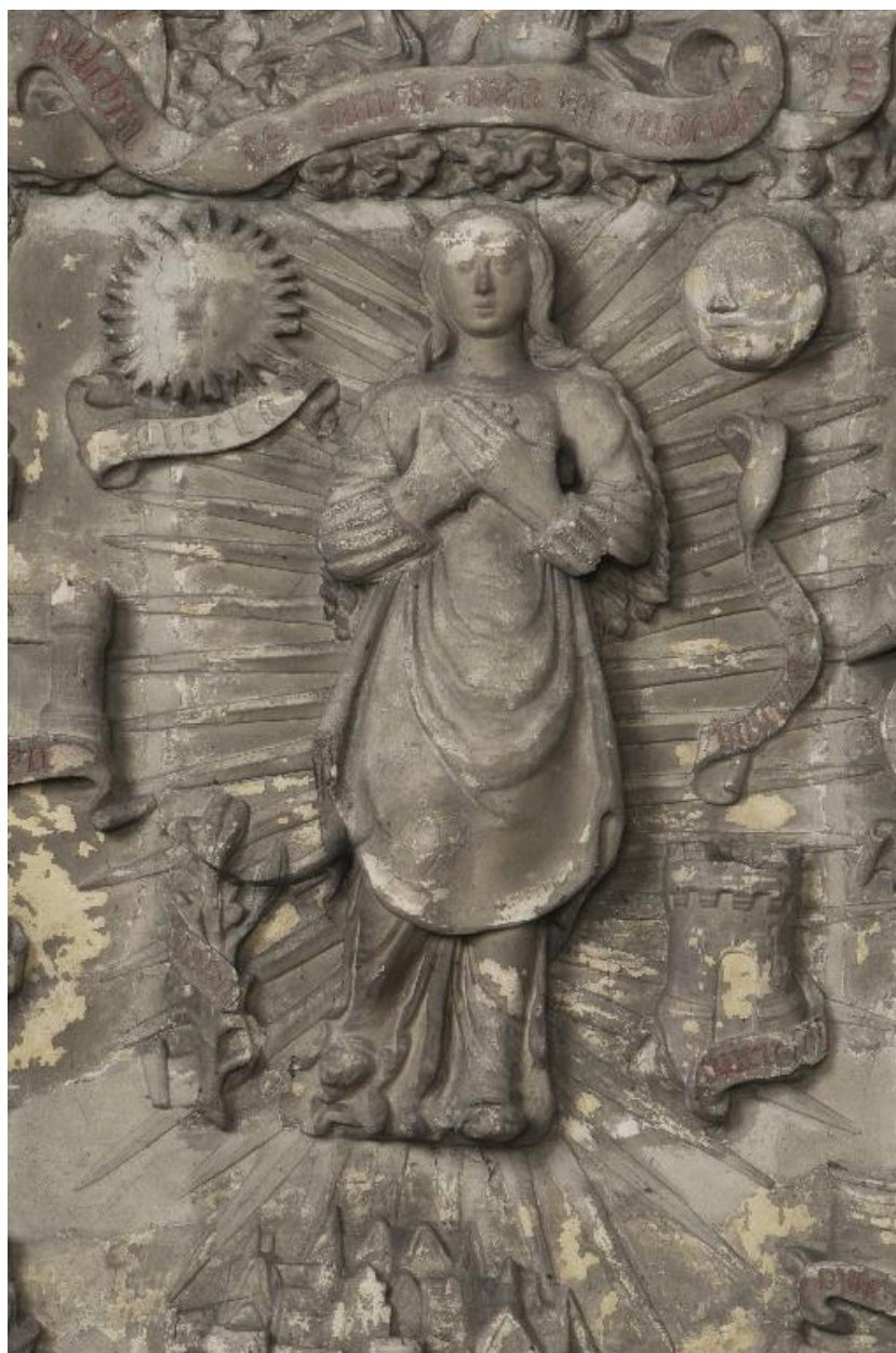
Vue de détail : la Vierge.