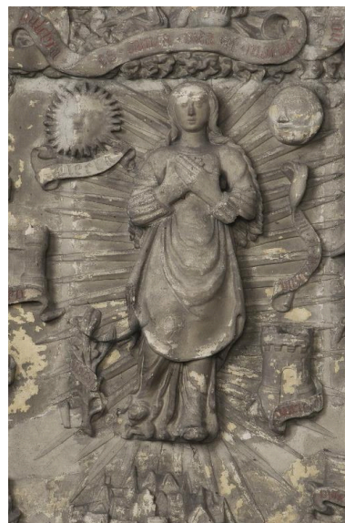
Vue de détail : la Vierge.