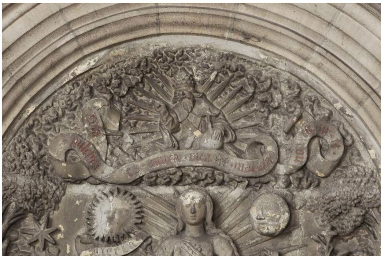
Vue de détail : registre supérieur du relief.