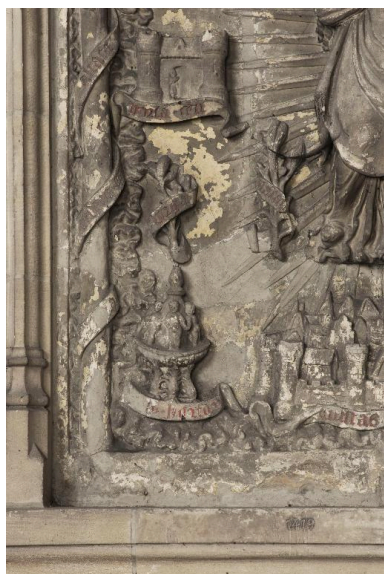
Vue de détail : la fontaine de jardin. IVR22_20148000269NUC2A