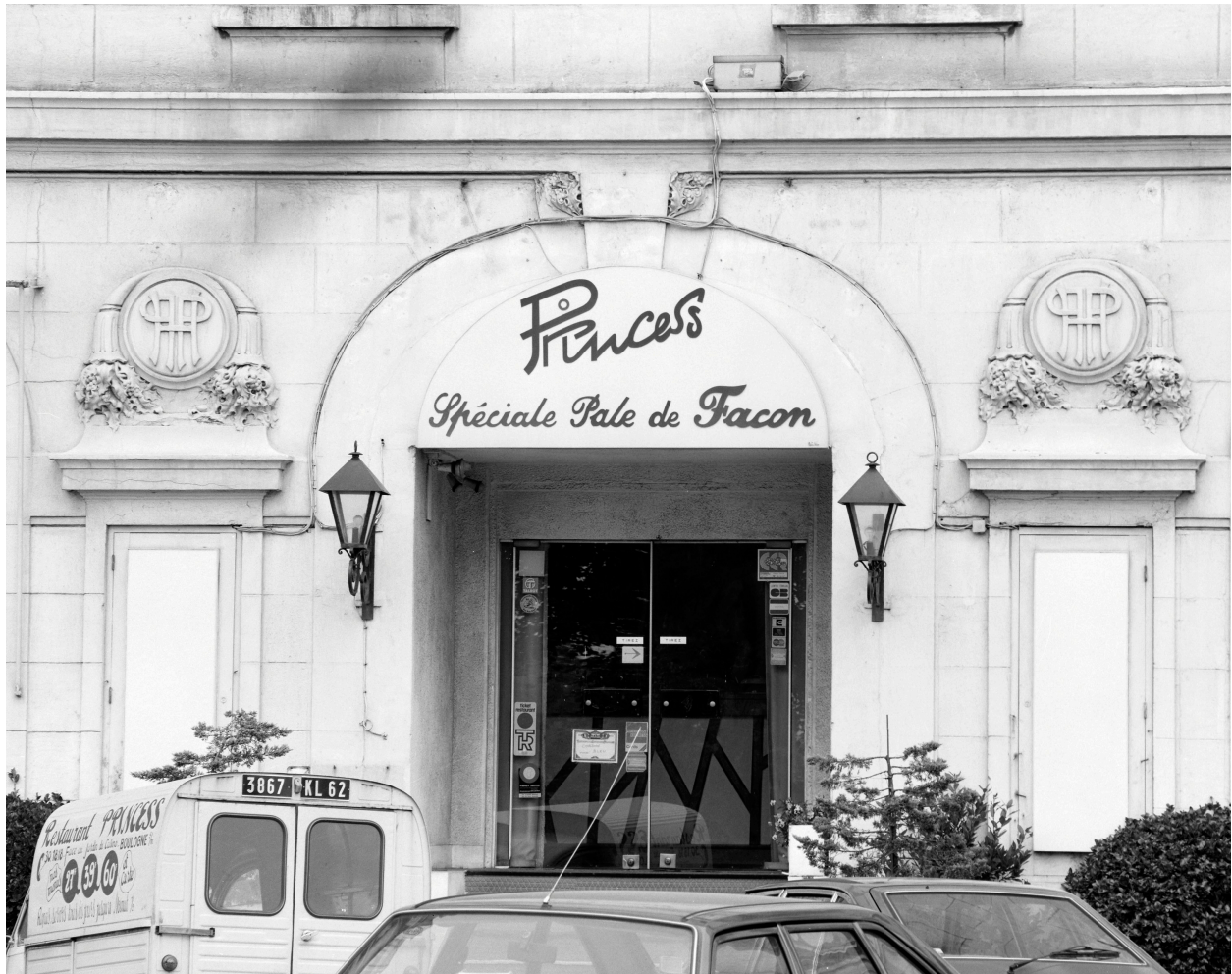
Façade sur boulevard.