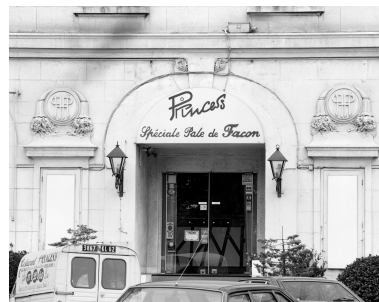
Façade sur boulevard. IVR31_19816203545X