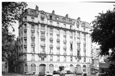
Vue d'angle ouest.