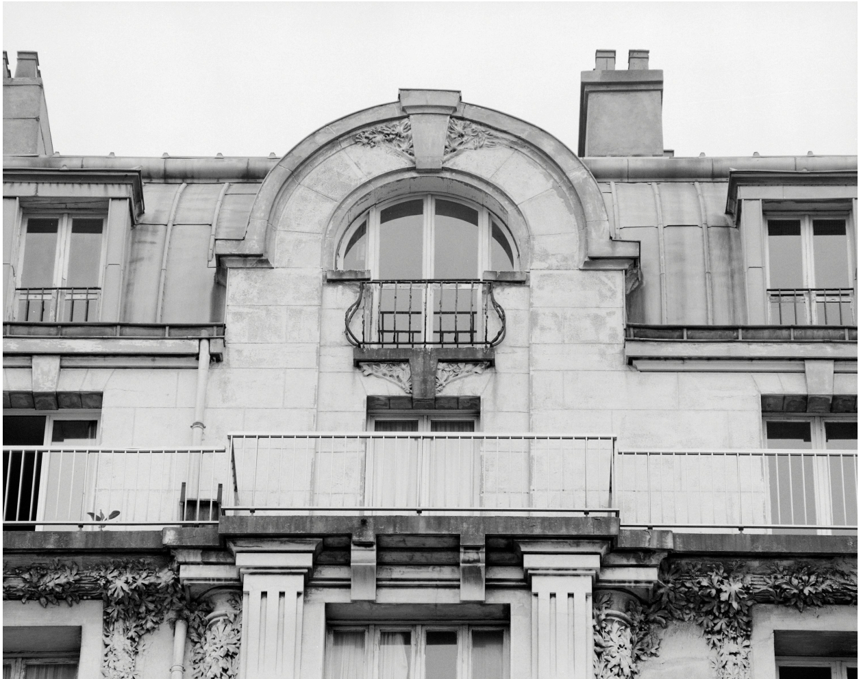
Façade sur boulevard, oriel-sur-le-pan, lucarne.