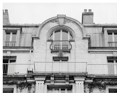
Façade sur boulevard, oriel-sur-le-pan, lucarne. IVR31_19816203546X