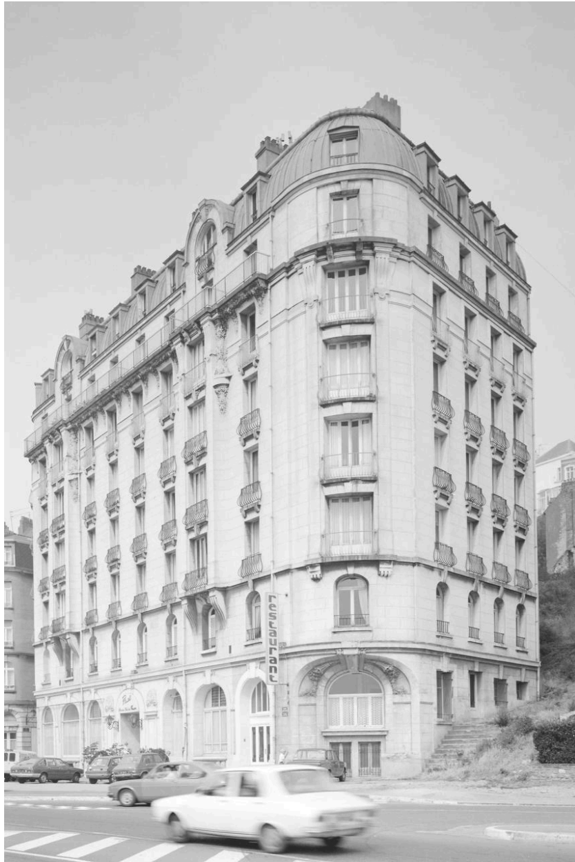
Vue d' angle sud.