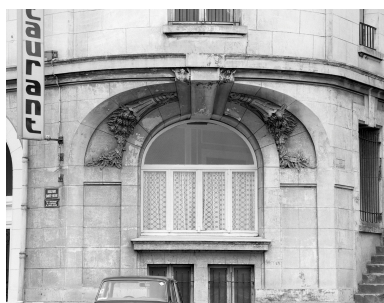
Pan coupé, rez-de-chaussée, fenêtre. IVR31_19816203548X