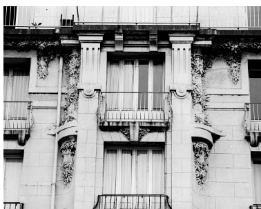
Façade sur boulevard, oriel-sur-le-pan, corniche.