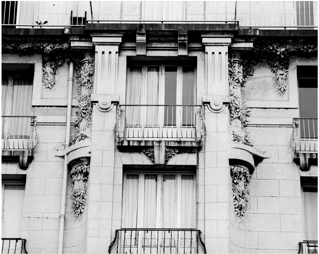
Façade sur boulevard, oriel-sur-le-pan, corniche.