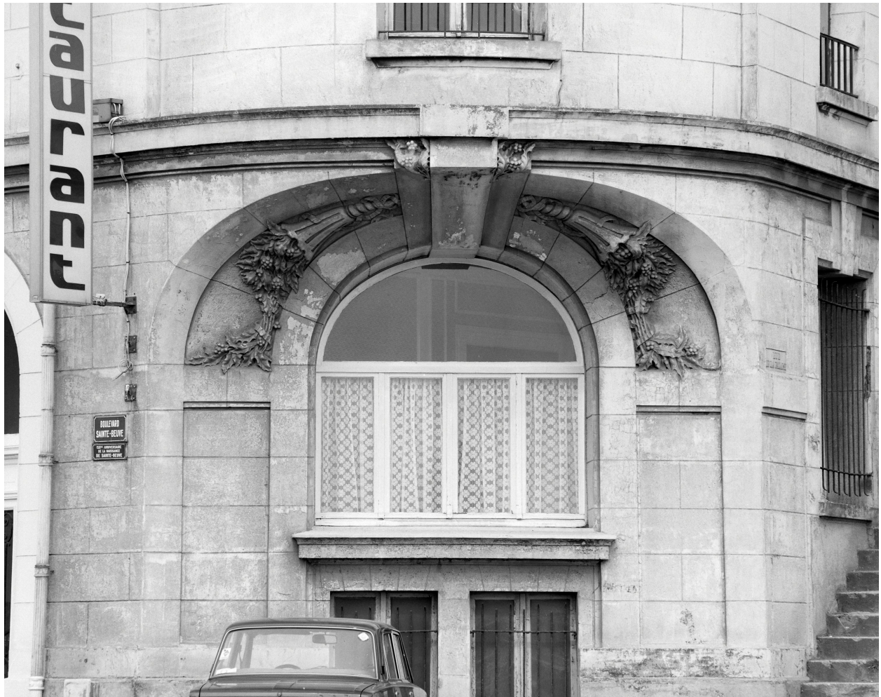
Pan coupé, rez-de-chaussée, fenêtre.