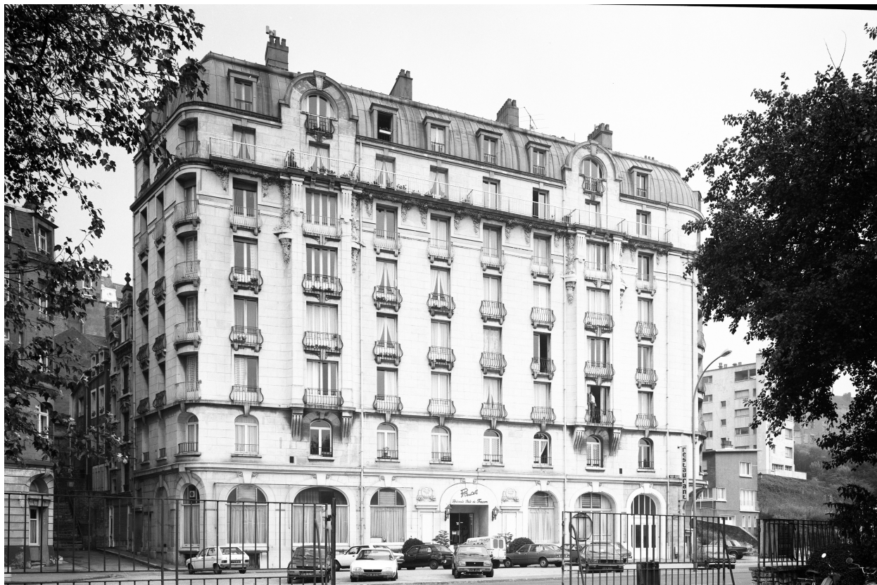
Vue d'angle ouest.