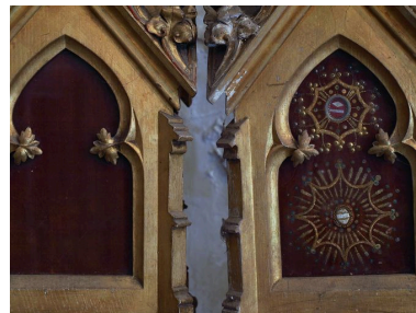
Vue partielle