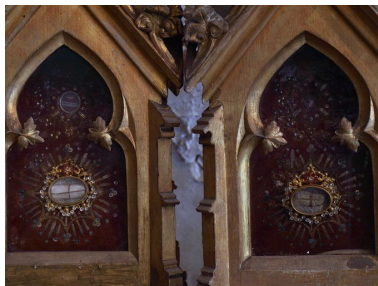
Vue partielle IVR31_20106202037NUCA