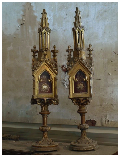
Vue générale IVR31_20106202036NUCA