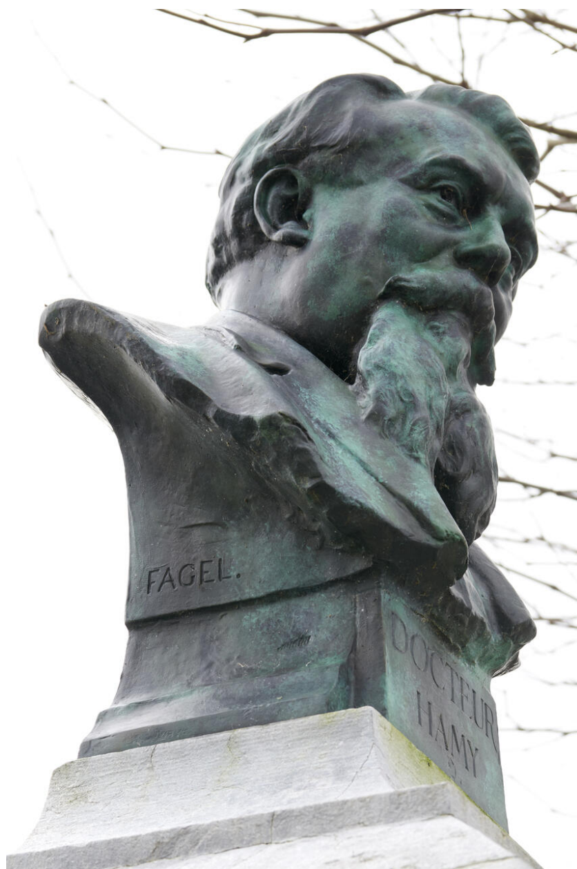
Vue de détail du buste et de la signature du sculpteur.