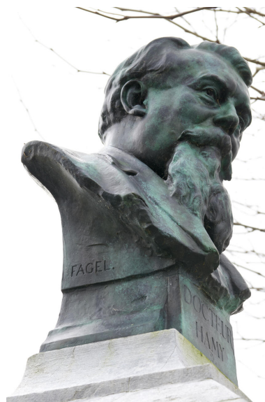
Vue de détail du buste et de la signature du sculpteur.

IVR32_20246200065NUCA