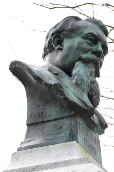
Vue de détail du buste et de la signature du sculpteur.

IVR32_20246200065NUCA