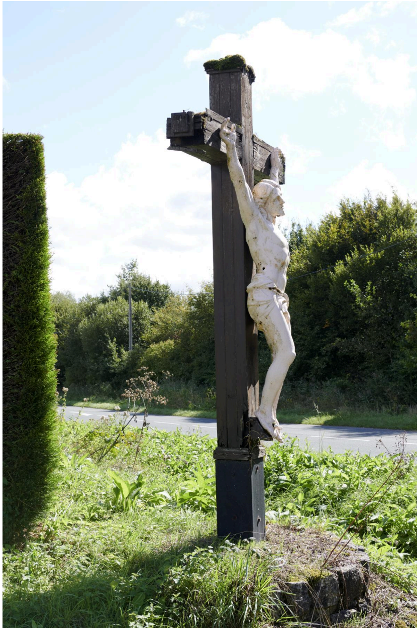
Profil de la croix.