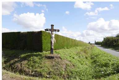
Croix dans son environnement.