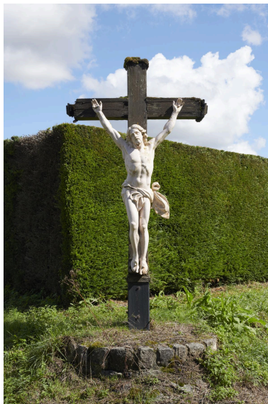
Vue générale de la croix de chemin. IVR32_20245903023NUCA