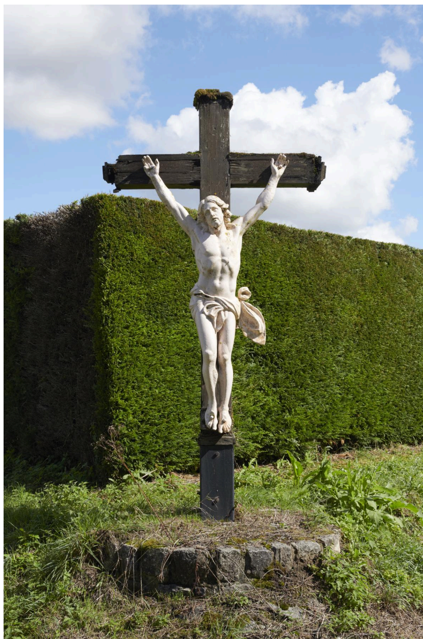
Vue générale de la croix de chemin.