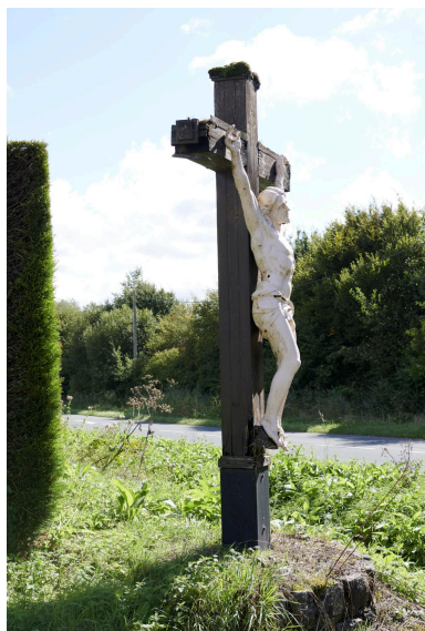
Profil de la croix. IVR32_20245903024NUCA