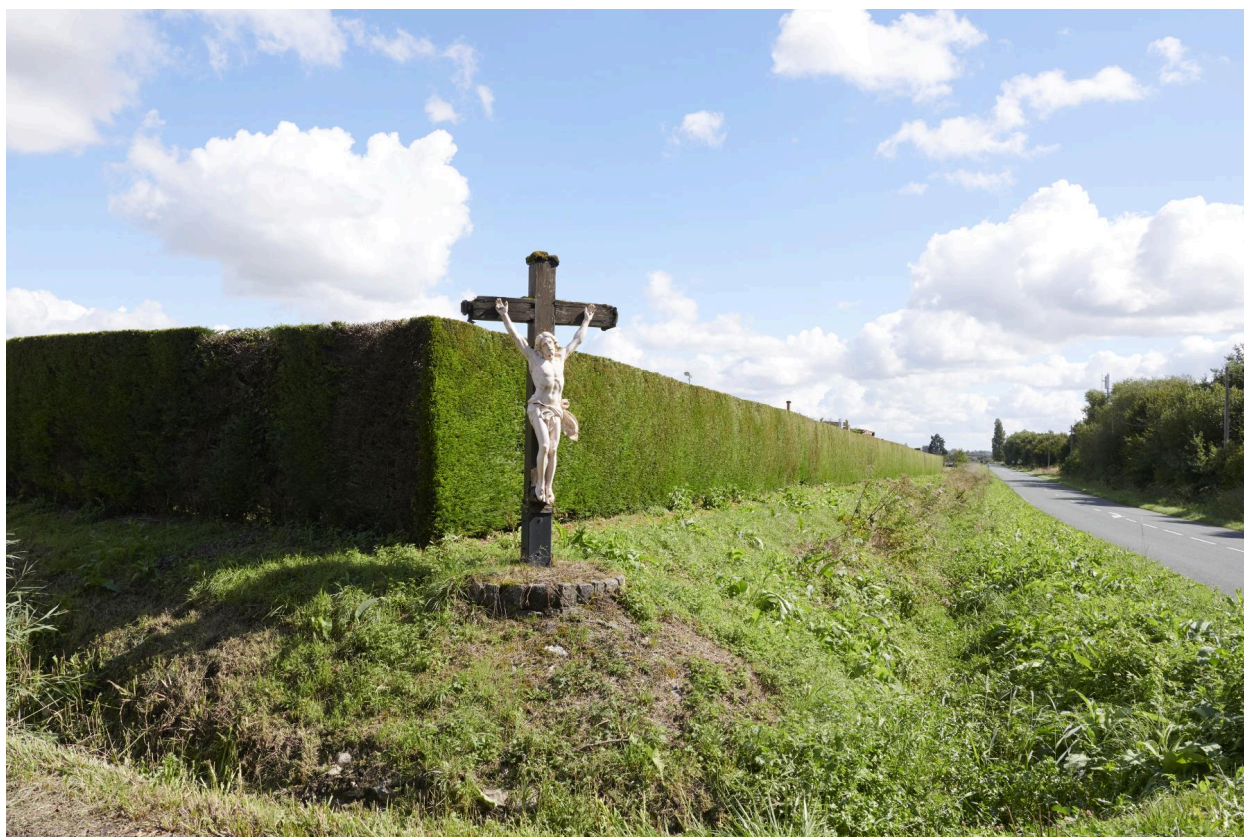
Croix dans son environnement.