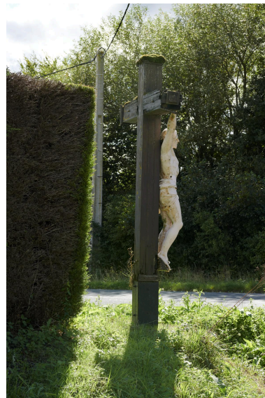
Profil et arrière de la croix. IVR32_20245903025NUCA