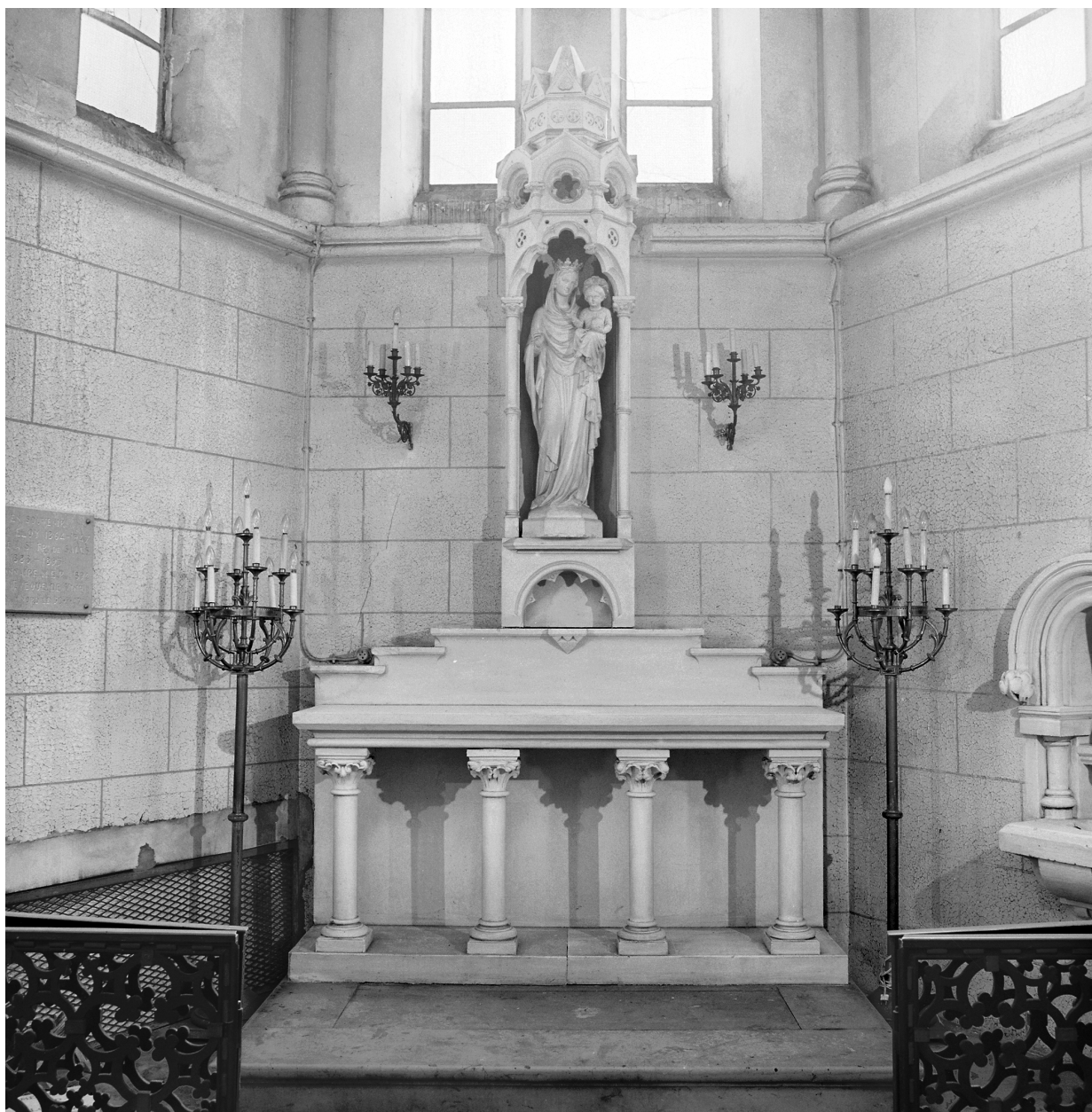
Autel-retable de la Vierge, un des éléments : vue d'ensemble.