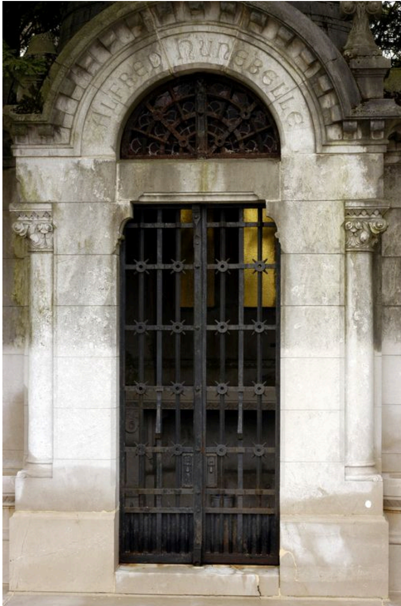
Vue de détail sur la porte.