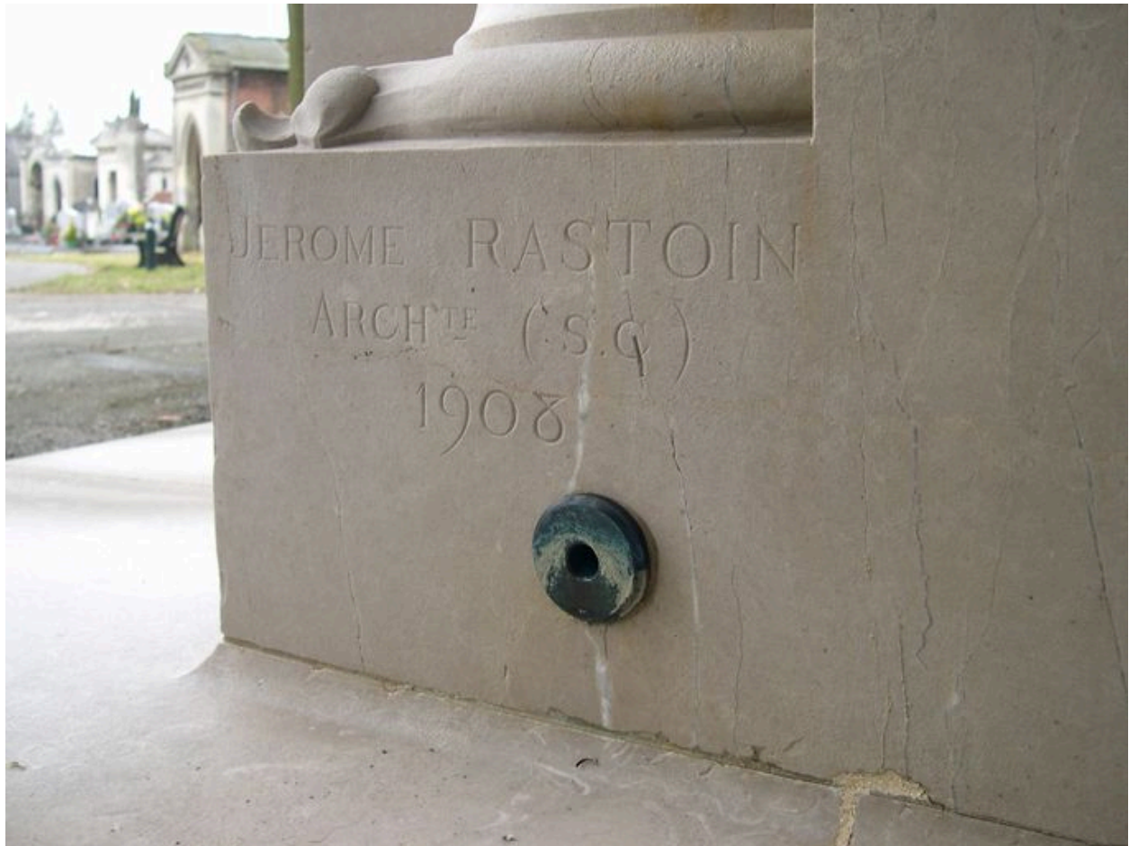
Vue de détail sur la signature.