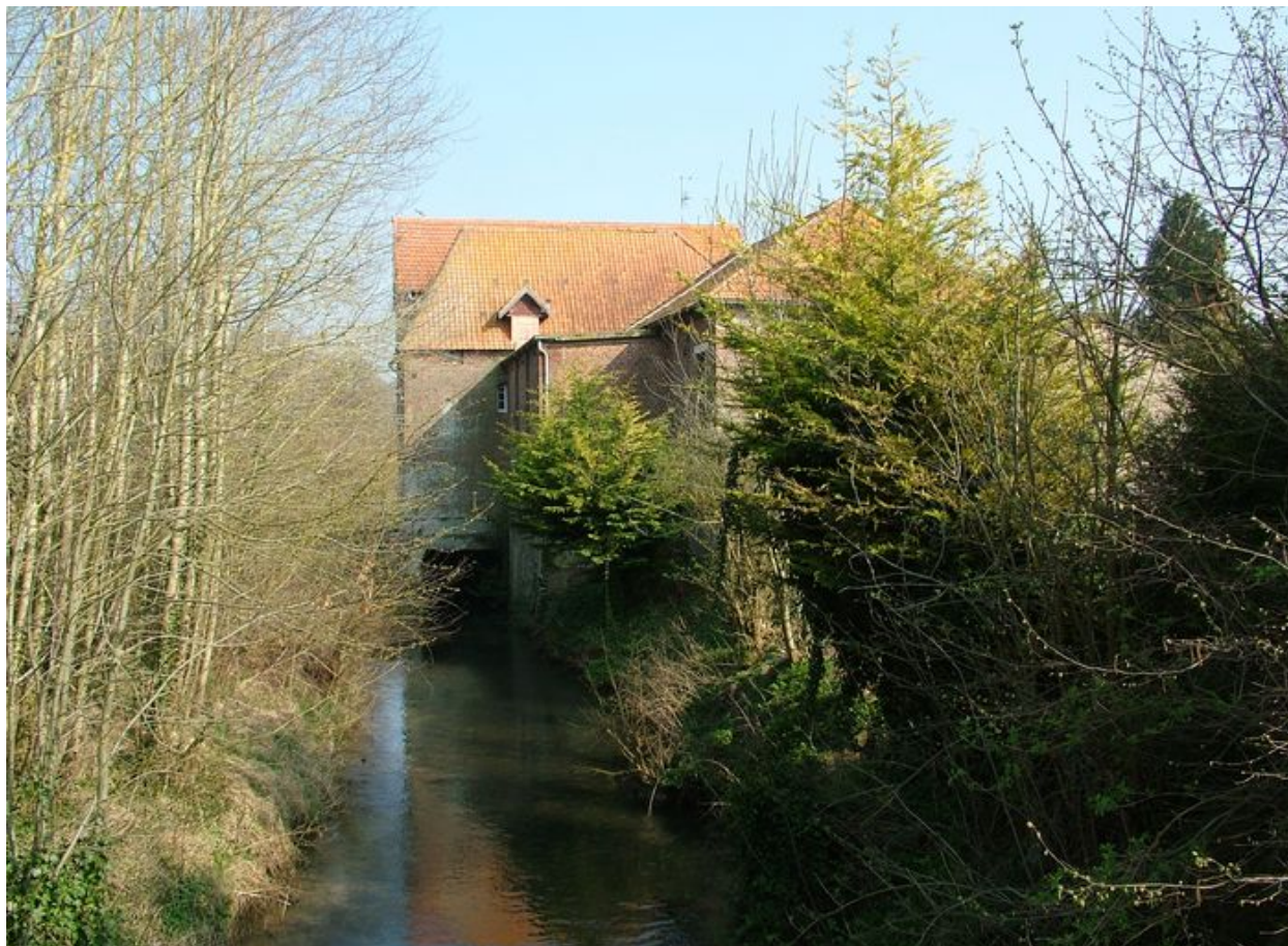
Vue du vannage et du bâtiment d'eau sur la Nièvre.