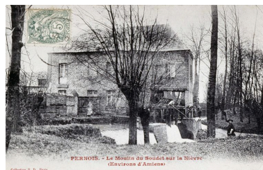
Vue générale depuis la rivière, avant 1914 (coll. part.). IVR22_20108000073XA

(reproduction) IVR22_20088015469NUCA