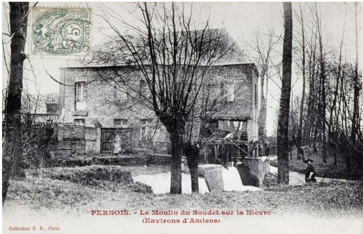
Vue générale depuis la rivière, avant 1914.