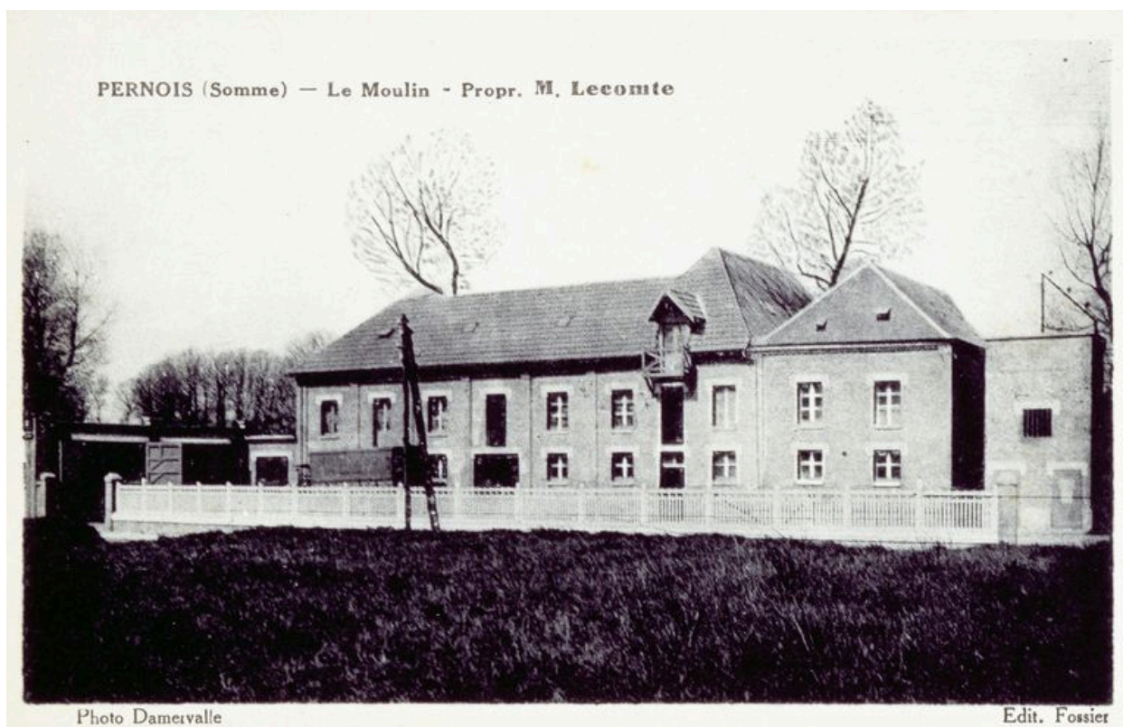
Vue générale depuis la route, avant 1933.