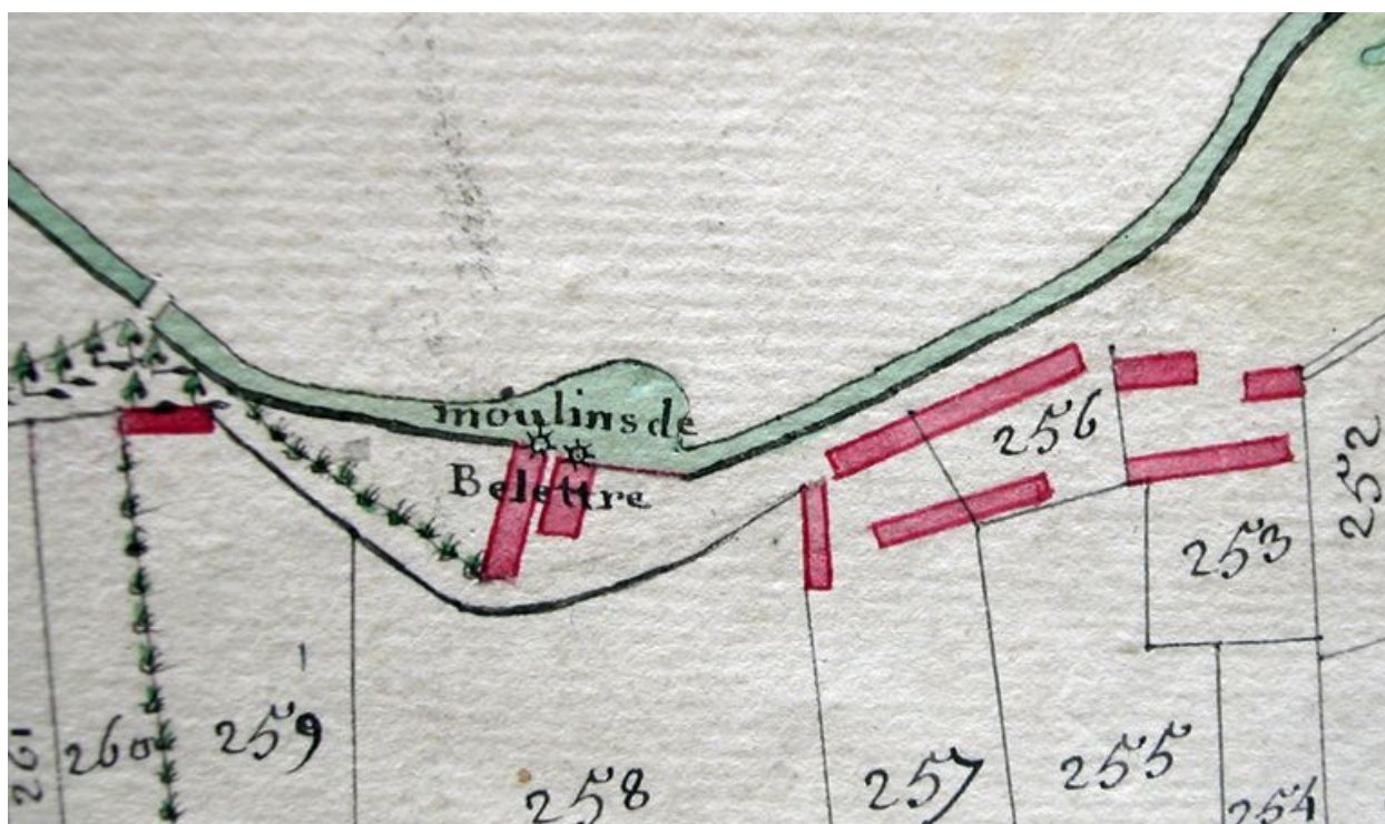
Extrait de l'atlas terrier, première carte, 4e quart 18e siècle (AD Somme ; 3G 79).