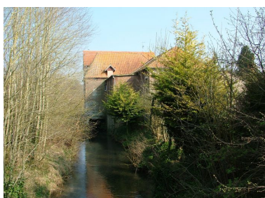
Vue du vannage et du bâtiment d'eau sur la Nièvre.

Phot. Frédéric Fournis IVR22_20098005079NUCA