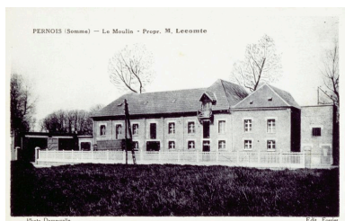
Vue générale depuis la route, avant 1933 (coll. part.).

Phot. Monnehay-Vulliet Marie-Laure IVR22_20108000072XA