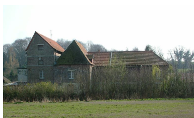
Vue générale sur la Nièvre.

IVR22_20098005403NUCA