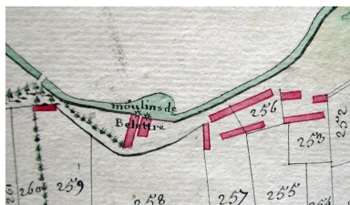
Extrait de l'atlas terrier, première carte, 4e quart 18e siècle (AD Somme ; 3G 79).

IVR22_20088015399NUCA