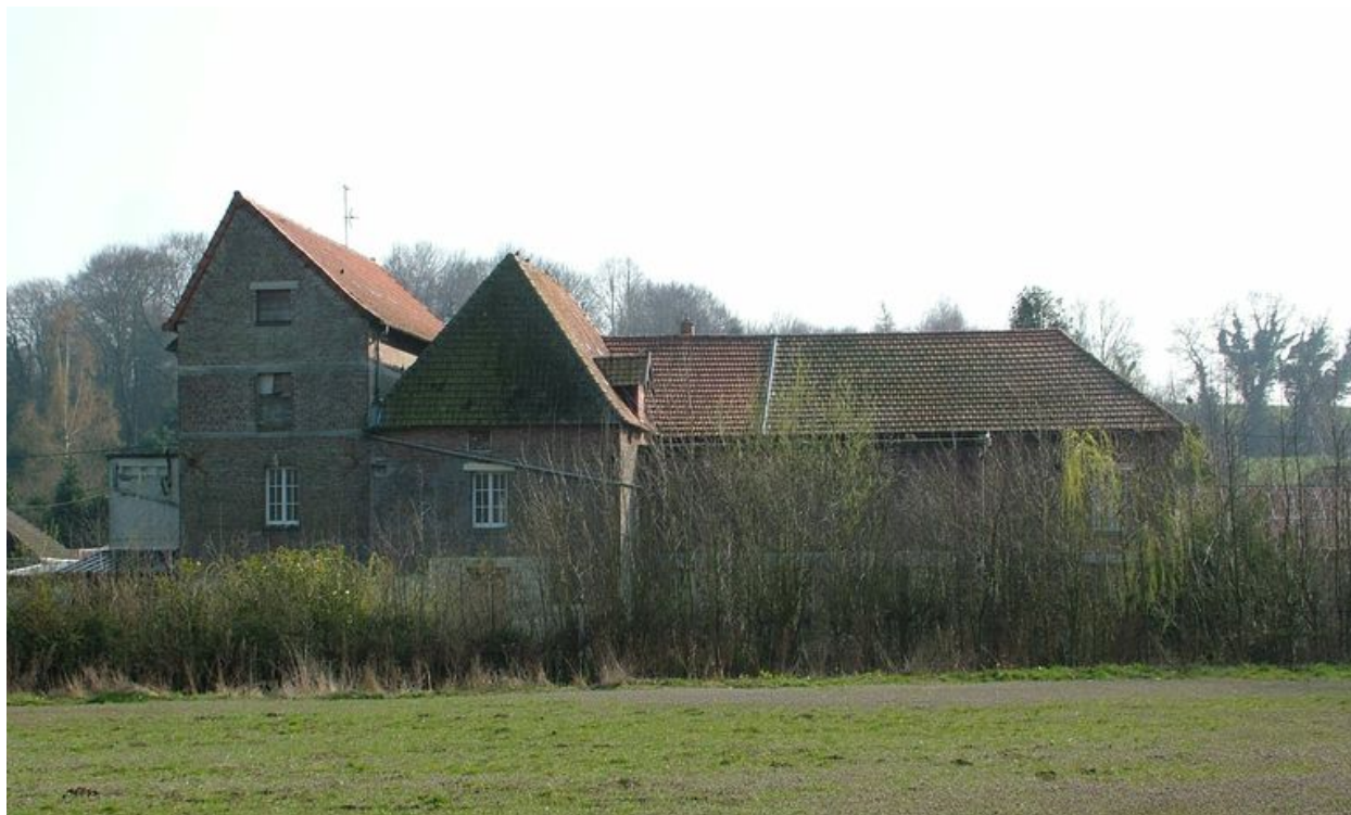
Vue générale sur la Nièvre.