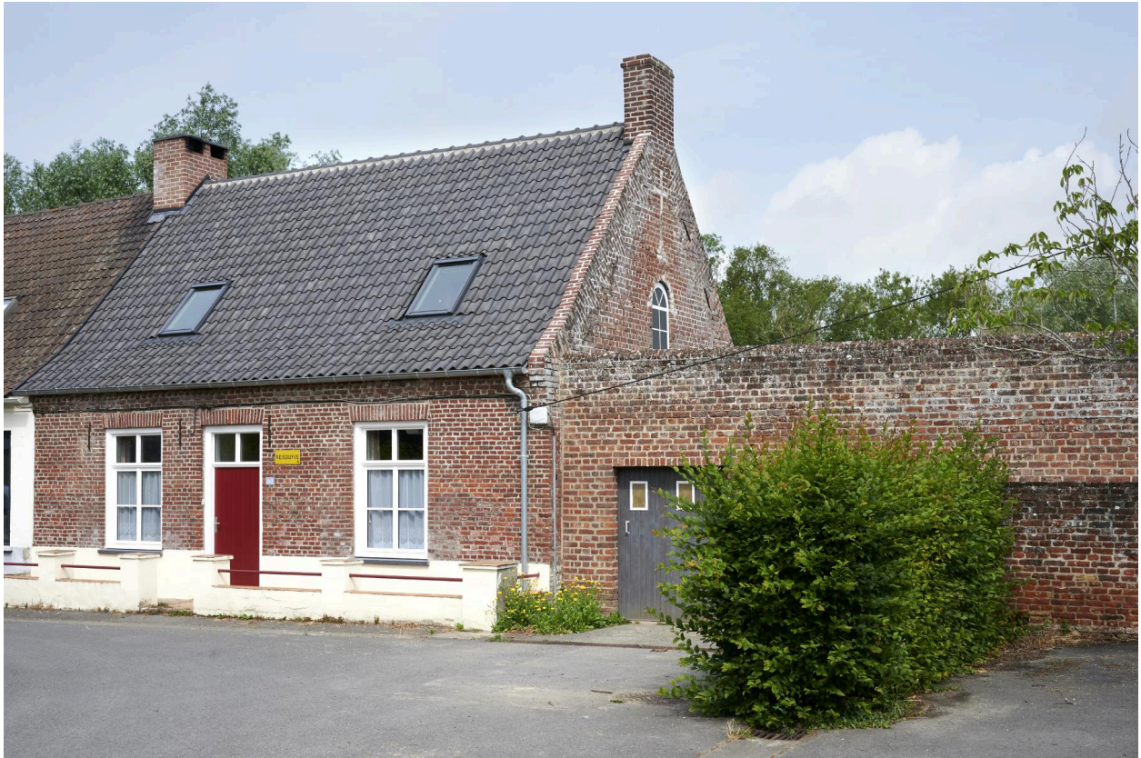
L'ancienne école, façade sur rue.