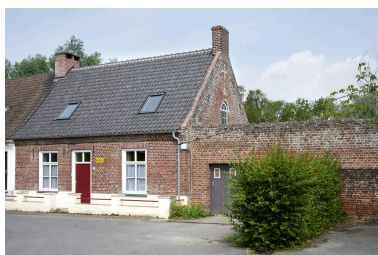
L'ancienne école, façade sur rue. IVR32_20235901156NUCA