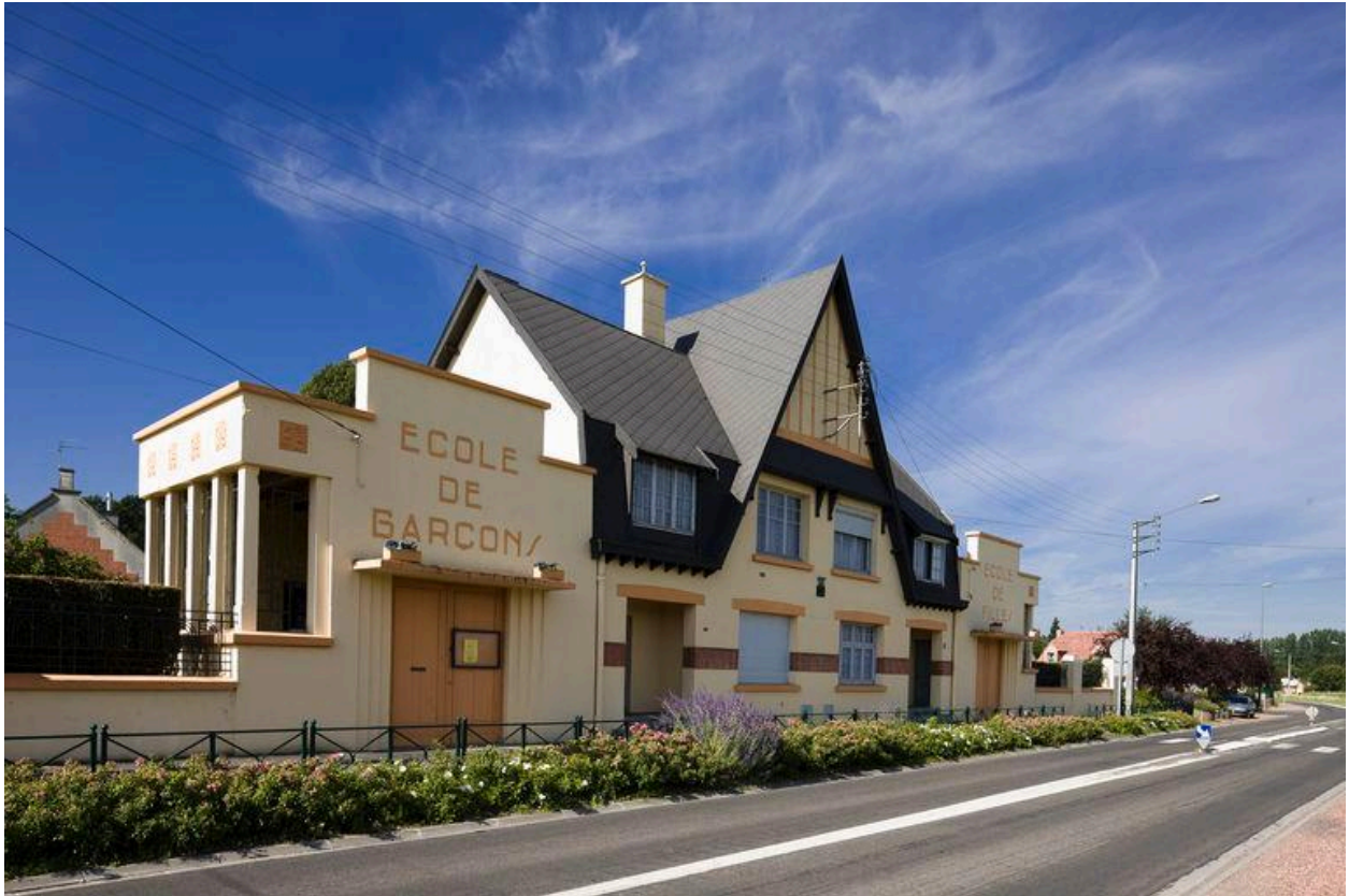
Vue générale de trois quarts depuis la rue.