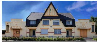
Vue générale de face. IVR31_20105900332NUCA