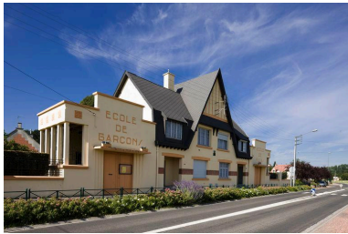
Vue générale de trois quarts depuis la rue.