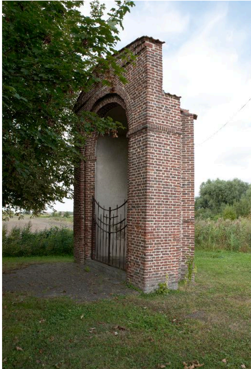
Vue générale de trois quarts.