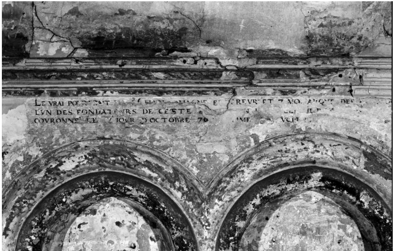
Détail de l'inscription.