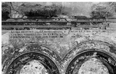
Détail de l'inscription. IVR22_19846000766X

IVR22_19846000844V