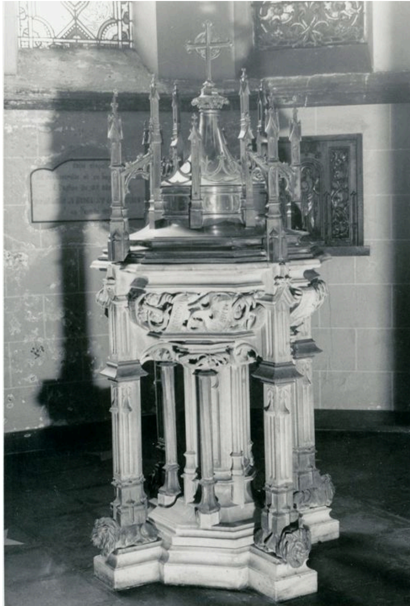
Vue générale (phot. Wintrebert, 1978, fonds AOA62)