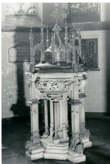
Vue générale IVR31_20106202029NUC