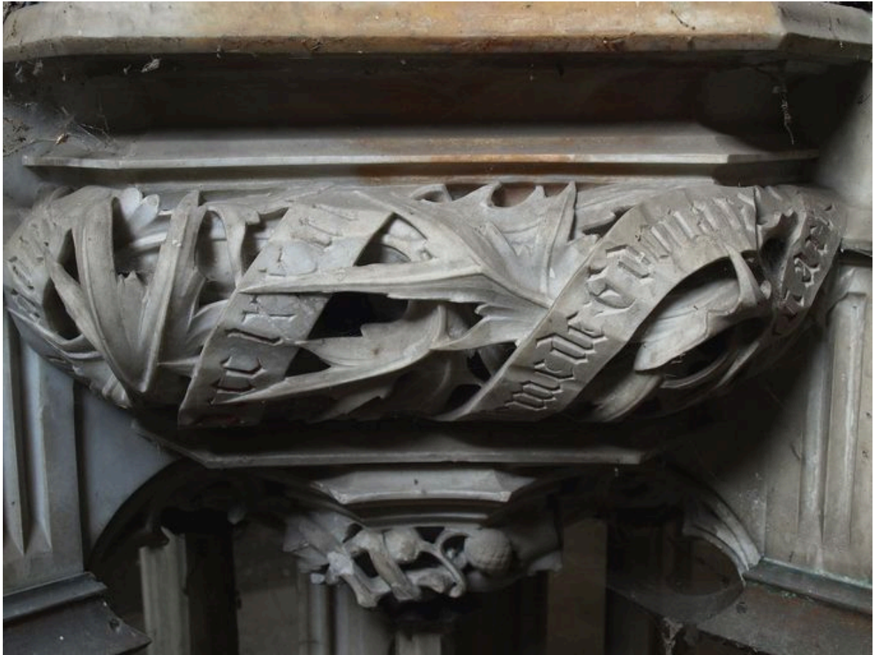
Vue de détail, inscription