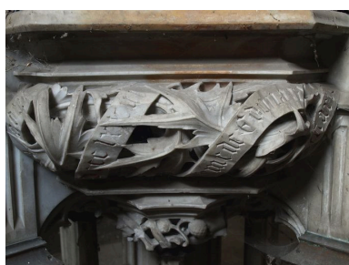
Vue de détail, inscription IVR31_20106202014NUCA