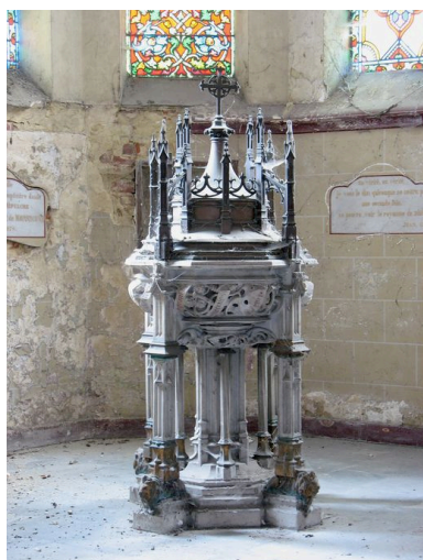
Vue générale IVR31_20106202012NUCA