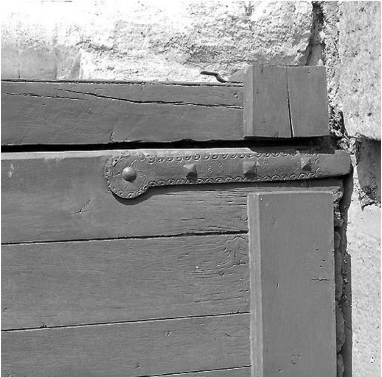
Vue d'une des deux pentures.