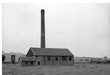
Le hangar et la cheminée d'usine portant la date de 1919. IVR22_19856000968X