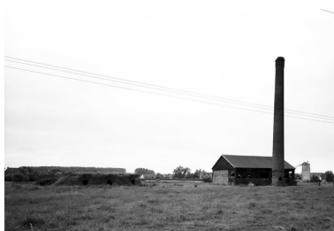
La briqueterie avec les vestiges du four à gauche, le hangar et la cheminée d'usine à droite. IVR22_19856000967X