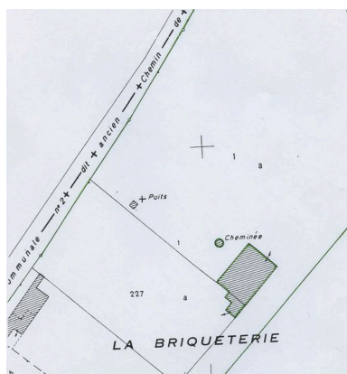
Plan de situation. Extrait du plan cadastral de 1982, section AB 227 et 1.

Repro. Marie-Laure Monnehay- Vulliet, Autr. Michel Hérold IVR22_20096000164NUC2A