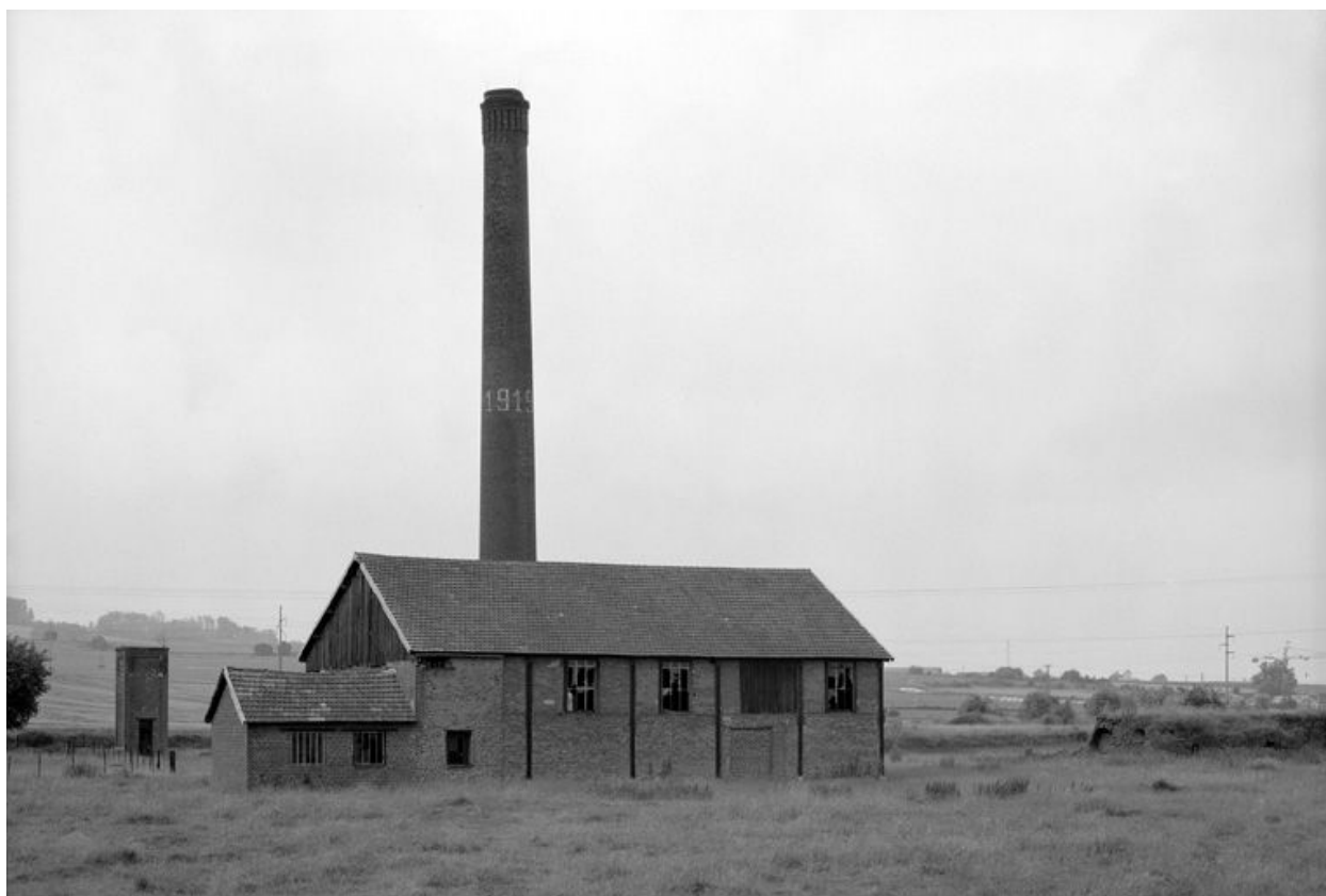
Le hangar et la cheminée d'usine portant la date de 1919.