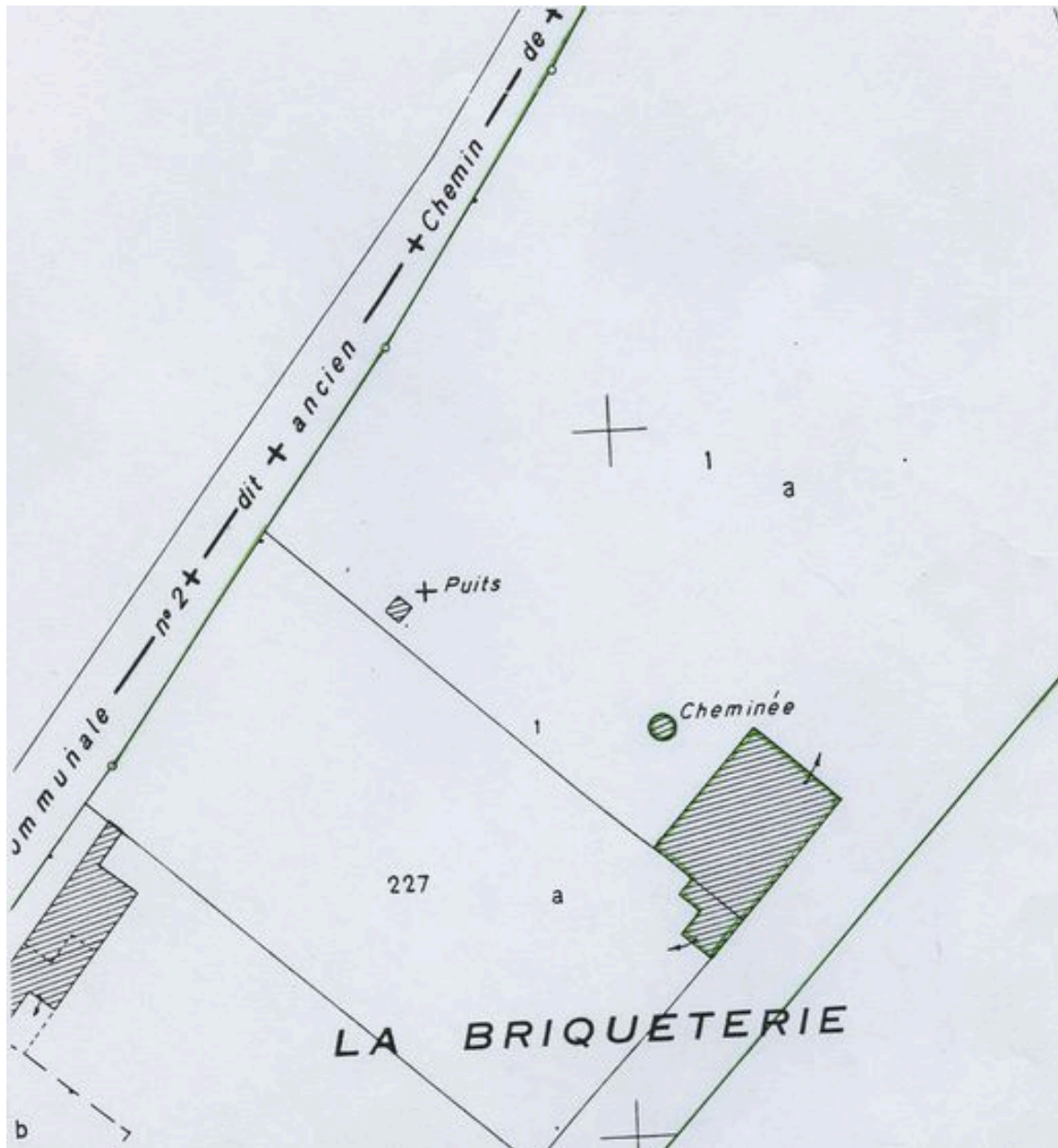
Plan de situation. Extrait du plan cadastral de 1982, section AB 227 et 1.