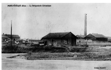
La briqueterie avant 1914 (AP).