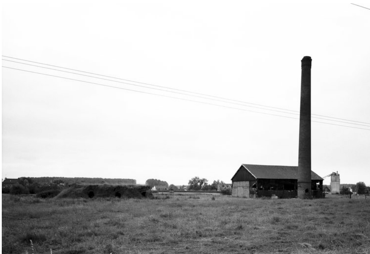
La briqueterie avec les vestiges du four à gauche, le hangar et la cheminée d'usine à droite.