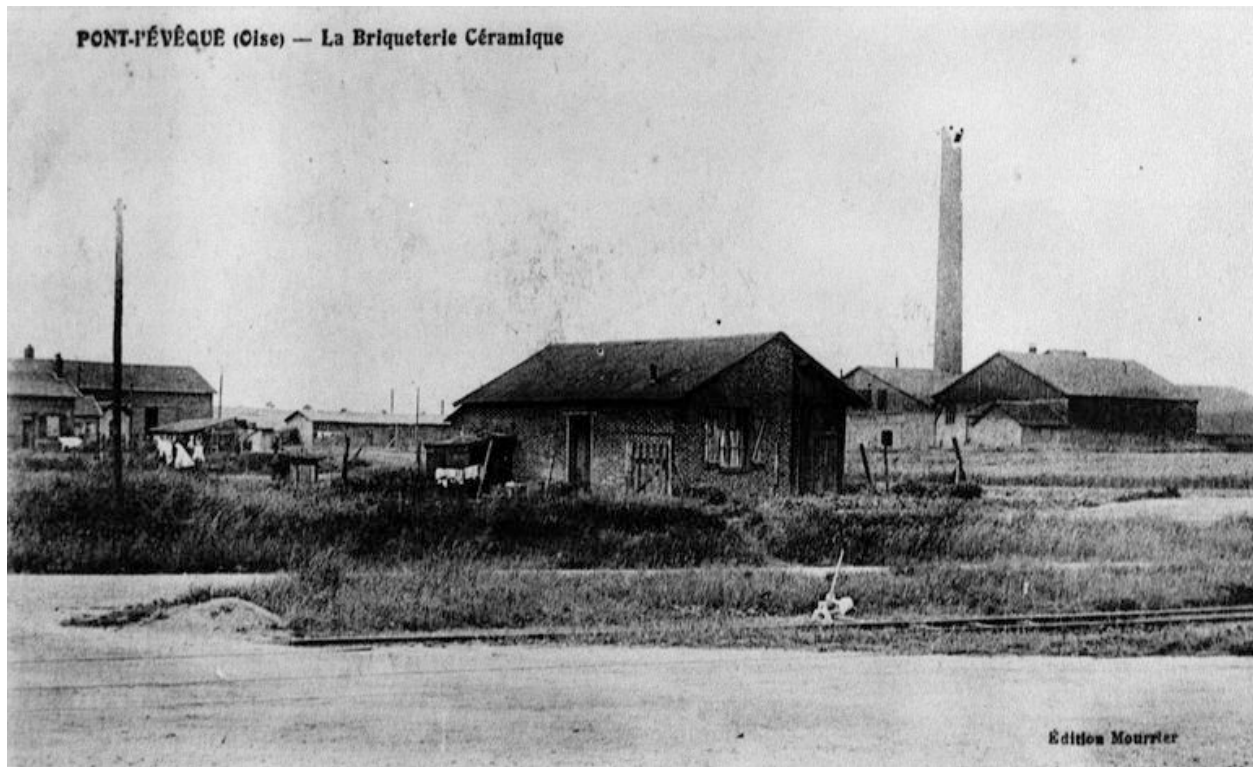
La briqueterie avant 1914 (AP).