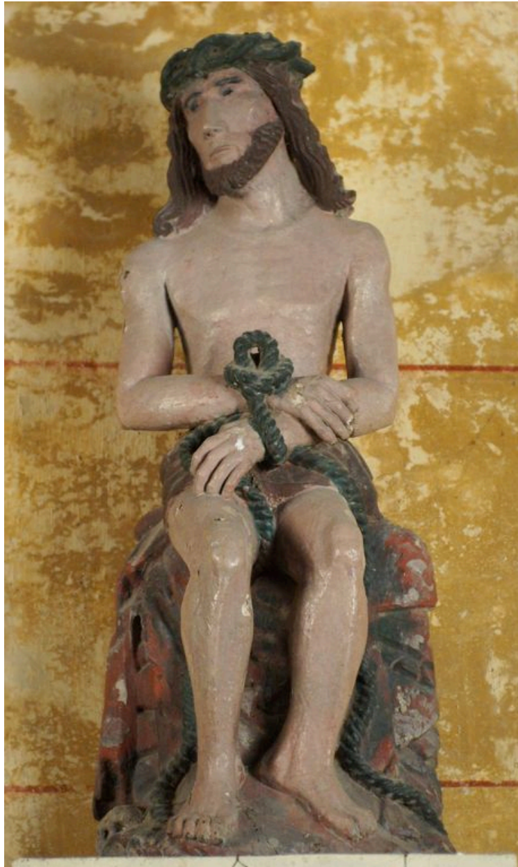
Vue générale de face.