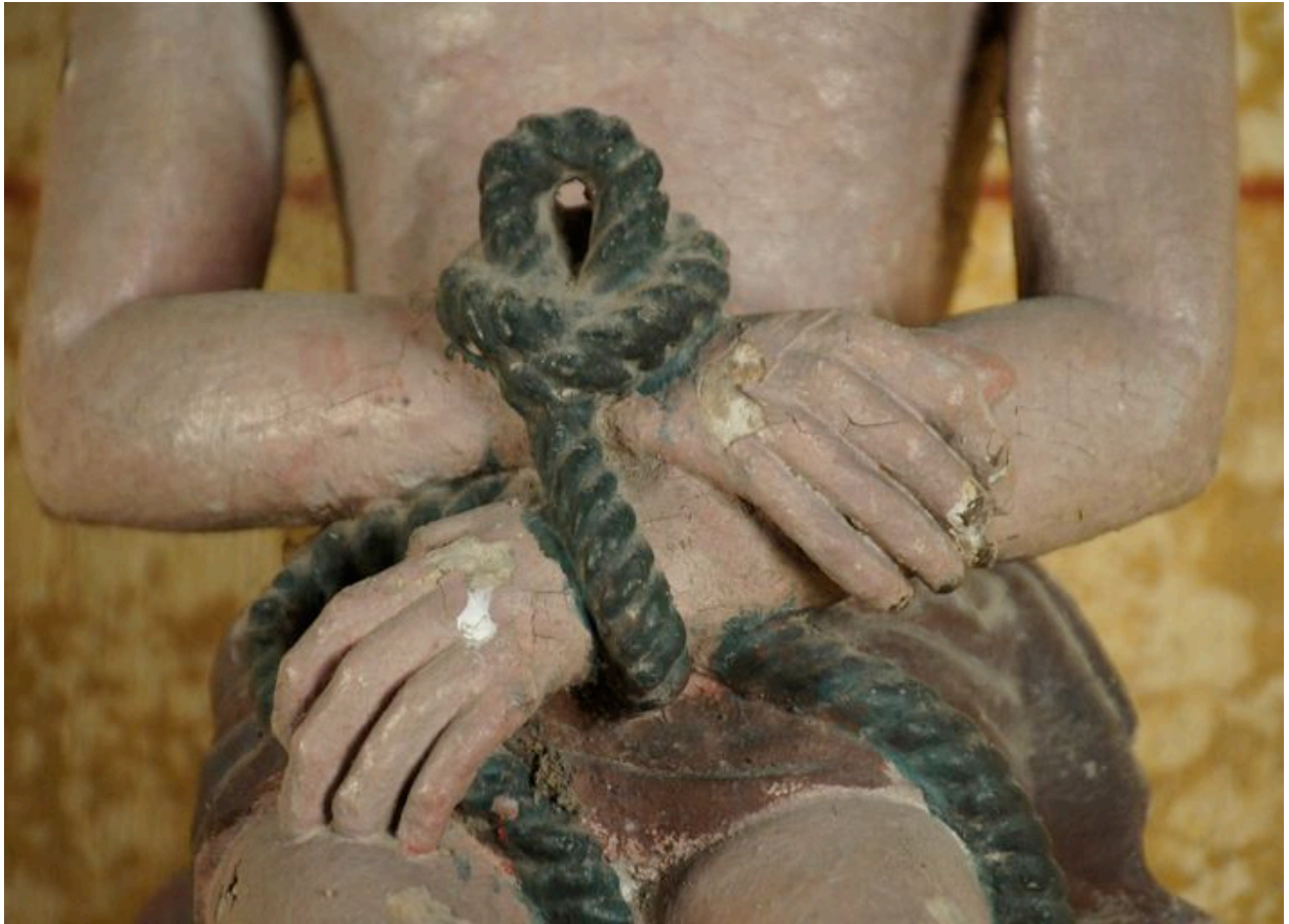
Détail des mains liées.