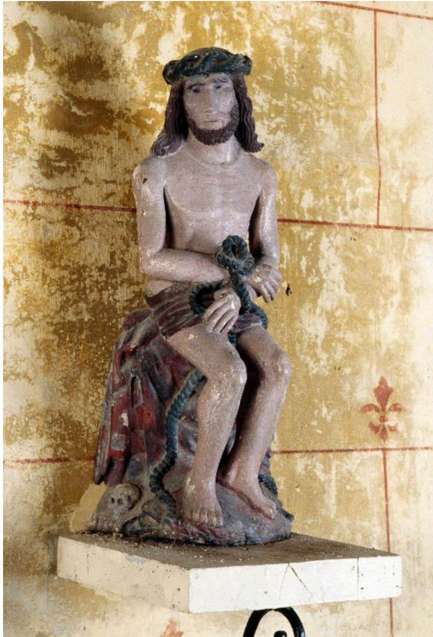
Vue générale de trois-quarts.