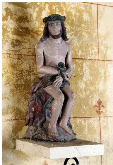
Vue générale de trois-quarts. IVR22_20118000701XA