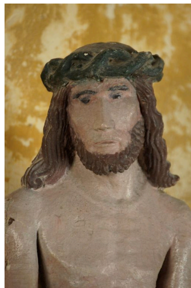
Détail de la tête et du buste.