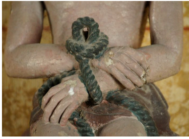
Détail des mains liées.

Phot. Marie-Laure Monnehay-Vulliet IVR22_20118000655NUCA