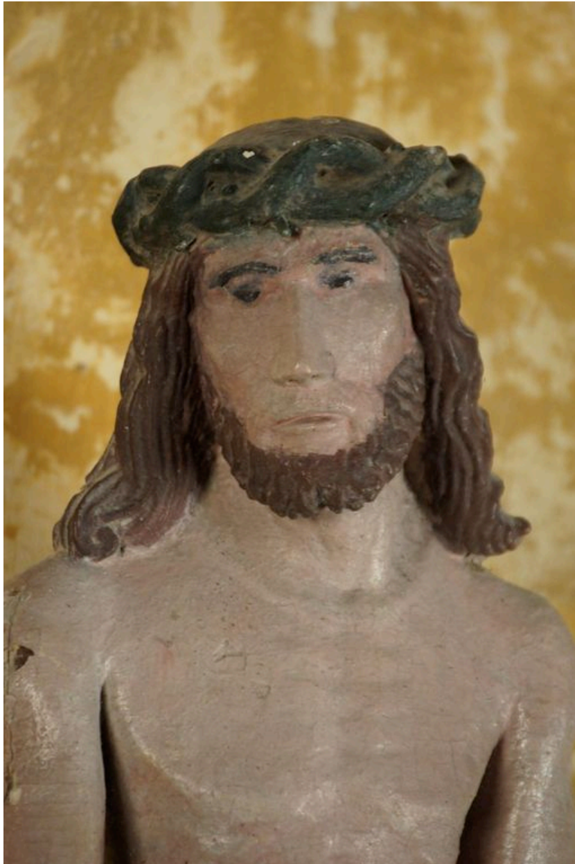
Détail de la tête et du buste.