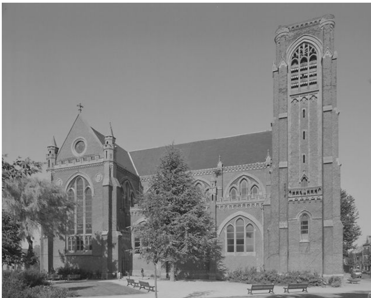
Vue générale depuis le sud.