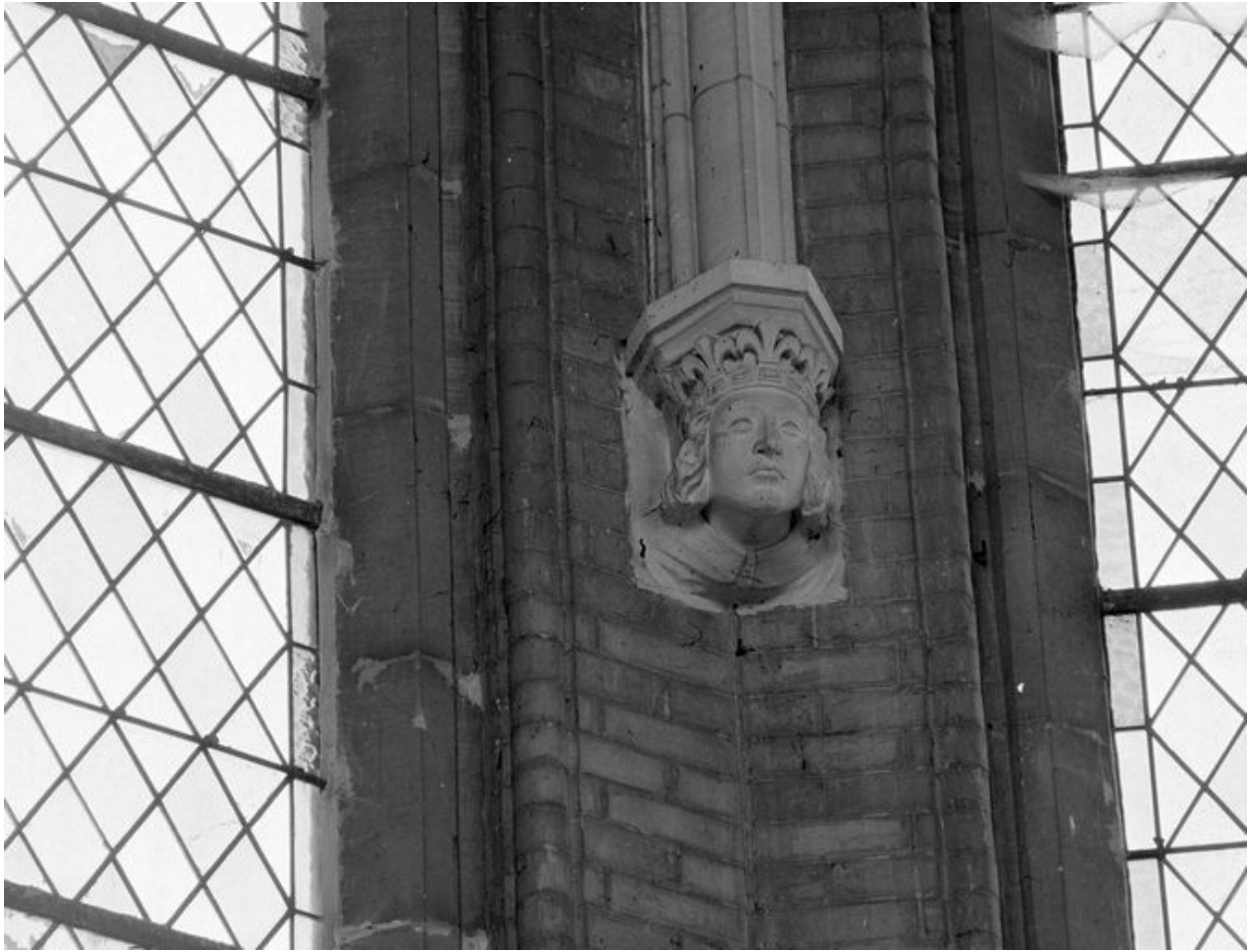
Détail d'un cul de lampe figuré.