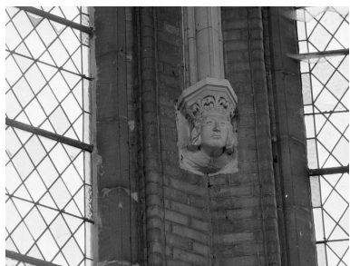
Détail d'un cul de lampe figuré. IVR22_19968000227X