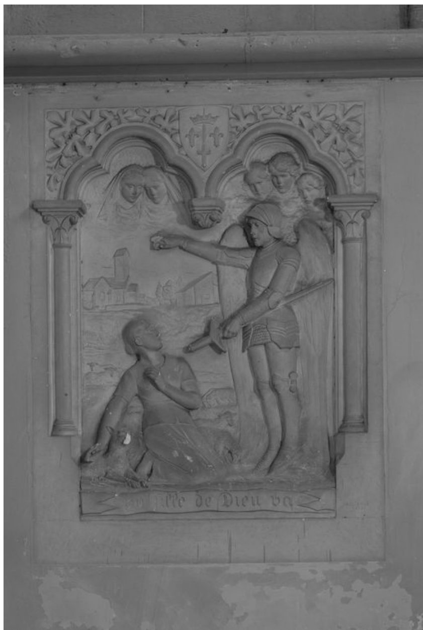
Bas-relief : la révélation de Jeanne la bergère, Albert Roze, 1921.