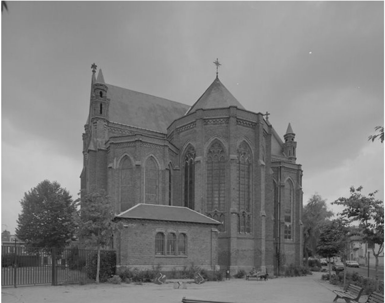
Vue générale depuis le nord-ouest.