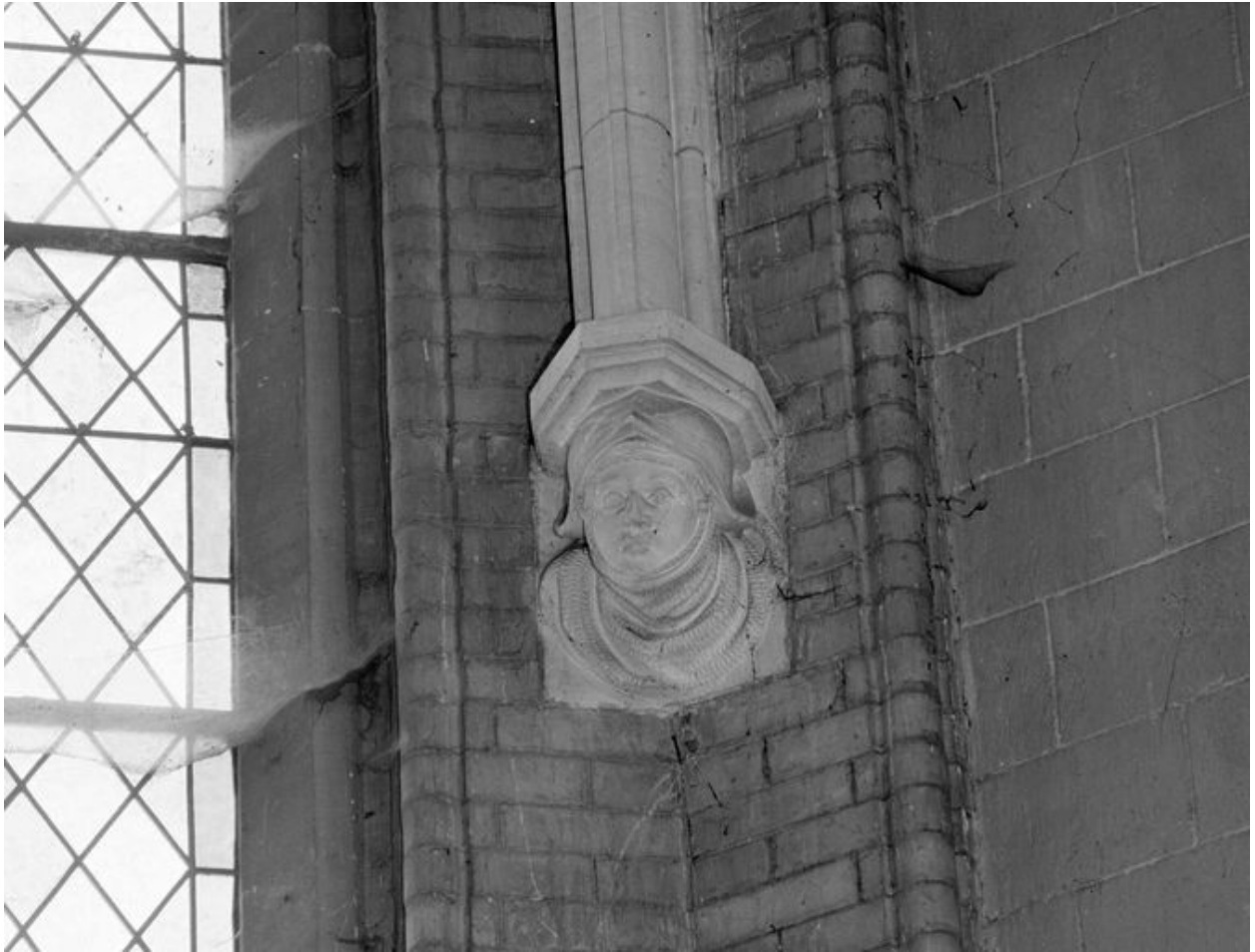
Détail d'un cul de lampe figuré.