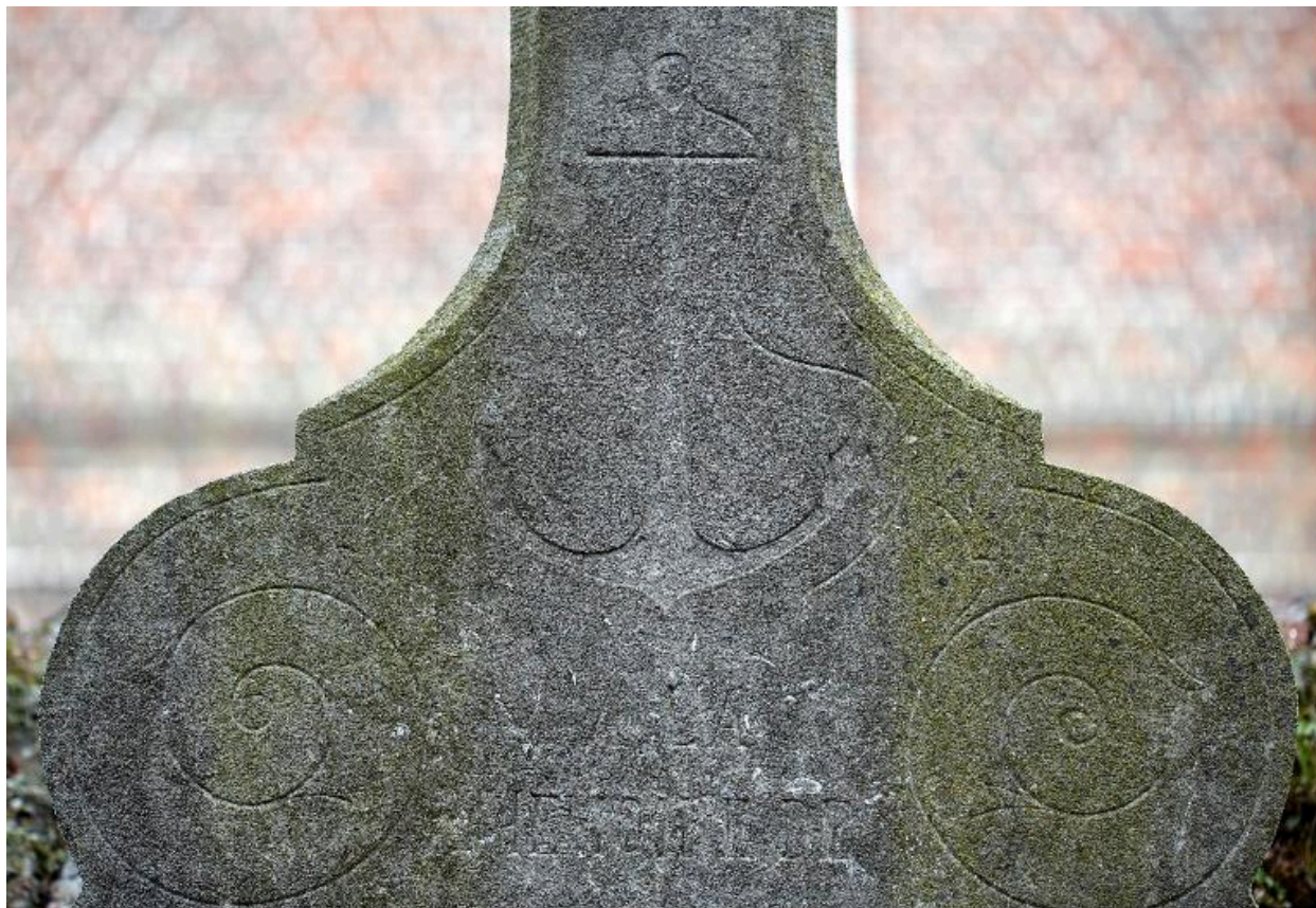
Ancre décorant une tombe de batelier.