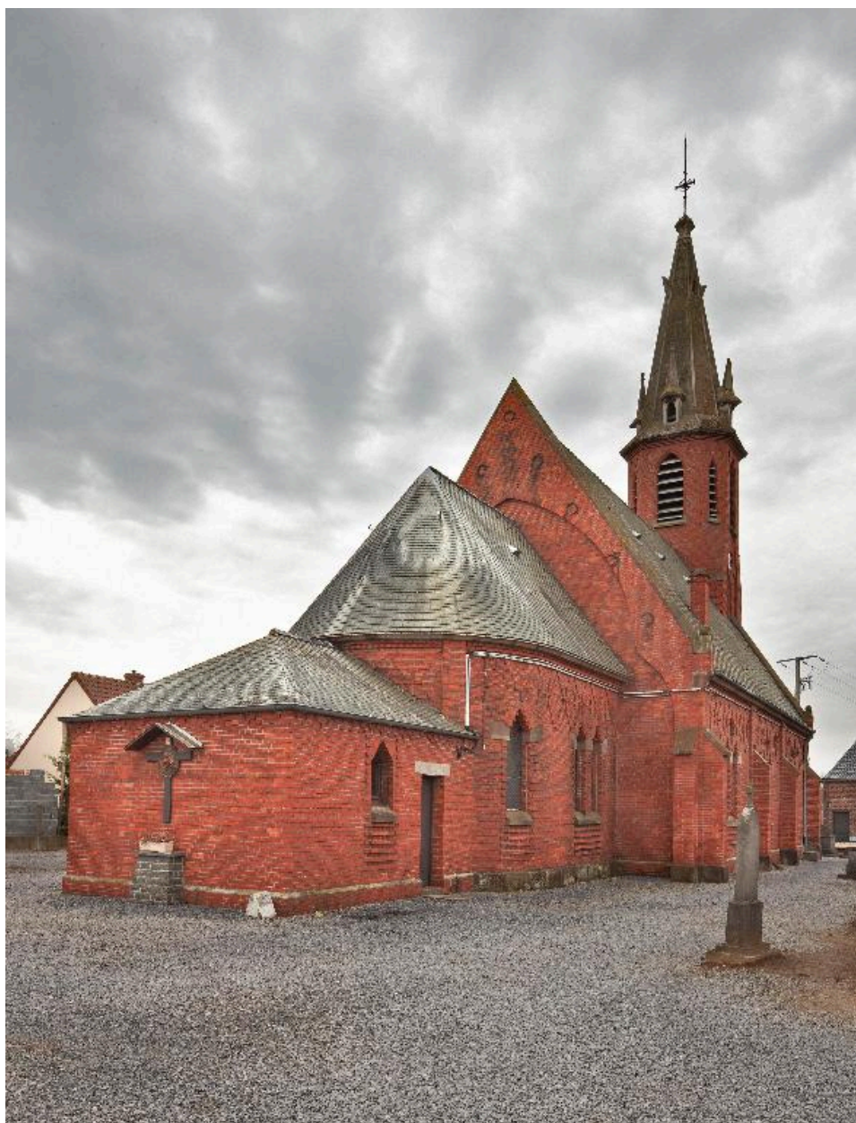
Vue générale depuis le chevet.