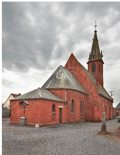
Vue générale depuis le chevet.