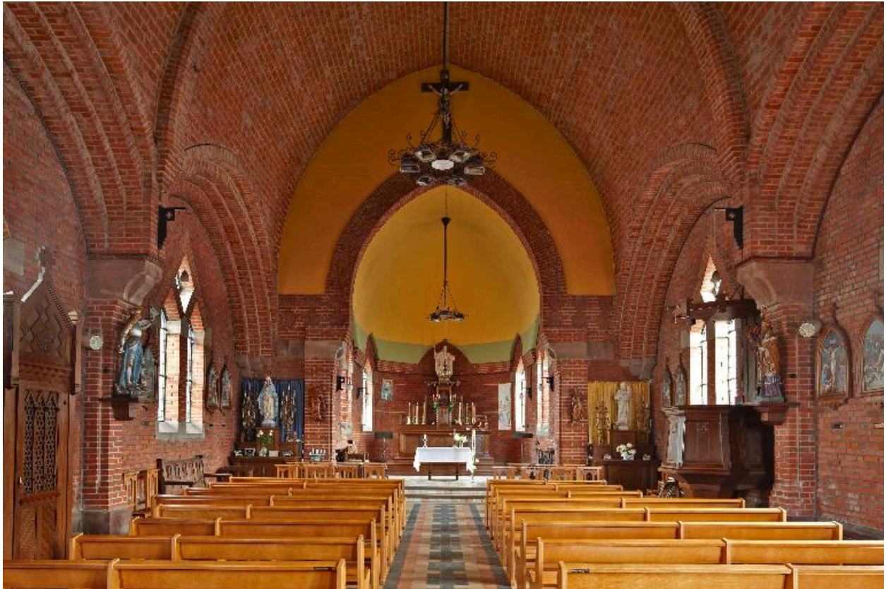
Vue générale vers le chœur.