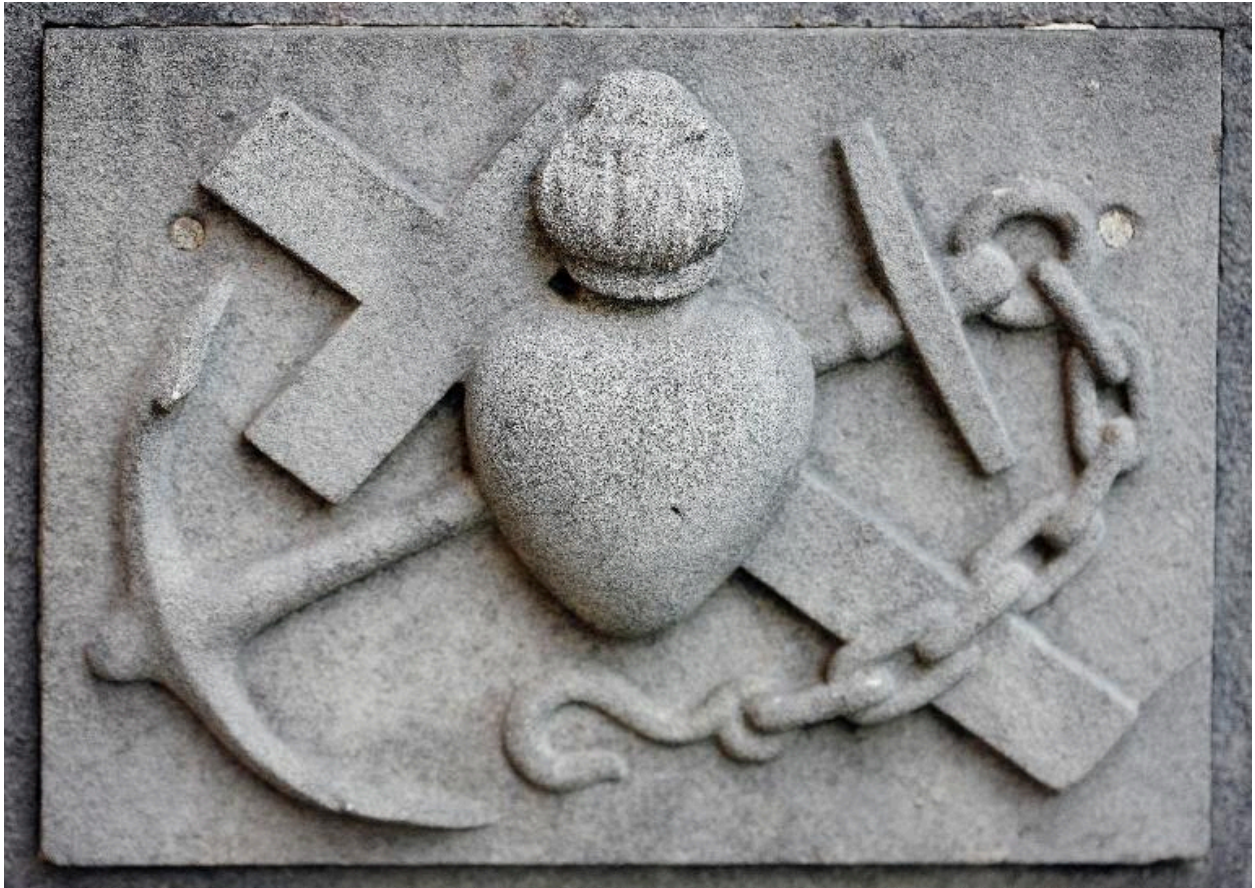
Ancre décorant une tombe de batelier située dans le cimetière entourant l'église.