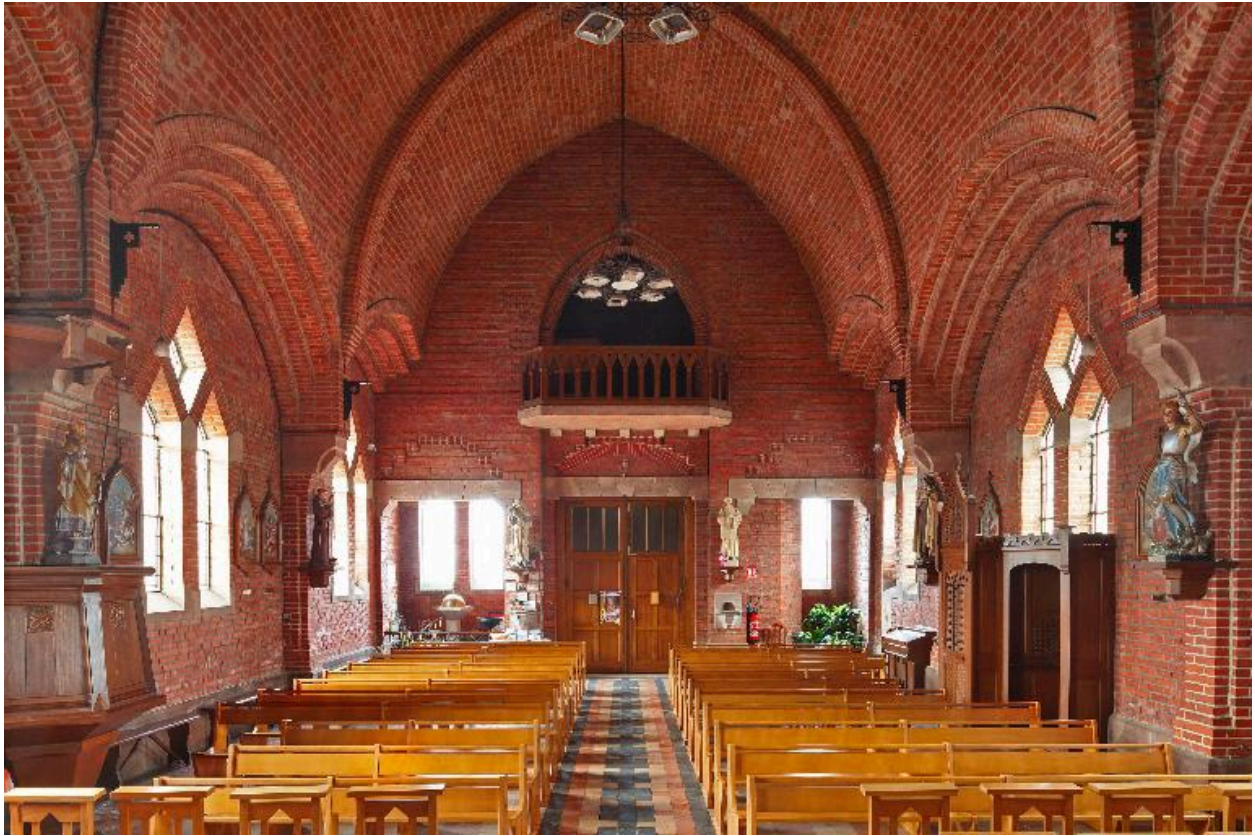
Vue générale vers l'entrée.