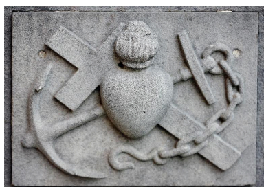
Ancre décorant une tombe de batelier située dans le cimetière entourant l'église. IVR31_20105900092NUCA