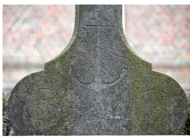
Ancre décorant une tombe de batelier.