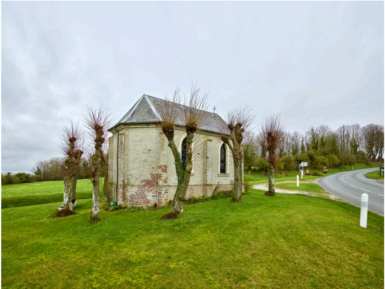
Vue de la chapelle, depuis le sud-ouest.