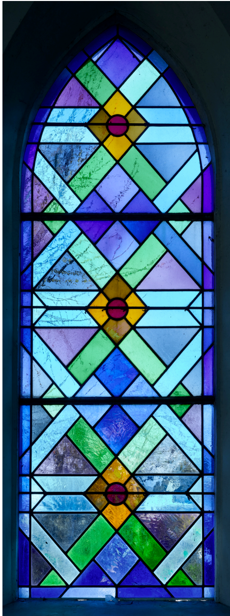
Détail de la verrière de la chapelle.