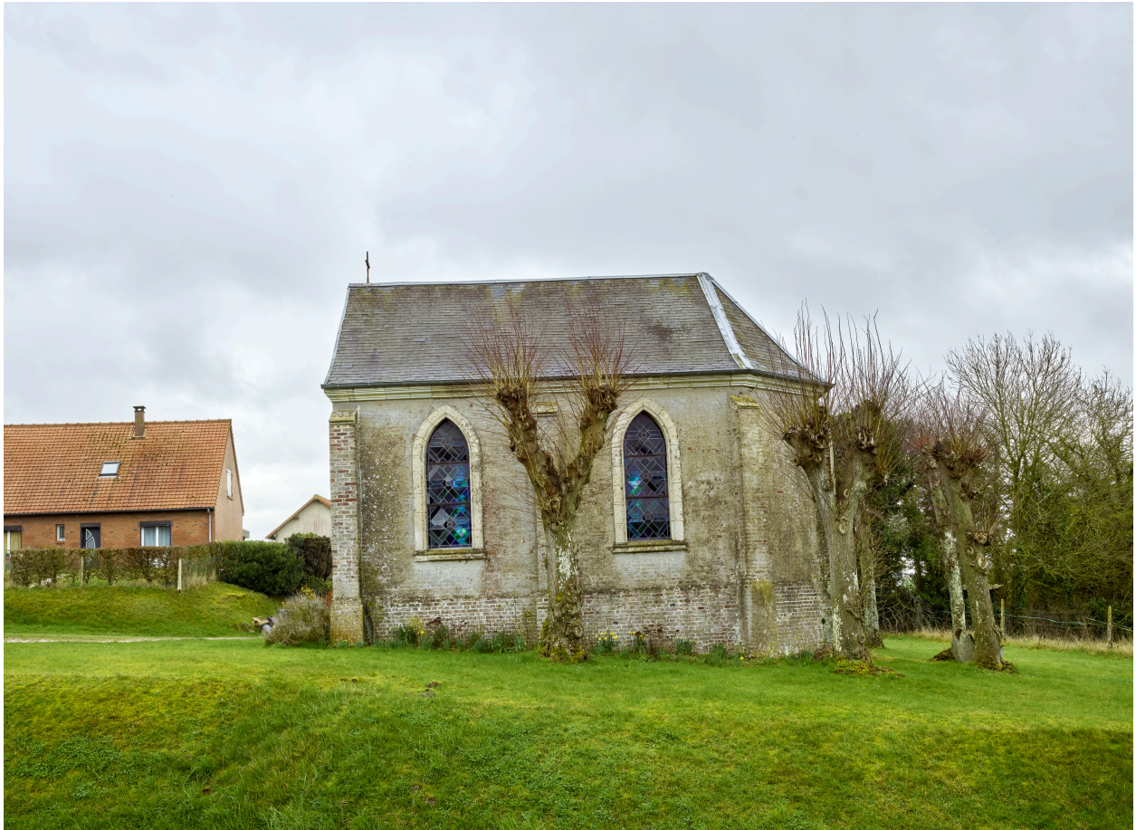
Vue de la chapelle, depuis l'ouest.