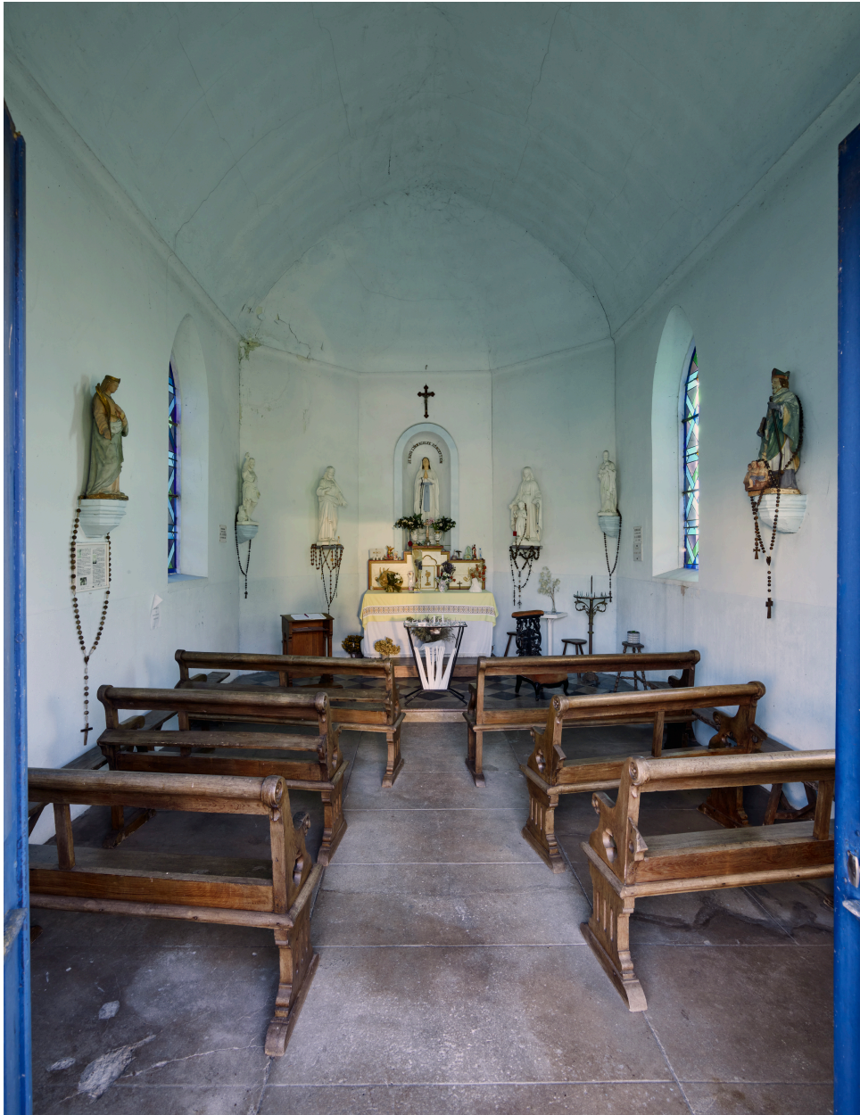
Intérieur de la chapelle.