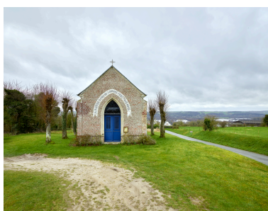
Vue de la chapelle, depuis le nord.