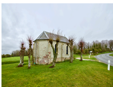
Vue de la chapelle, depuis le sud-ouest. IVR32_20248000305NUCA