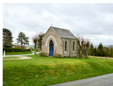
Vue de la chapelle, depuis le nord-ouest.