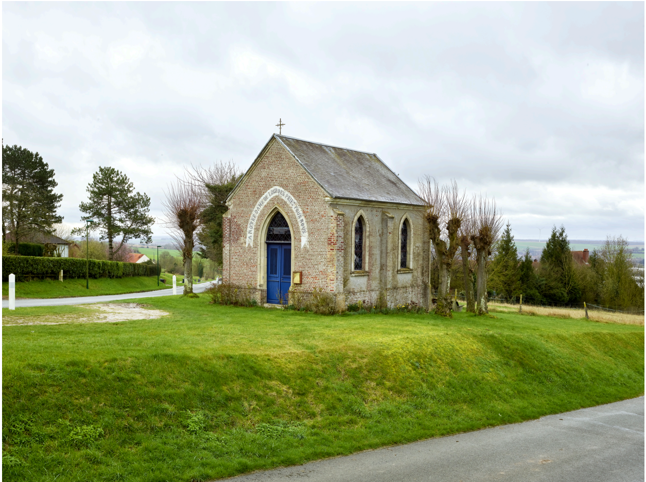
Vue de la chapelle, depuis le nord-ouest.