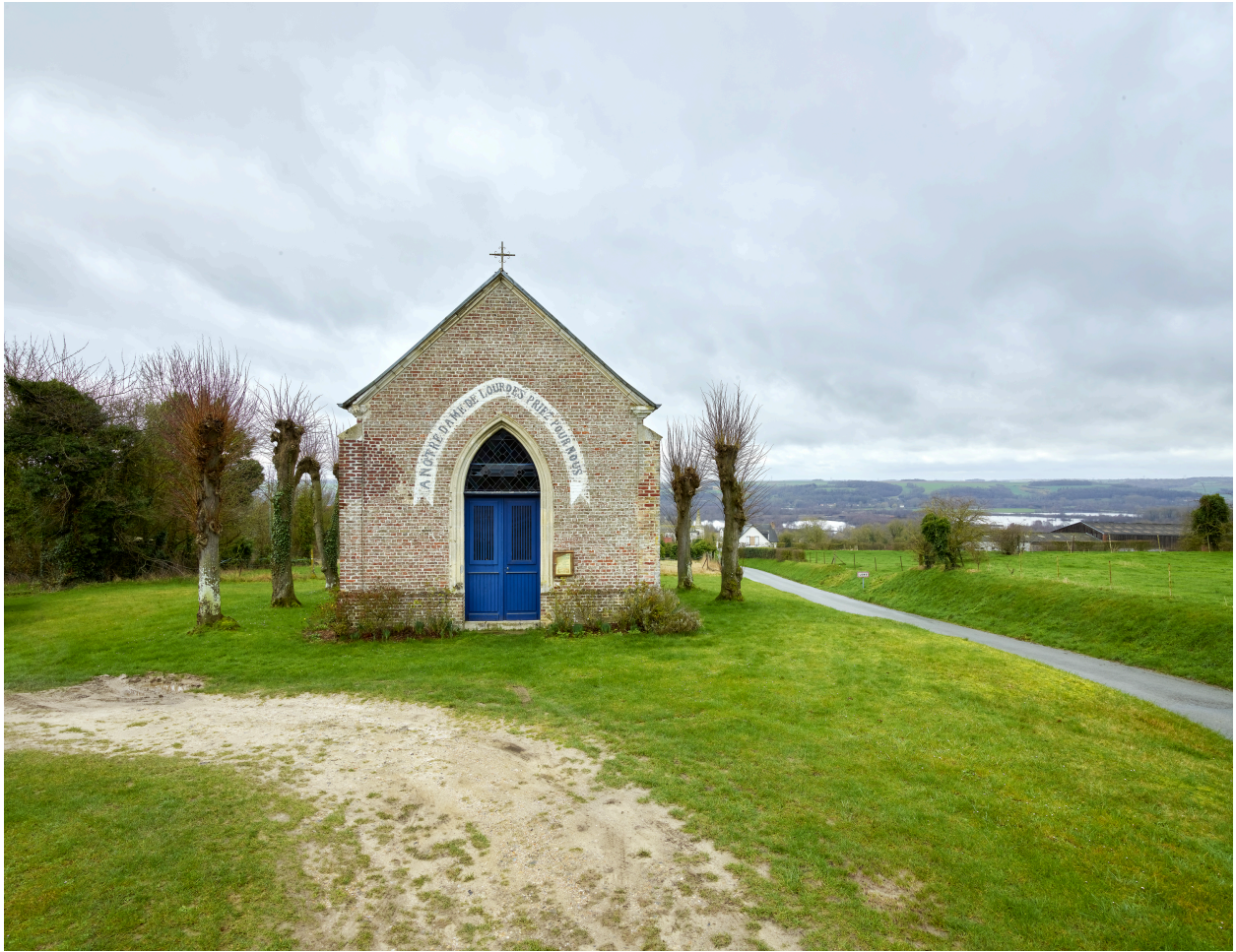
Vue de la chapelle, depuis le nord.