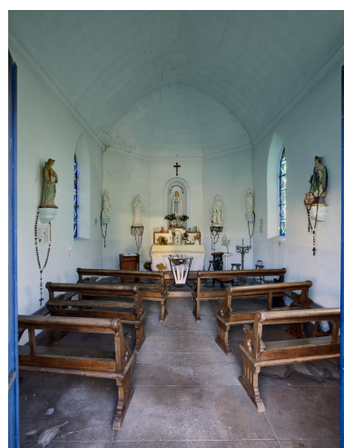
Intérieur de la chapelle.