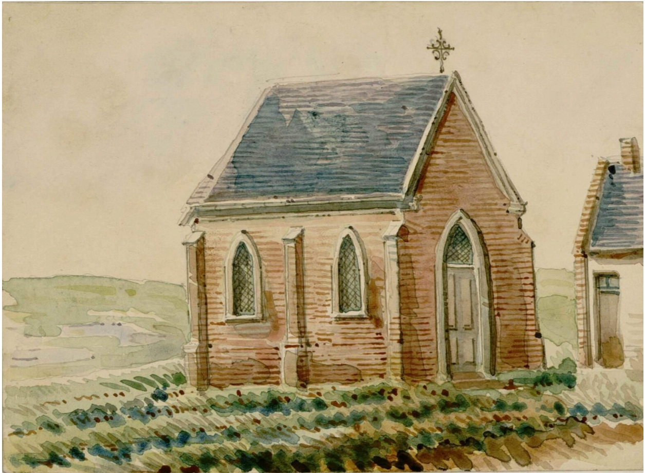
Chapelle de Long, par Oswald Macqueron, d'après nature, 14 mai 1883 (Archives et Bibliothèque patrimoniale d'Abbeville ; Ail. 54).