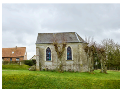
Vue de la chapelle, depuis l'ouest.