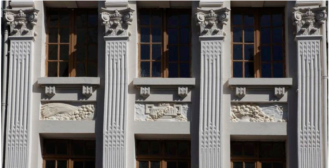
Ensemble des décors sculptés sur les pilastres et les allèges des baies.