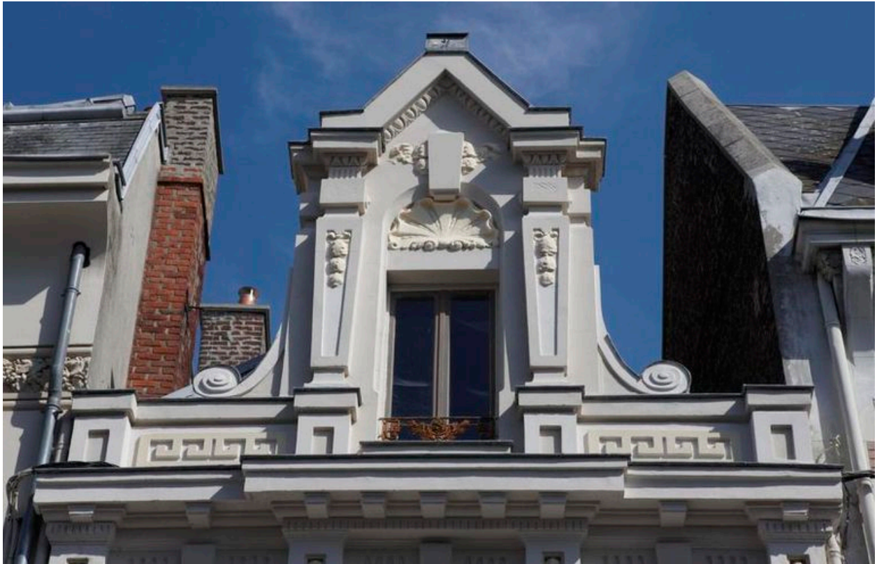
Vue sur la lucarne-fronton triangulaire ornée de motifs Art déco.