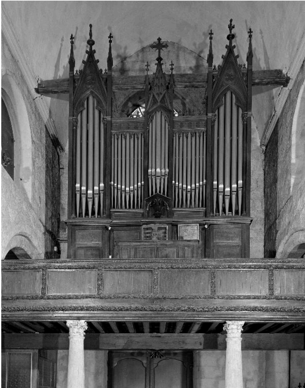
Vue générale de l'orgue.