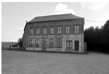
Elévation antérieure. IVR22_19980202684Z