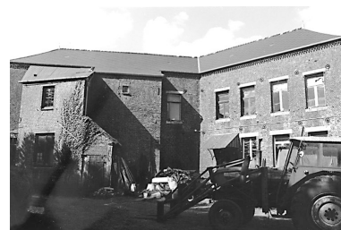
Elévation postérieure. IVR22_19980202685Z