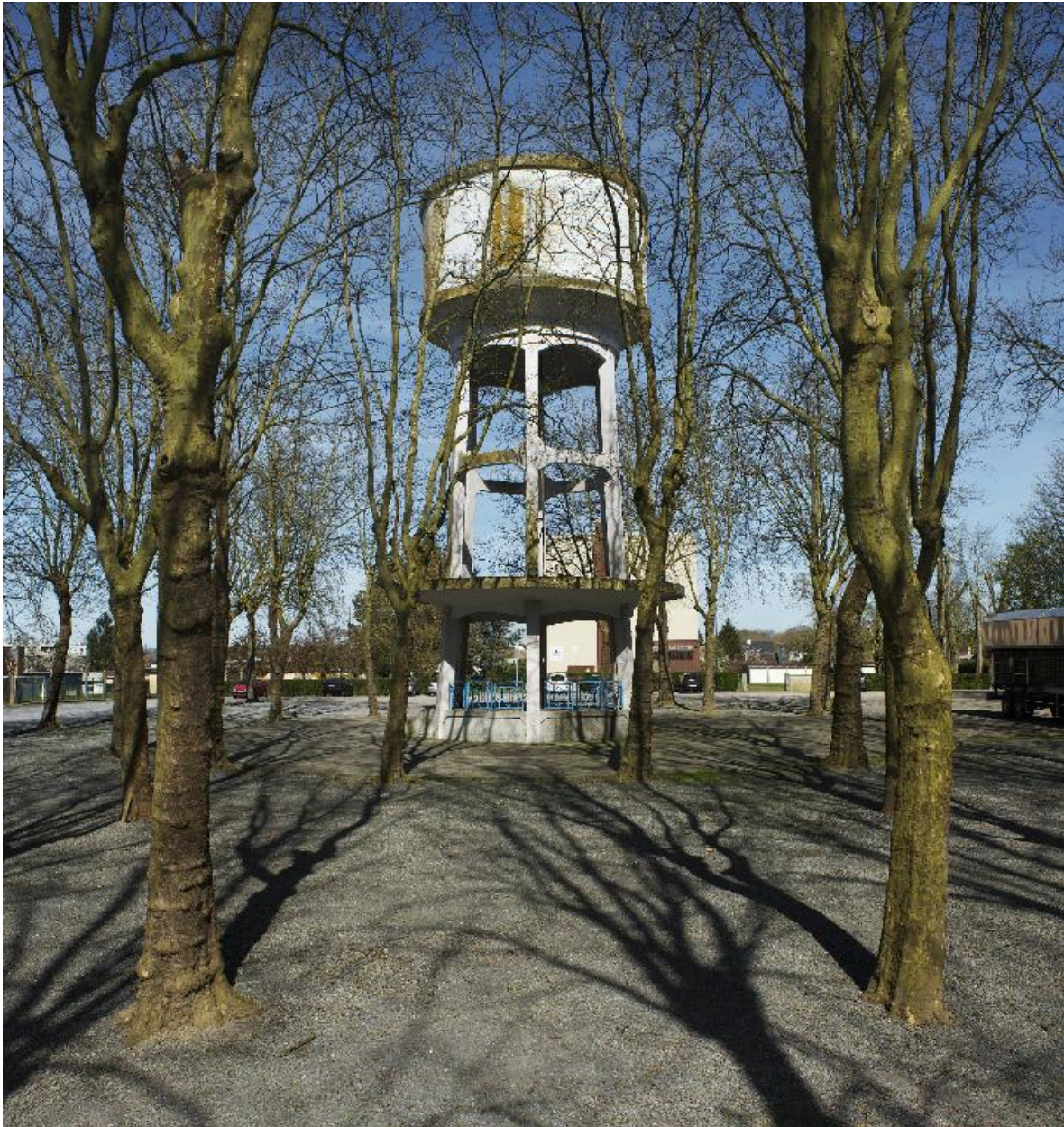
Vue générale du château d'eau au milieu de la place plantée d'arbres.