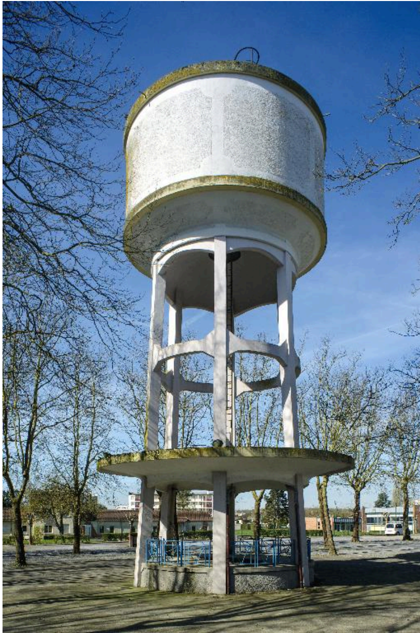
Vue générale du kiosque château-d'eau.