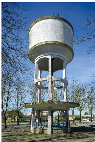
Vue générale du kiosque château-d'eau.