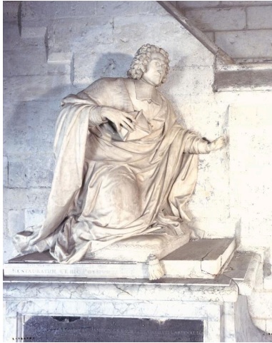
Vue d'ensemble. IVR22_19966003951VA