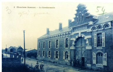
La gendarmerie après sa reconstruction. Carte postale, 1er quart 20e siècle (AD Somme ; 10R ; 311). IVR32_20168006540NUCA