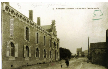
La gendarmerie après sa reconstruction. Carte postale, 1er quart 20e siècle.