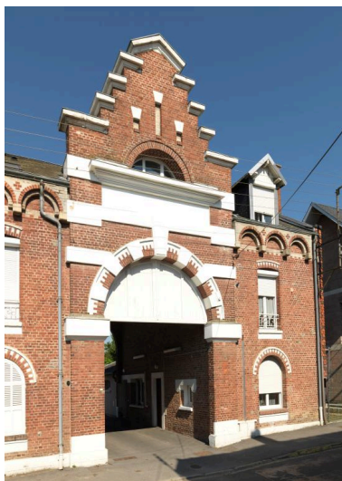
L'entrée de l'ancienne gendarmerie. IVR32_20188000342NUC2A