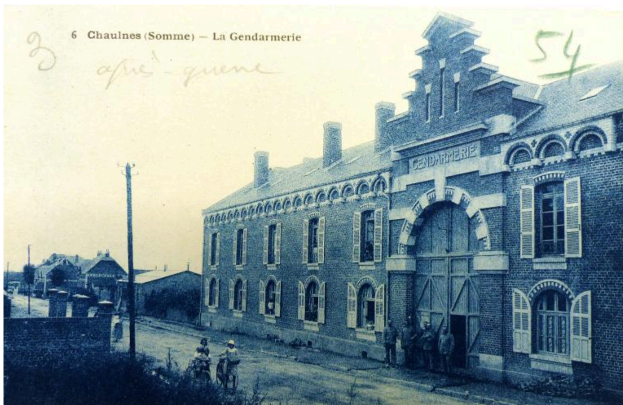
La gendarmerie après sa reconstruction. Carte postale, 1er quart 20e siècle (AD Somme ; 10R ; 311).