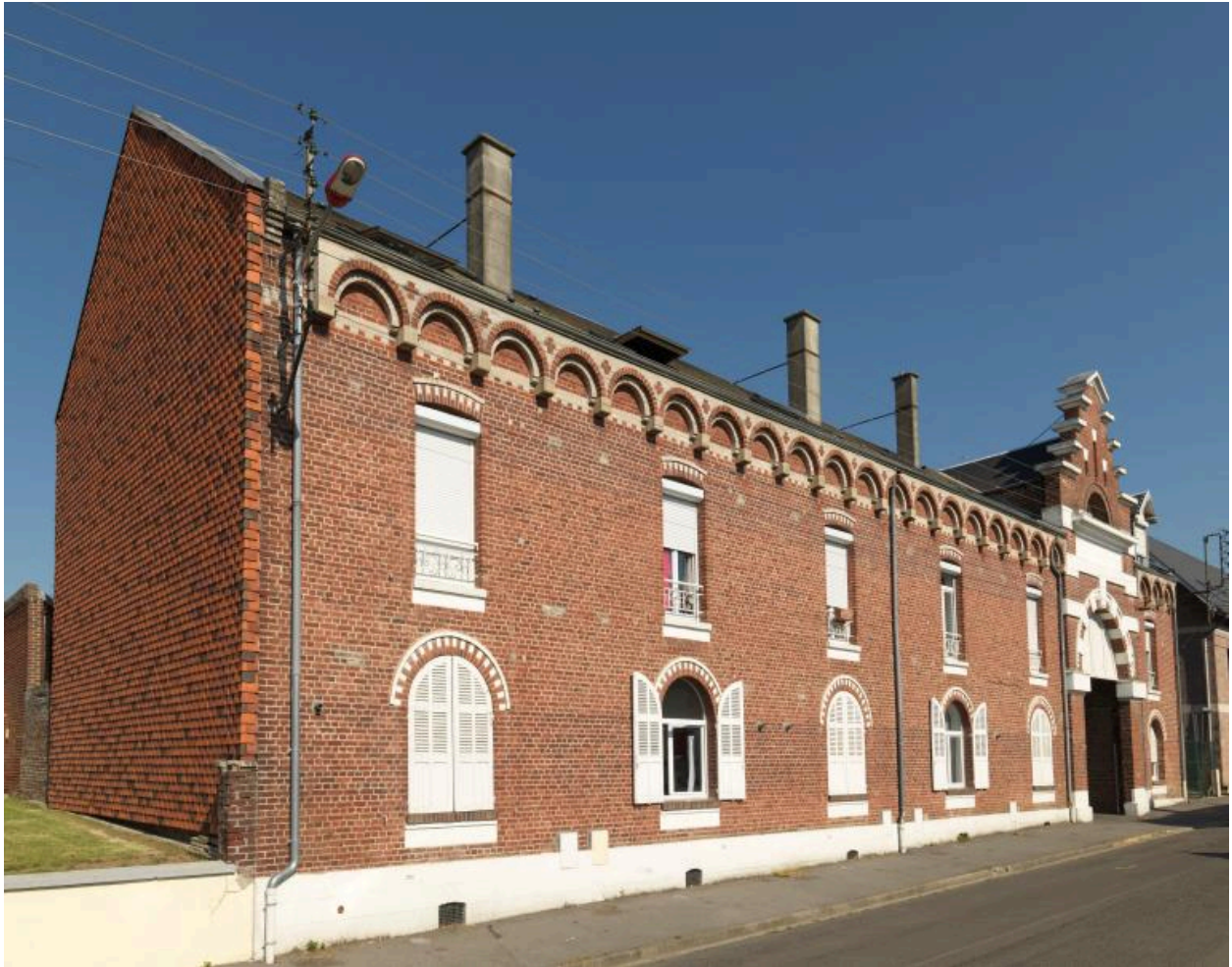
Vue générale, depuis la rue.