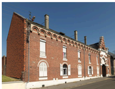
Vue générale, depuis la rue. IVR32_20188000341NUC2A