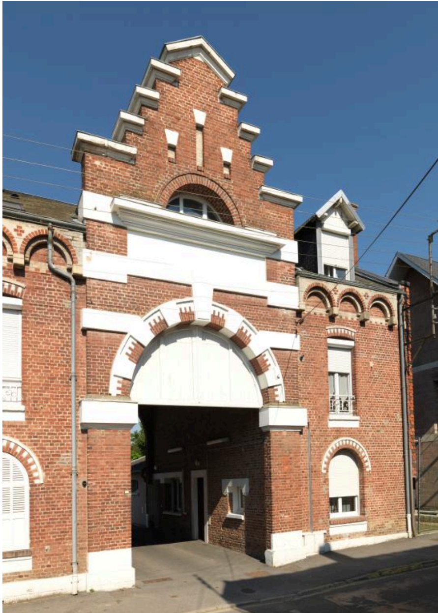
L'entrée de l'ancienne gendarmerie.