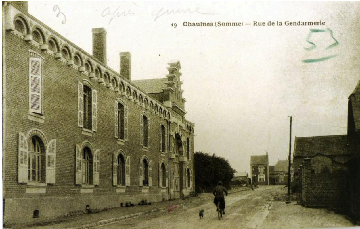
La gendarmerie après sa reconstruction. Carte postale, 1er quart 20e siècle (AD Somme ; 10R ; 311).