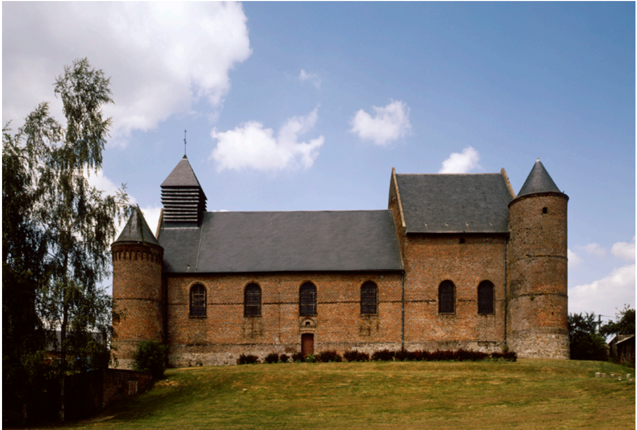
Vue de l'élévation sud.