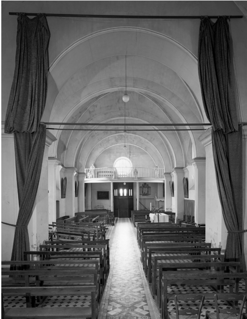
Vue intérieure, depuis le chœur.