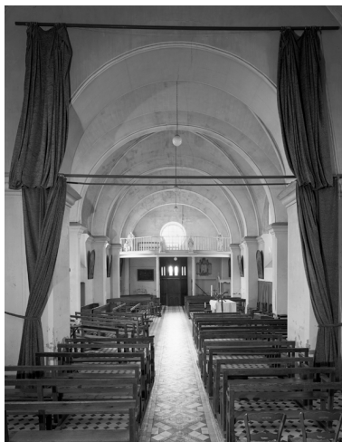
Vue intérieure, depuis le chœur.