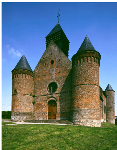
Vue générale sud-ouest. IVR22_19930200596VA