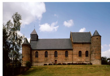
Vue de l'élévation sud.