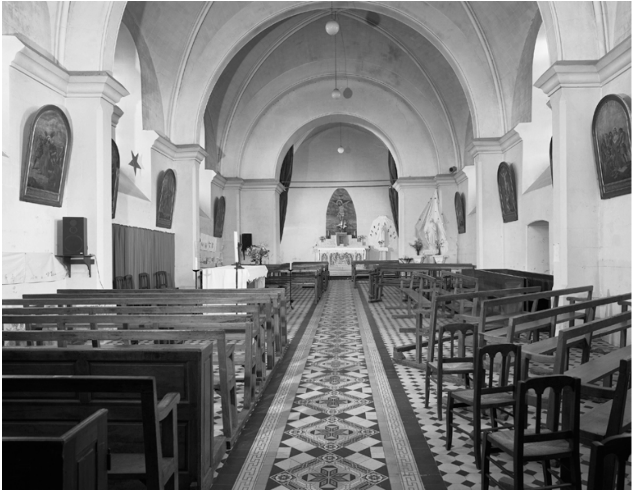
Vue intérieure, vers le choeur.