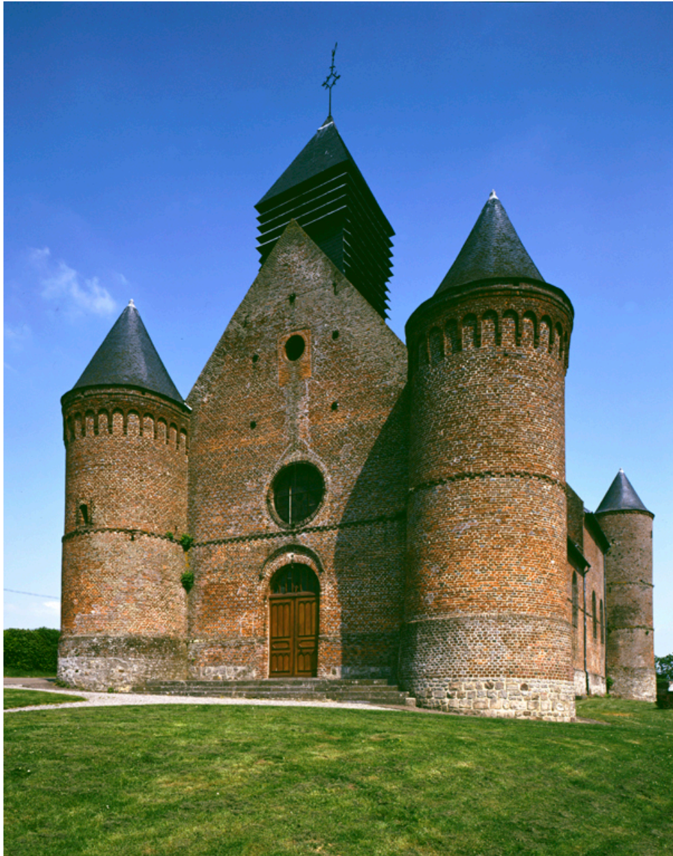
Vue générale sud-ouest.