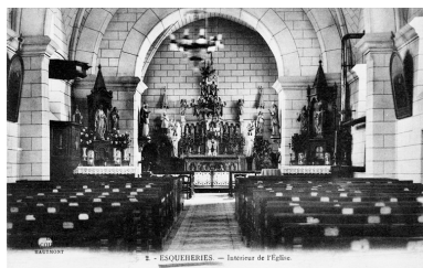
Vue intérieure vers le chœur, début 20e siècle. IVR22_19920200077XB