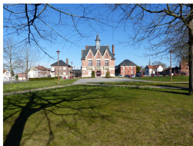
Vue de situation, depuis la place au sud. IVR32_20220205009NUCA