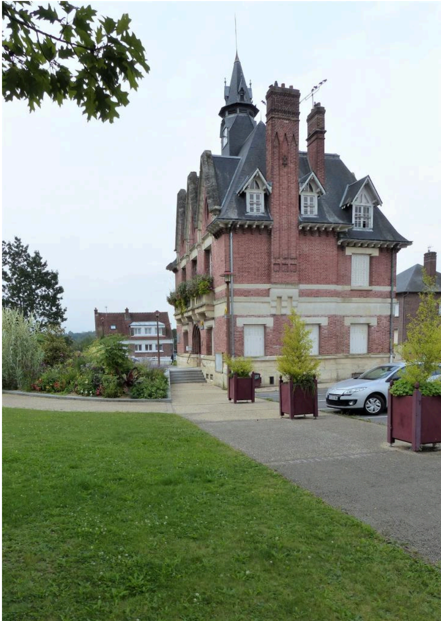
Vue générale depuis l'est.