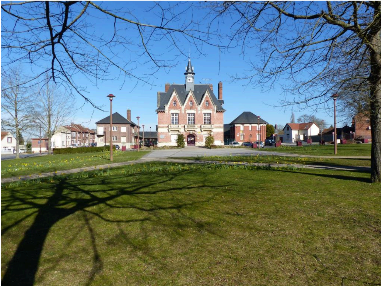
Vue de situation, depuis la place au sud.