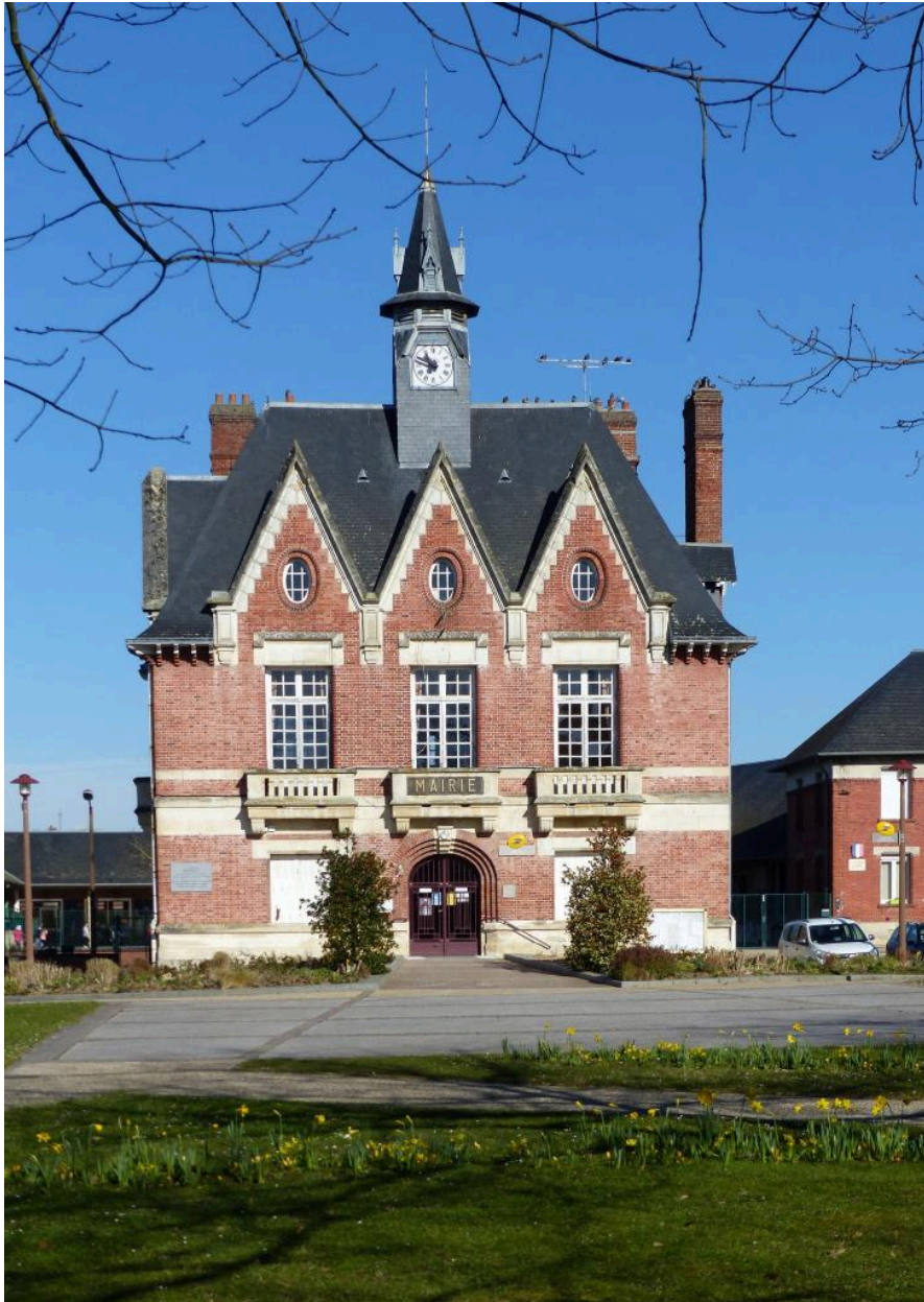
Vue depuis le sud.