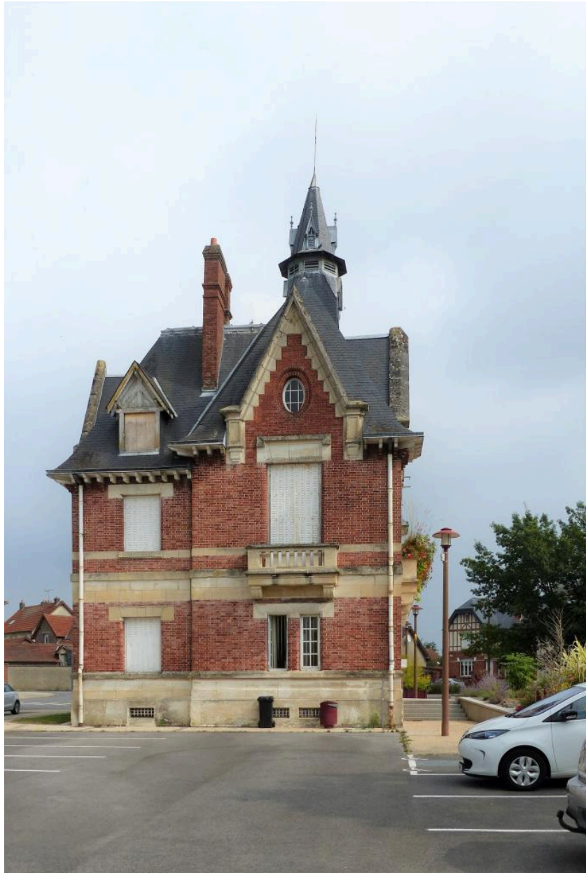
Vue depuis l'ouest.