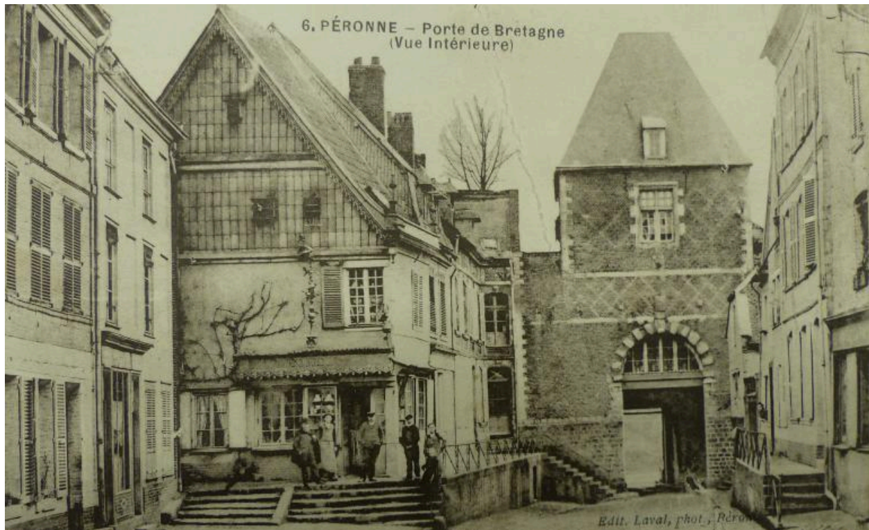
Péronne. Porte de Bretagne. Vue intérieure, carte postale, début 20e siècle (AD Somme ; 10R).