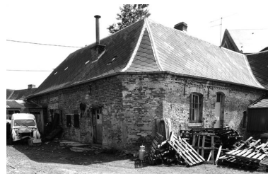
Vue partielle de l'élévation sur cour du logis. IVR22_19920201169Z