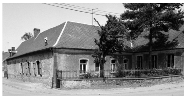
Vue d'ensemble du logis, depuis le sud. IVR22_19920201166Z