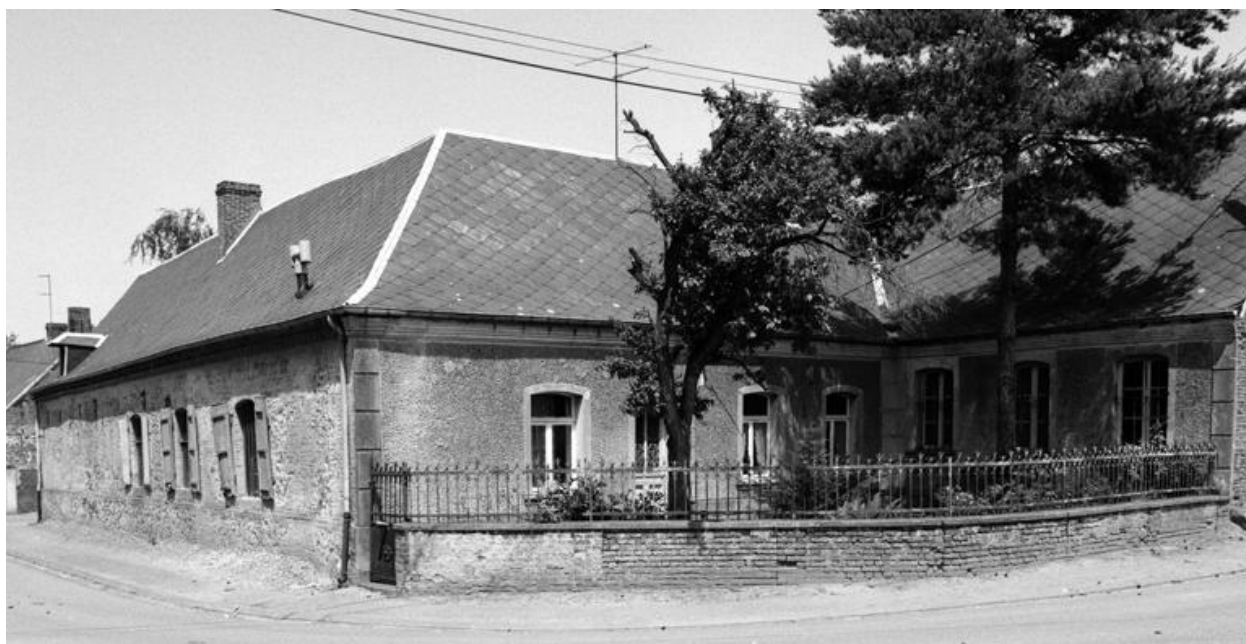
Vue d'ensemble du logis, depuis le sud.