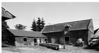
Vue d'ensemble des étables, depuis l'ouest. IVR22_19920201168Z