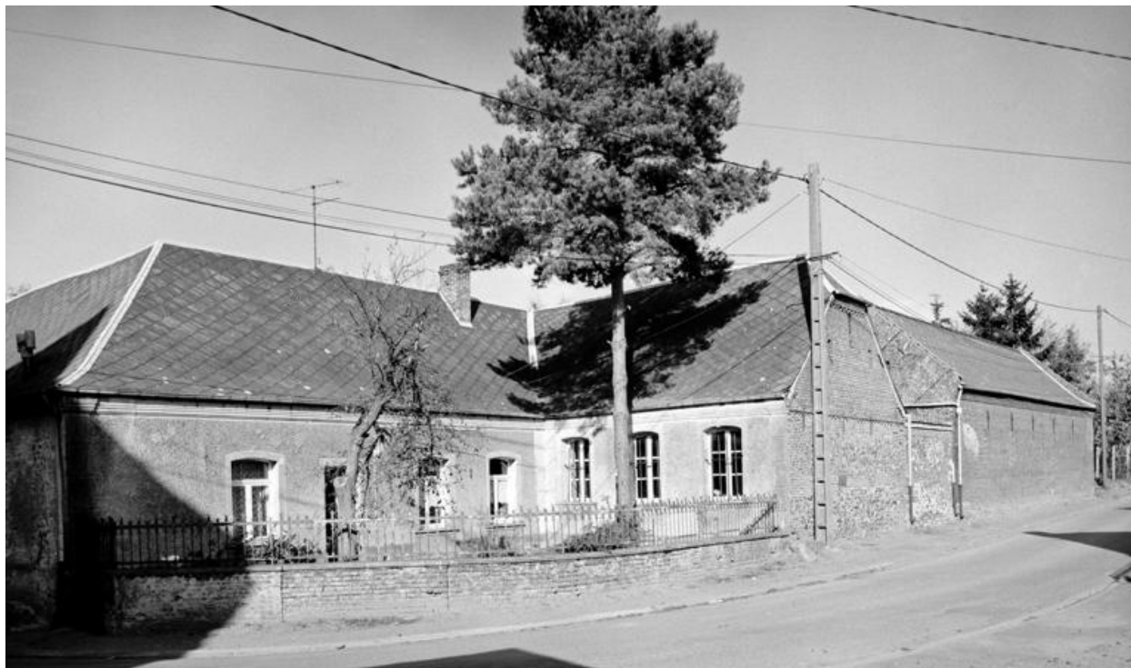
Vue partielle du logis, et de l'élévation sur rue de l'étable.