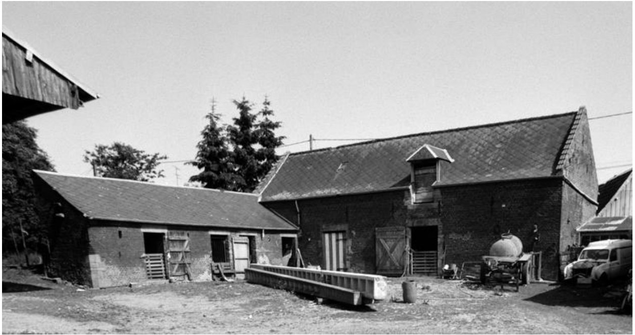
Vue d'ensemble des étables, depuis l'ouest.