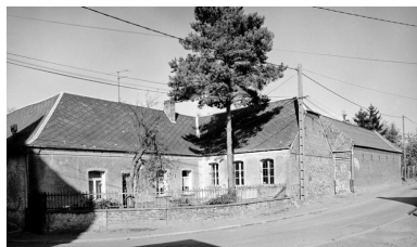
Vue partielle du logis, et de l'élévation sur rue de l'étable. IVR22_19940201723Z