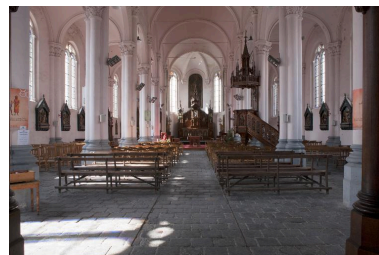
Vue générale vers choeur.