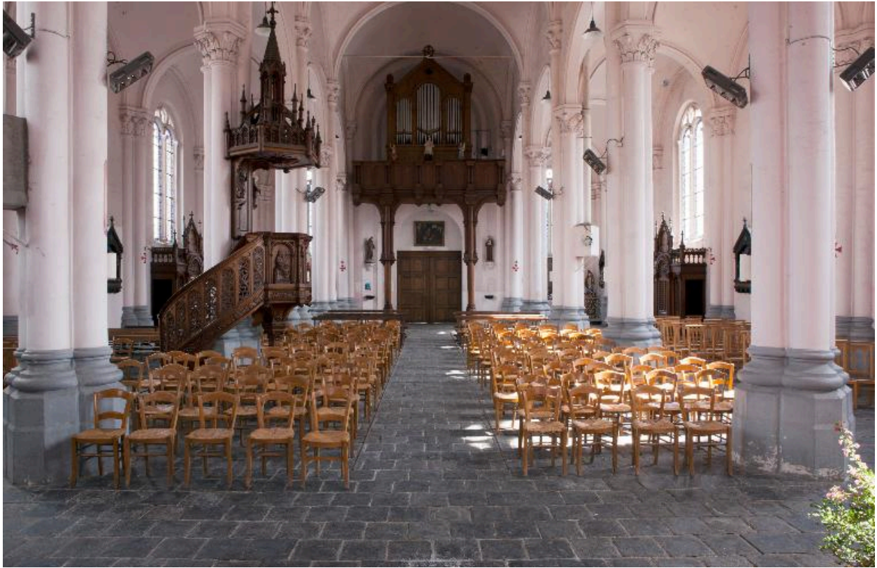
Vue générale intérieure vers l'entrée.