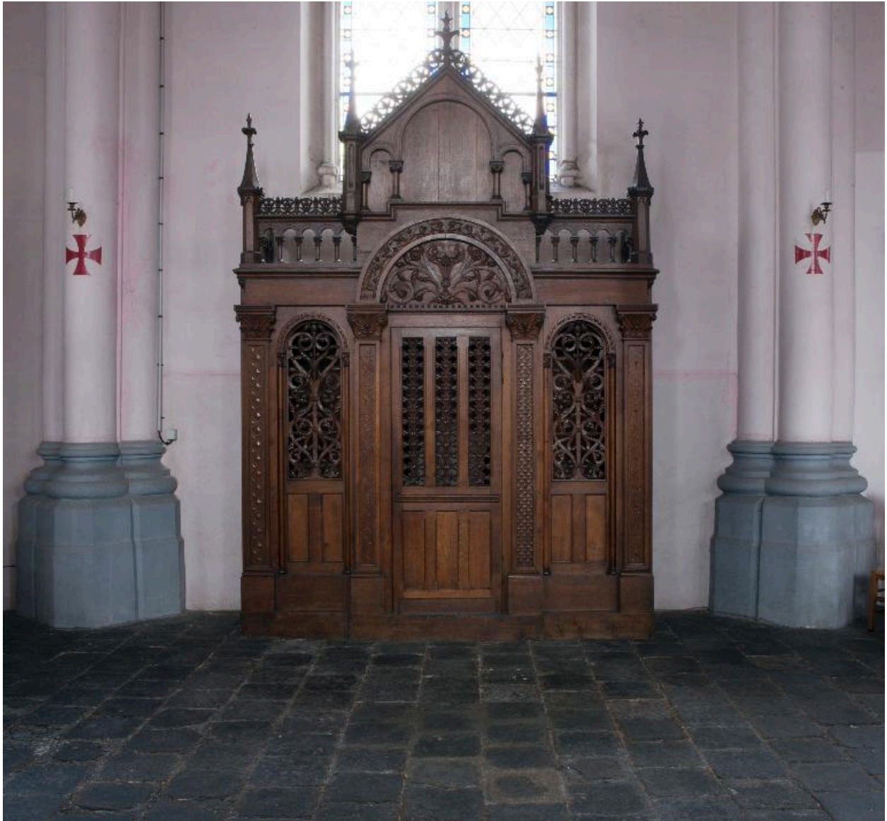
Vue générale d'un confessional.