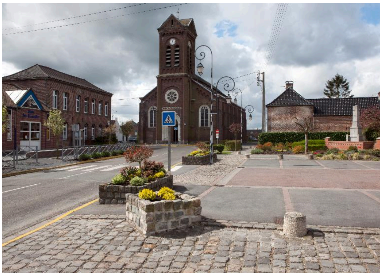
Vue générale de l'église et la place.