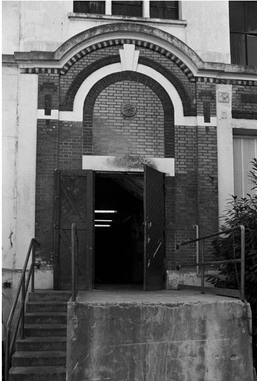
Atelier de fabrication sud. Détail.