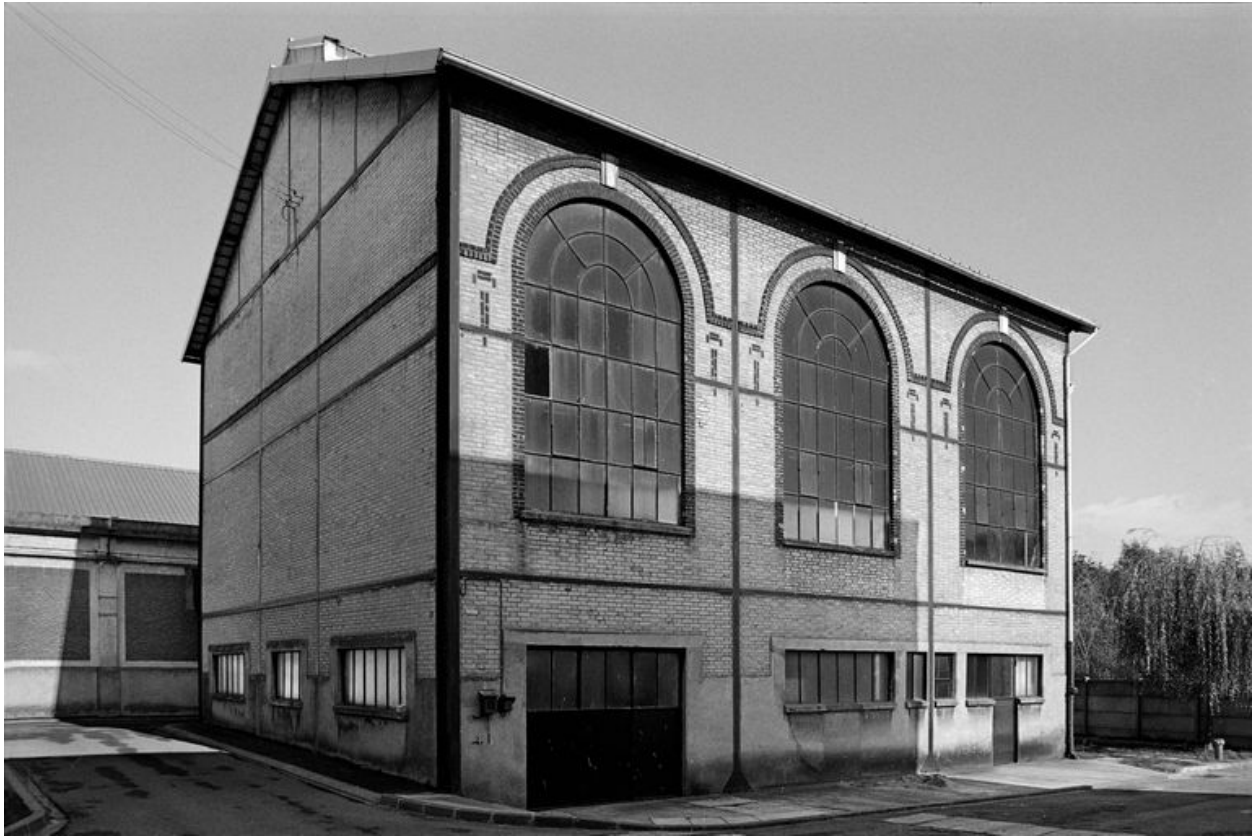
Chaufferie, flanc sud.