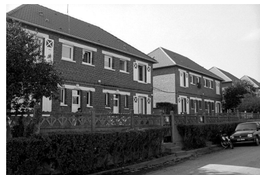
Logements d'ouvriers. IVR22_19908001111Z