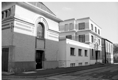
Bureau, chaufferie. IVR22_19908001110Z