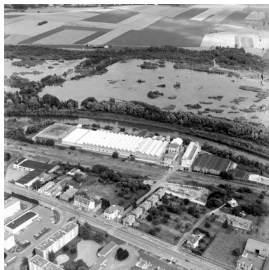
Vue aérienne, flanc sud.