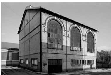
Chaufferie, flanc sud. IVR22_19908001105Z