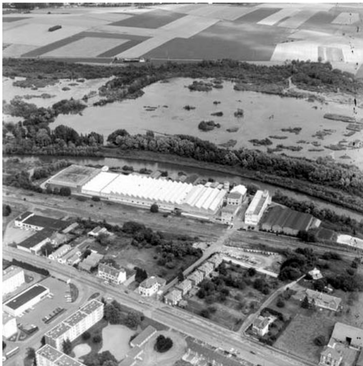
Vue aérienne, flanc sud.