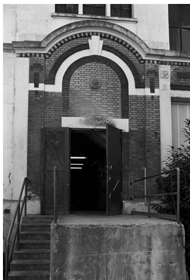
Atelier de fabrication sud. Détail. IVR22_19908001108Z