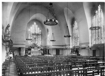
Fargniers. Église paroissiale. Vue intérieure vers le chœur. Photographie, vers 1930.