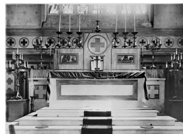
Fargniers. Église paroissiale. Le maître-autel. Photographie, vers 1930. IVR22_19910202046XB