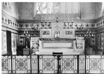
Fargniers. Église paroissiale. Vue du sanctuaire. La clôture de chœur et le maître-autel. Photographie, vers 1930. IVR22_19910202045XB