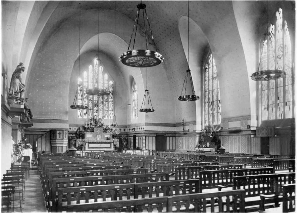
Fargniers. Église paroissiale. Vue intérieure vers le chœur. Photographie, vers 1930.