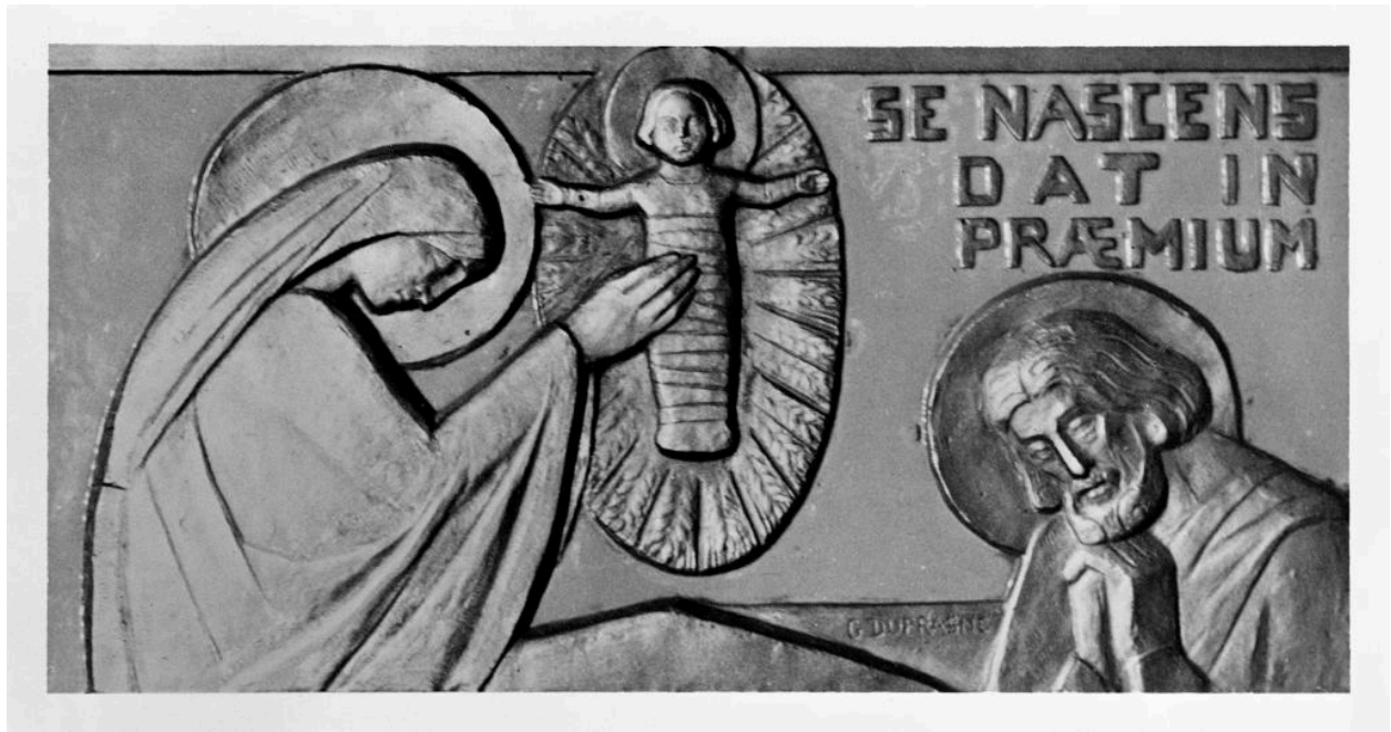
Fargniers. Église paroissiale. Bas-relief du maître-autel. La Nativité. G. Dufrasne, sculpteur. Photographie, vers 1930.