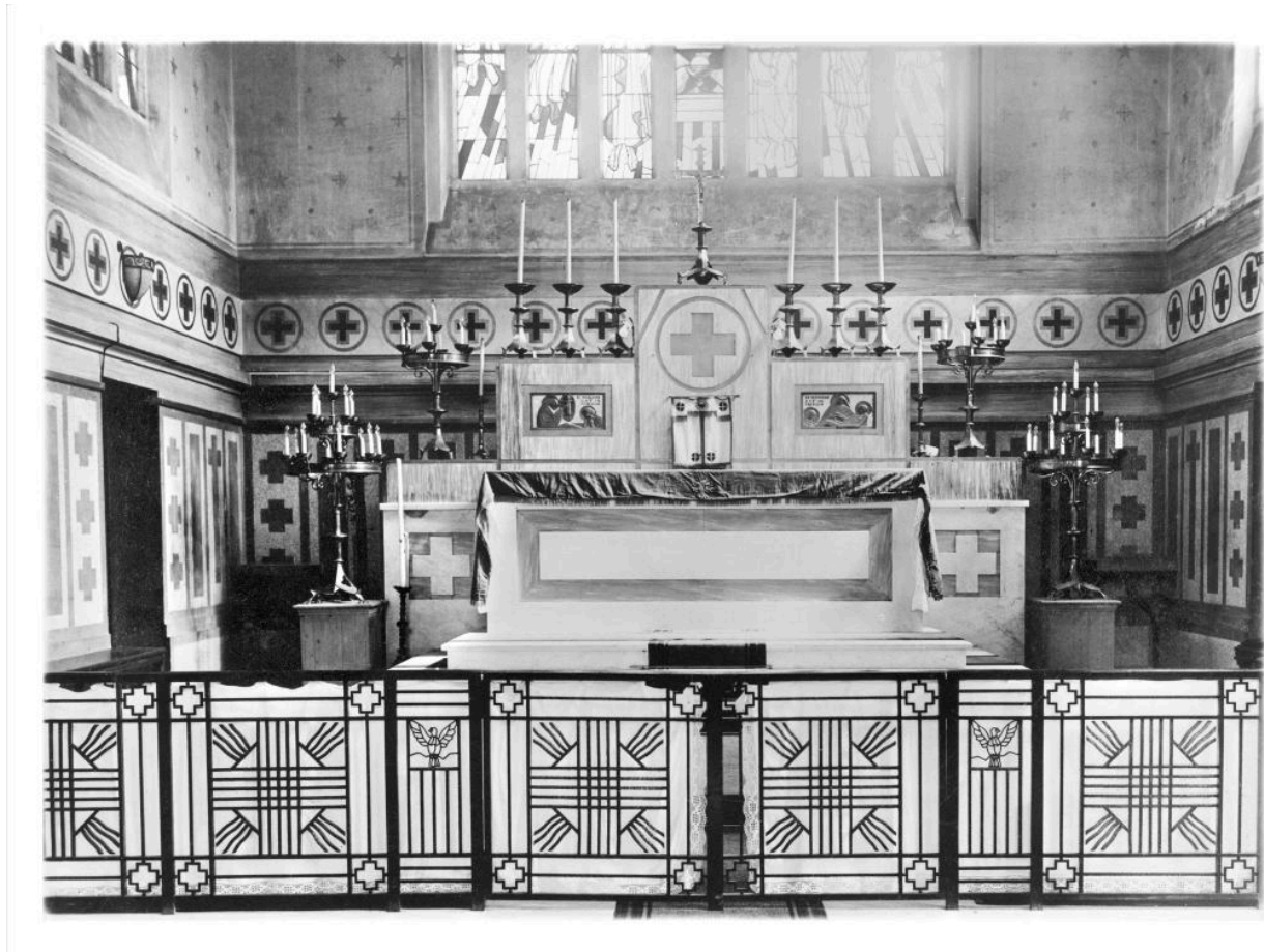
Fargniers. Église paroissiale. Vue du sanctuaire. La clôture de chœur et le maître-autel. Photographie, vers 1930.