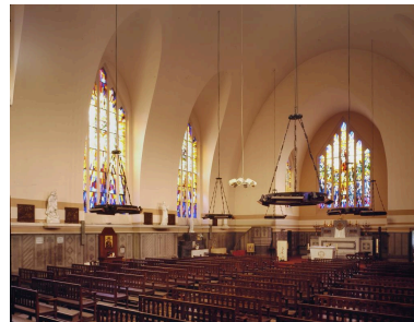
Vue intérieure vers le chœur. IVR22_20060200719VA