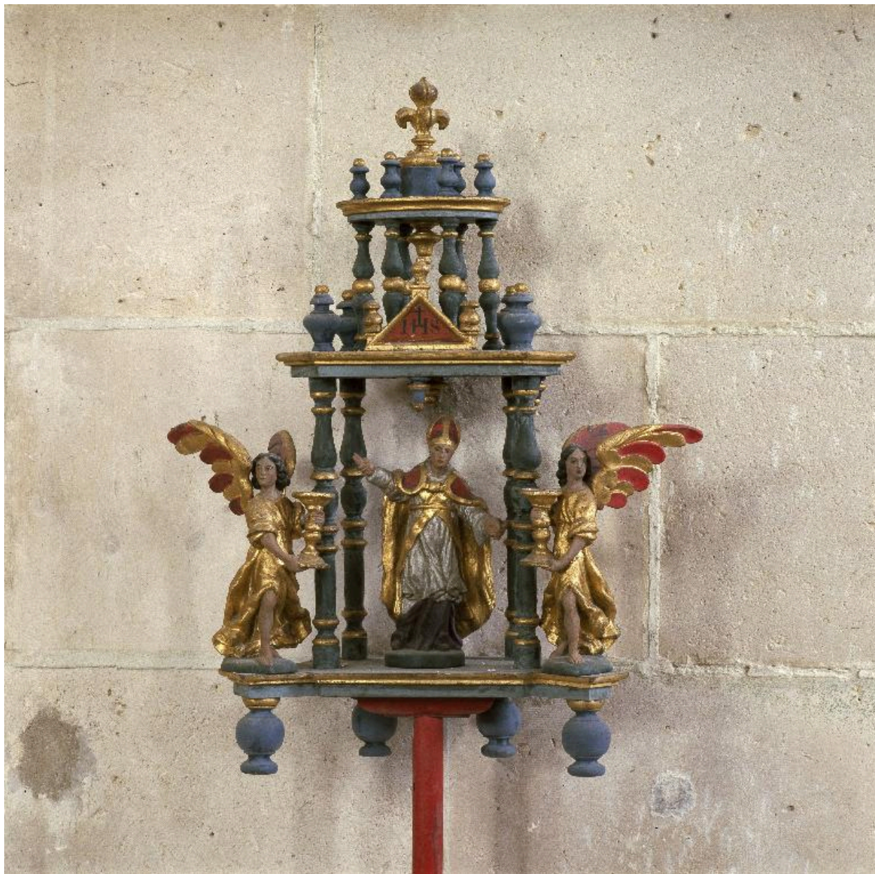
Vue de la partie supérieure du bâton de procession de saint Aubin, après restauration.