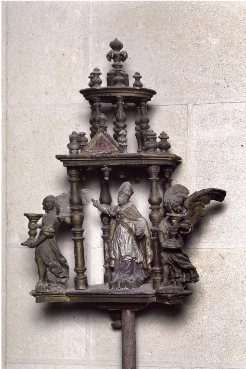
Vue de la partie supérieure du bâton de procession de saint Aubin, avant restauration.