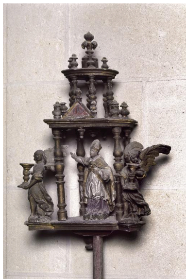
Vue de la partie supérieure du bâton de procession de saint Aubin, avant restauration.