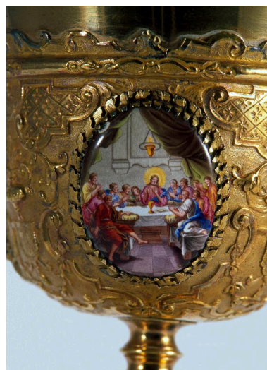
Vue de détail d'un médaillon sur la coupe : la Cène.