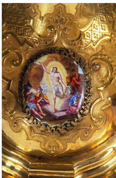
Vue de détail d'un médaillon sur le pied : la Résurrection. IVR22_19966001068ZA