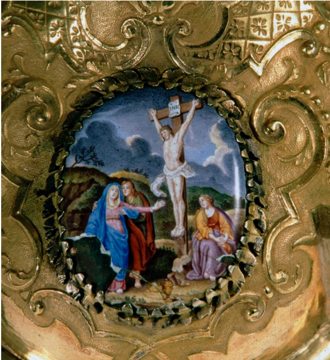
Vue de détail d'un médaillon sur le pied : la Crucifixion.