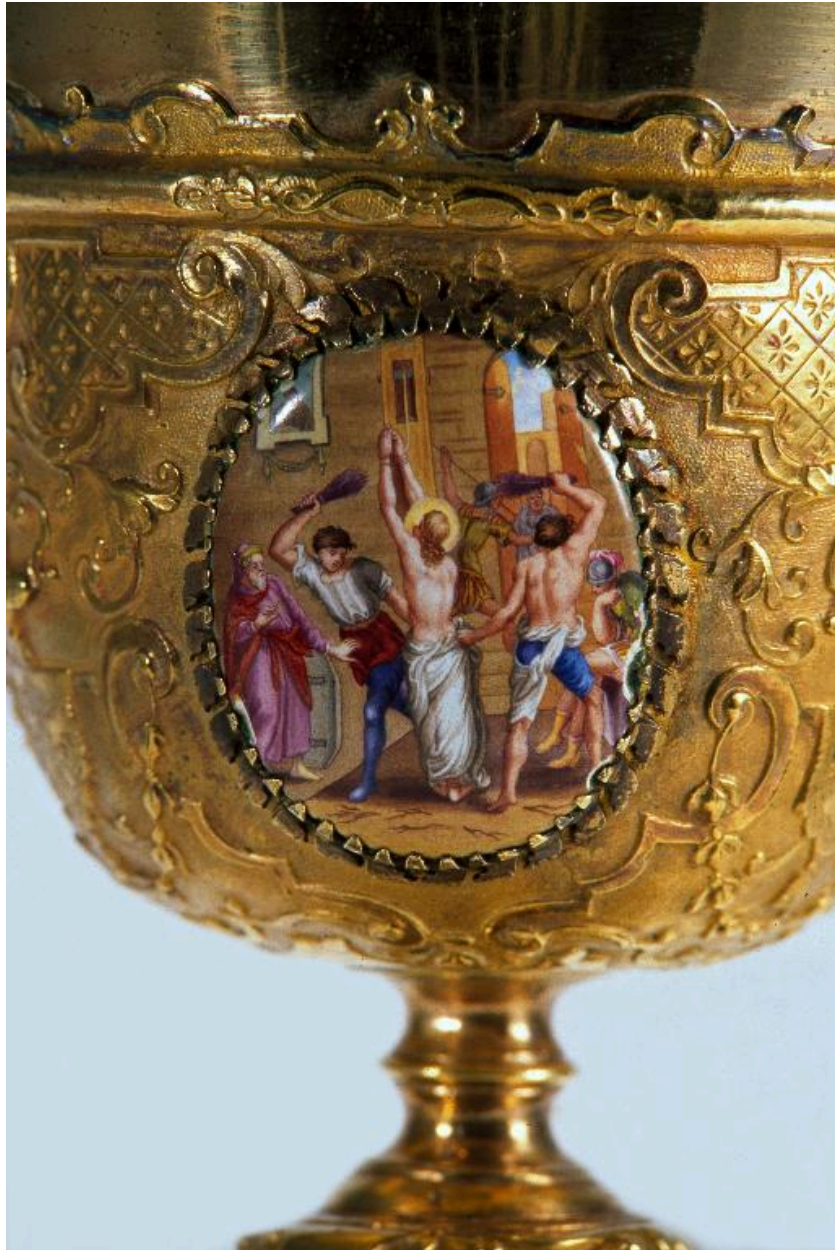
Vue de détail d'un médaillon sur la coupe : la Flagellation.