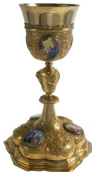
Vue d'ensemble. IVR22_19966001067ZA