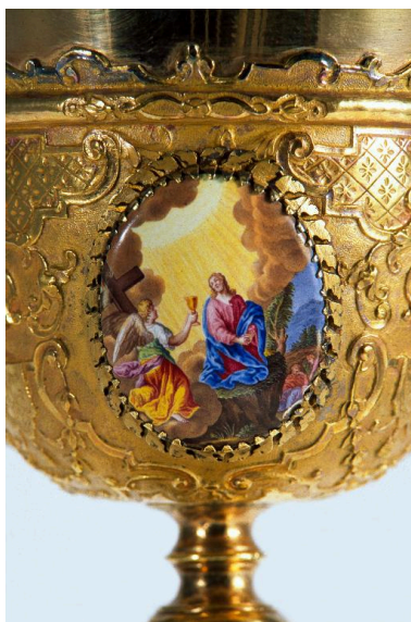
Vue de détail d'un médaillon sur la coupe : le Christ au Jardin des Oliviers. IVR22_19966001072ZA