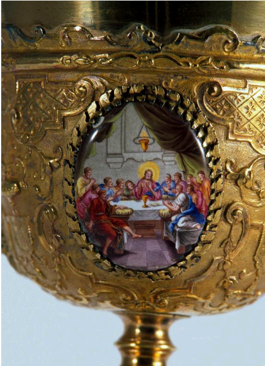
Vue de détail d'un médaillon sur la coupe : la Cène.