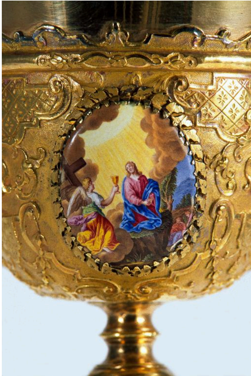
Vue de détail d'un médaillon sur la coupe : le Christ au Jardin des Oliviers.