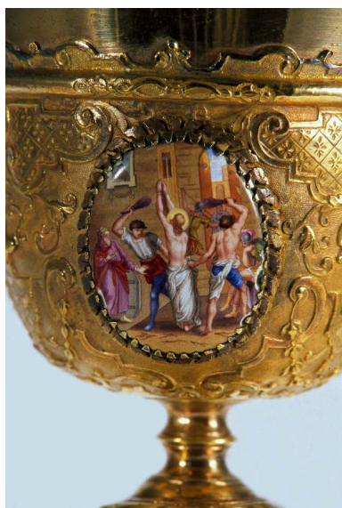
Vue de détail d'un médaillon sur la coupe : la Flagellation. IVR22_19966001071ZA