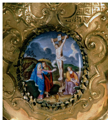
Vue de détail d'un médaillon sur le pied : la Crucifixion.