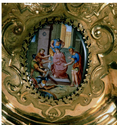
Vue de détail d'un médaillon sur le pied : la Dérision du Christ.