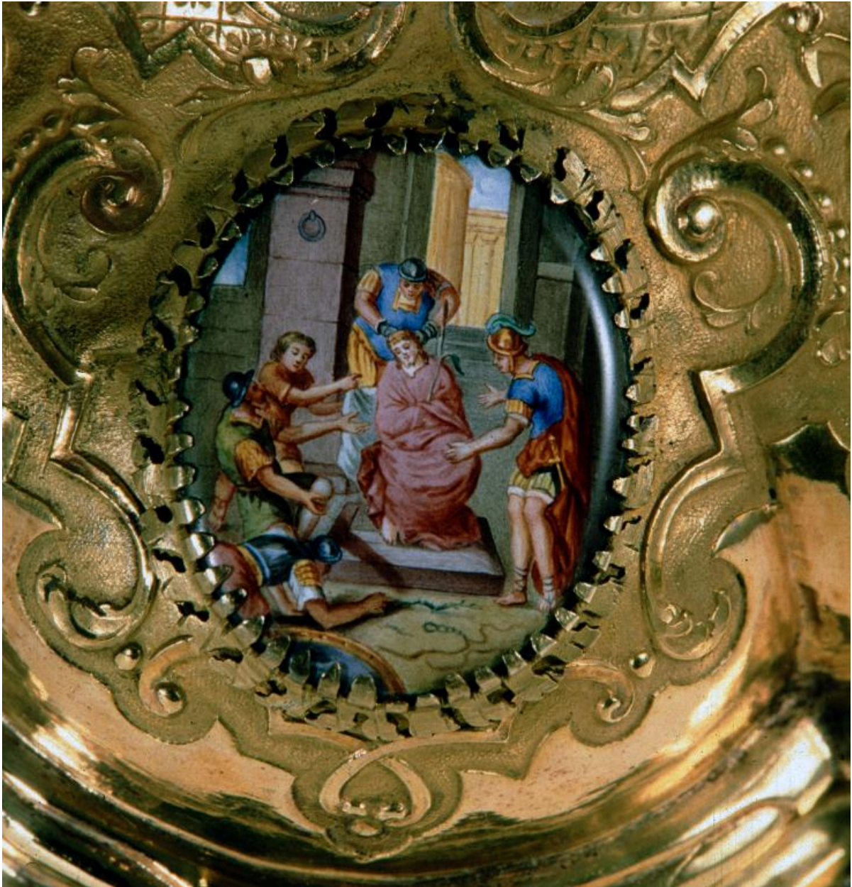
Vue de détail d'un médaillon sur le pied : la Dérision du Christ.