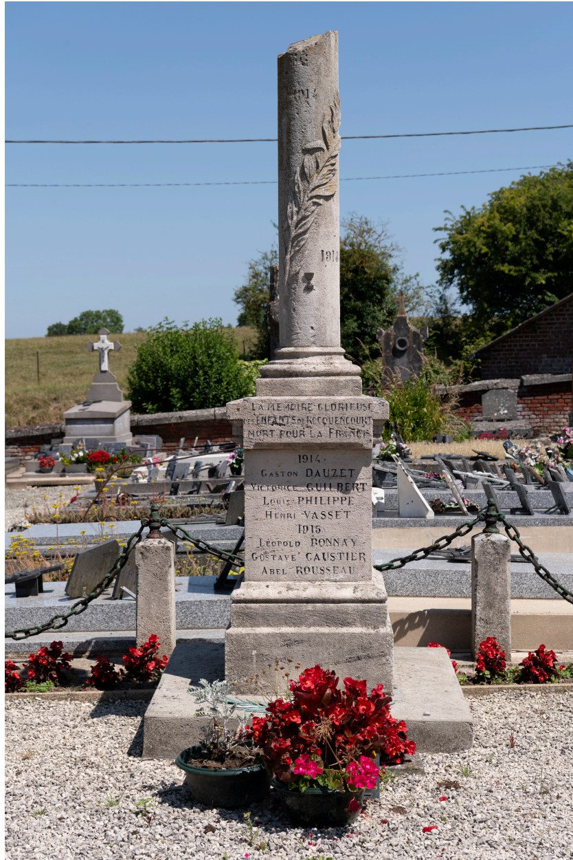
Monuments aux soldats morts pendant la Première Guerre mondiale, vue depuis le sud.