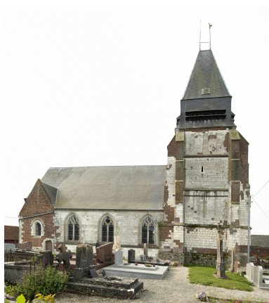
Vue générale de l'église et de son cimetière depuis le nord.