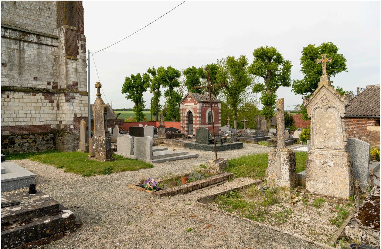
Vue générale du cimetière depuis le nord-est.