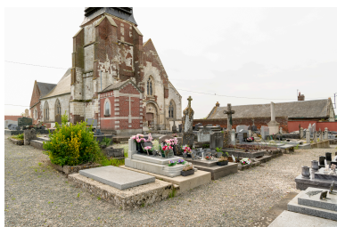
Vue générale du cimetière depuis le nord-ouest.