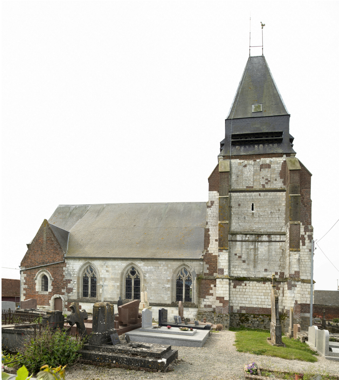
Vue générale de l'église et de son cimetière depuis le nord.