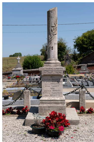
Monuments aux soldats morts pendant la Première Guerre mondiale, vue depuis le sud. IVR32_20256000366NUCA