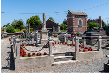
Vue générale du monument aux morts de la Première Guerre mondiale, vue depuis le sud.