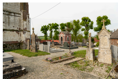
Vue générale du cimetière depuis le nord-est. IVR32_20266000098NUCA