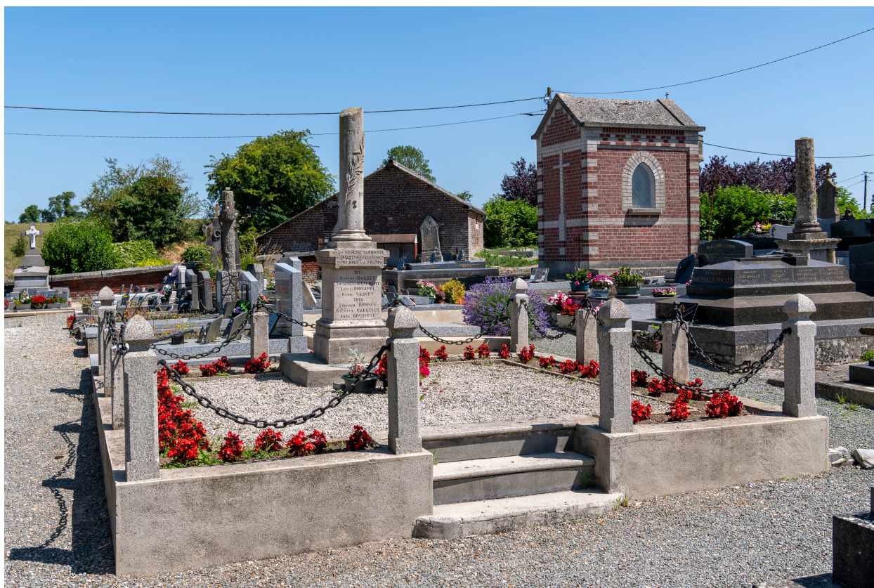
Vue générale du monument aux morts de la Première Guerre mondiale, vue depuis le sud.