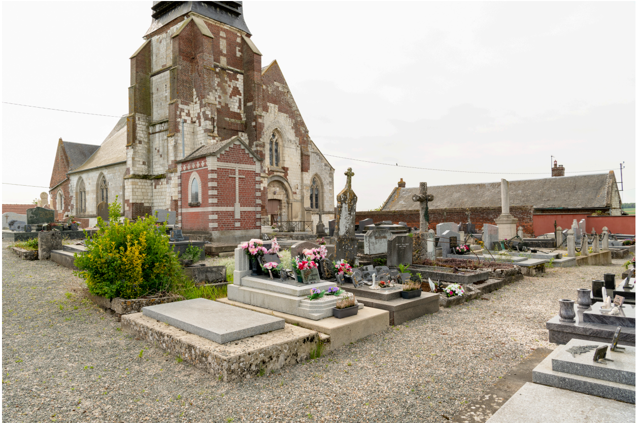
Vue générale du cimetière depuis le nord-ouest.