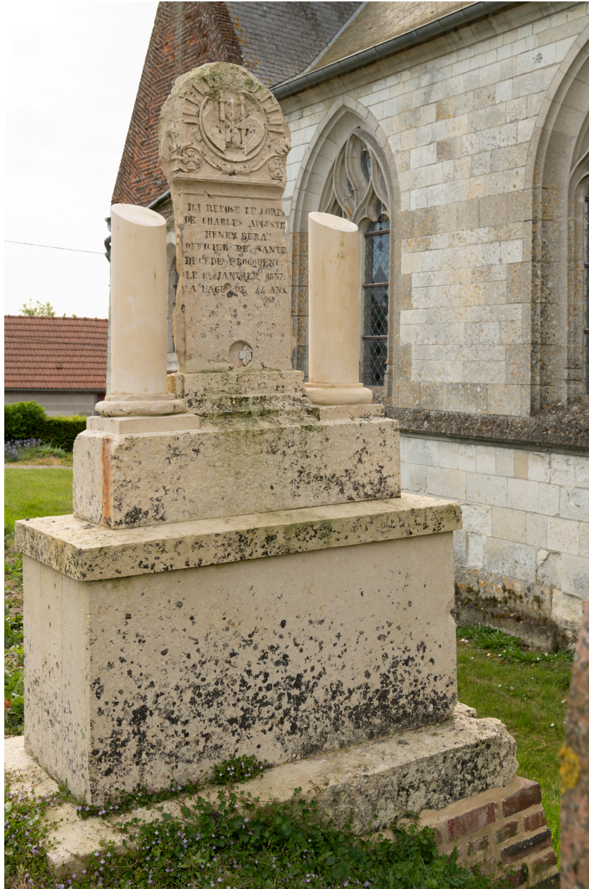
Stèle funéraire de Charles Auguste Bera, mort en 1837.