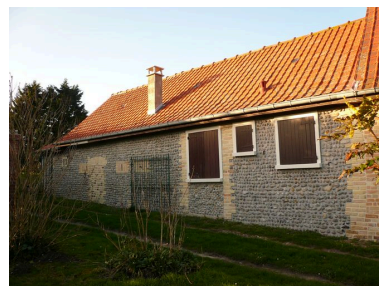
Vue détaillée de la partie écurie.