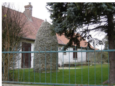
Vue détaillée du puits. IVR22_20058001438NUCA