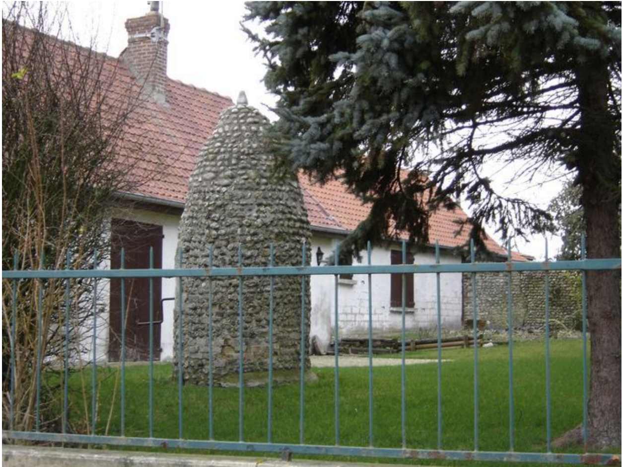
Vue détaillée du puits.