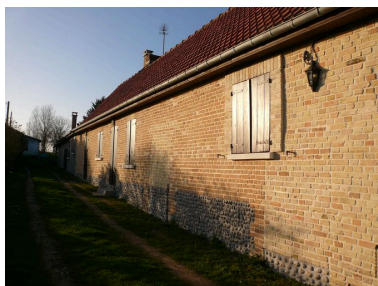
Vue détaillée de la partie habitable.