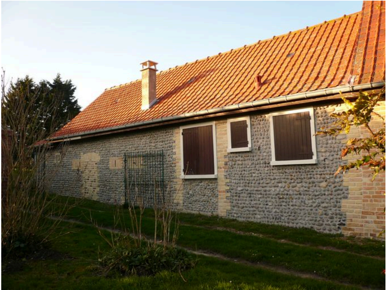
Vue détaillée de la partie écurie.