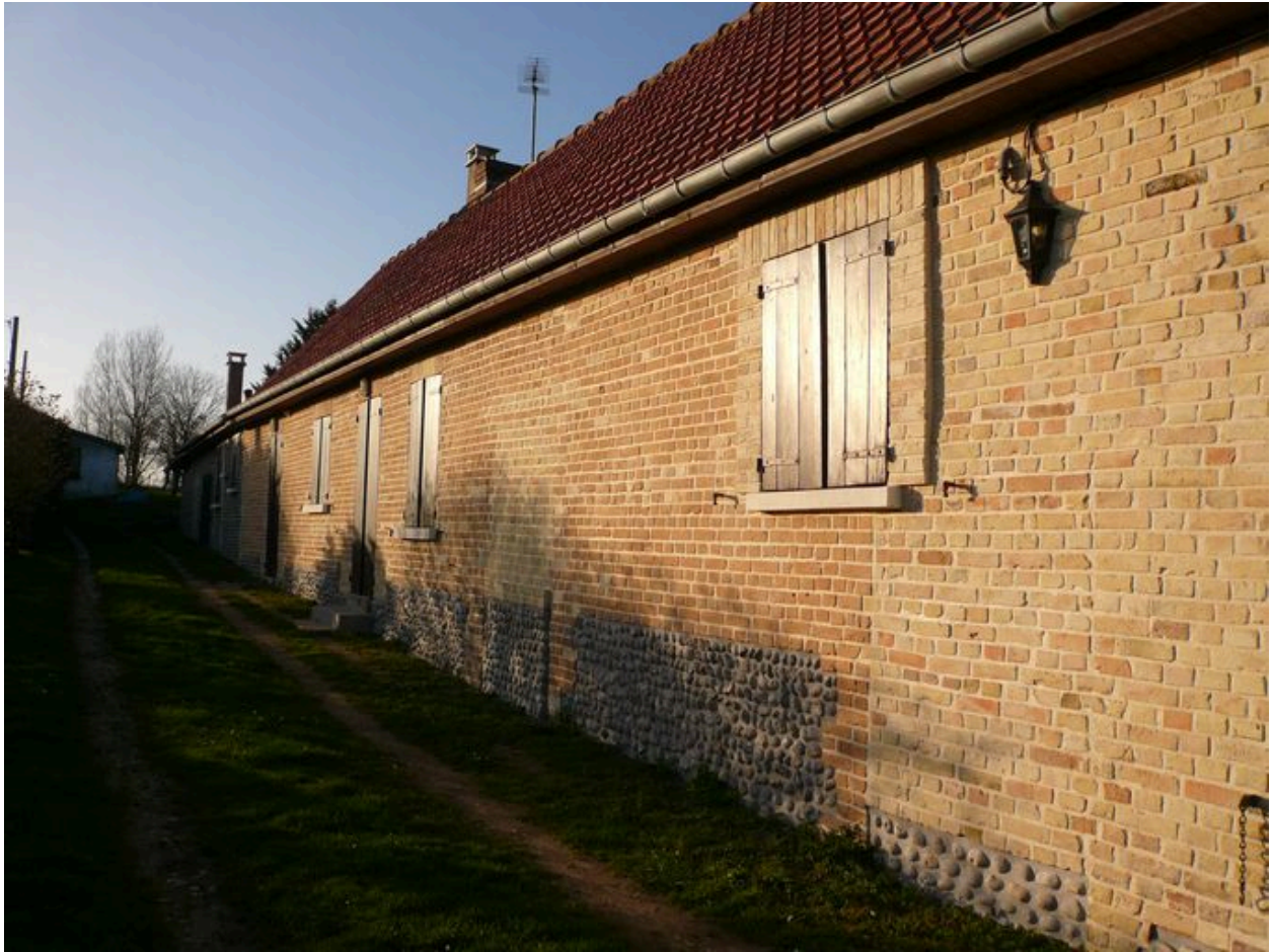
Vue détaillée de la partie habitable.