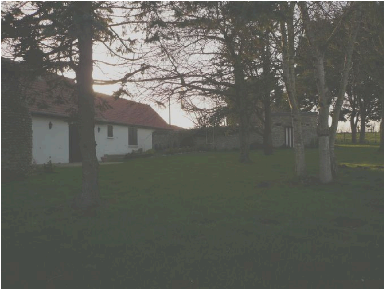
Vue des étables à cochons.