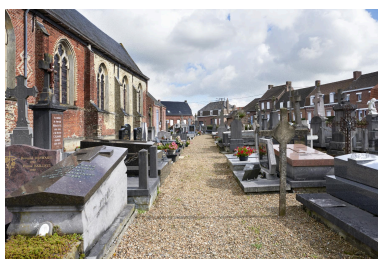
Allée située le long du bas-côté sud de l'église.