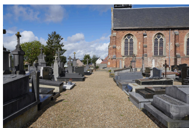
Vue de l'allée menant du sud du cimetière vers l'entrée de l'église. IVR32_20245903280NUCA