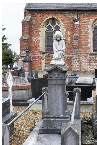
Tombeau d'enfant avec statue d'ange en pierre calcaire. 1913. IVR32_20255900414NUCA