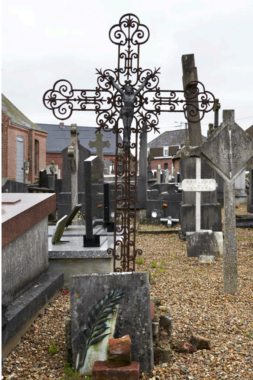
Croix en fer forgé. XXe siècle. Anonyme.