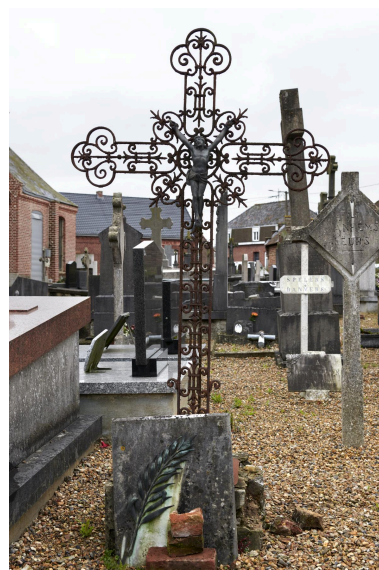
Croix en fer forgé. XXe siècle. Anonyme.