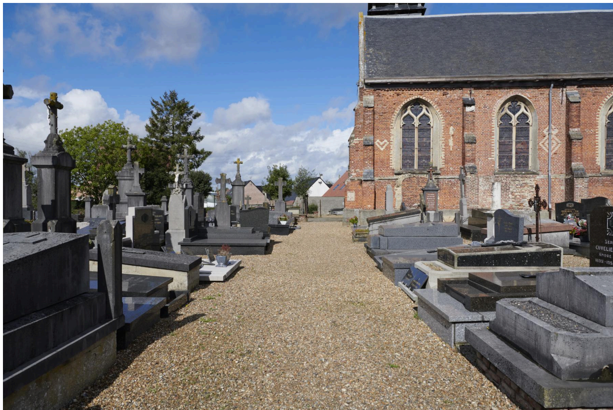
Vue de l'allée menant du sud du cimetière vers l'entrée de l'église.