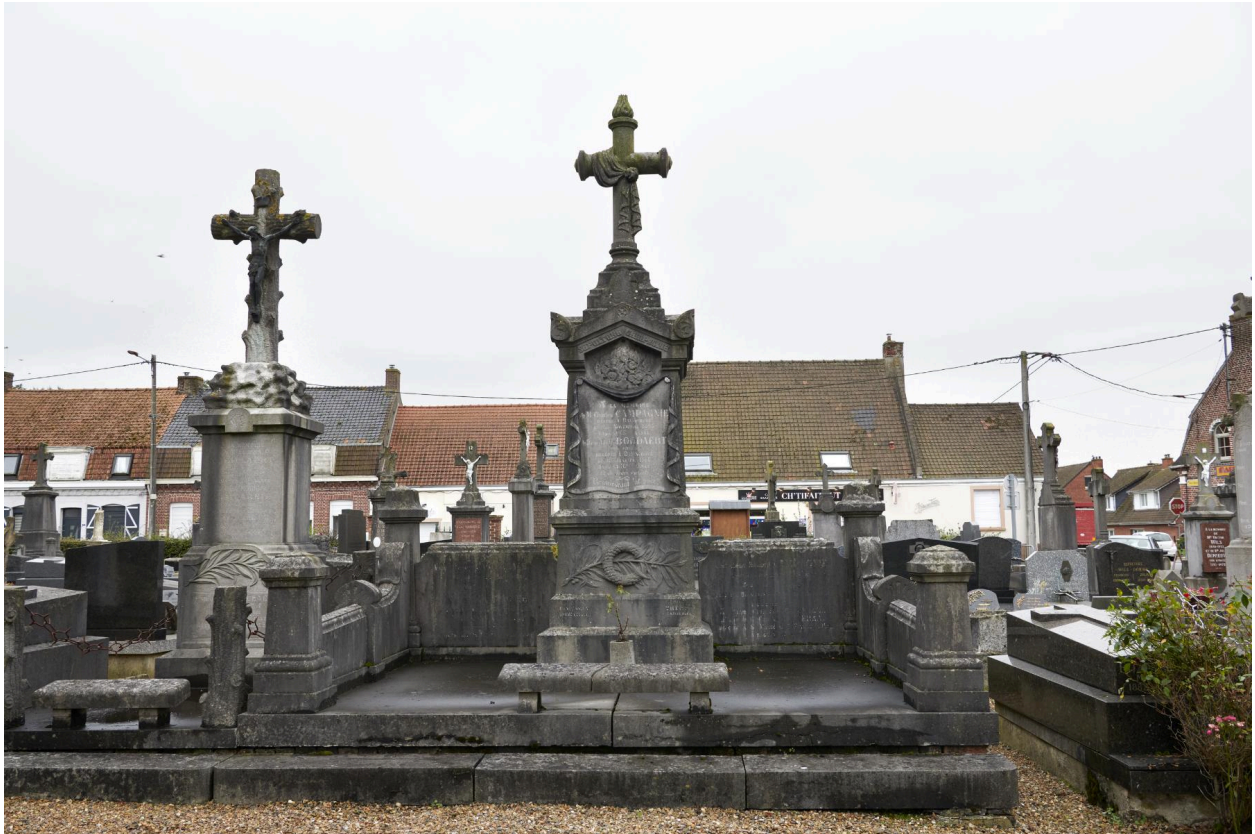
Grand tombeau familial CAMPAGNIE / BOODAERT. fin XIXe / début XXe siècle. Signé "THERY à HAZEBROUCK".