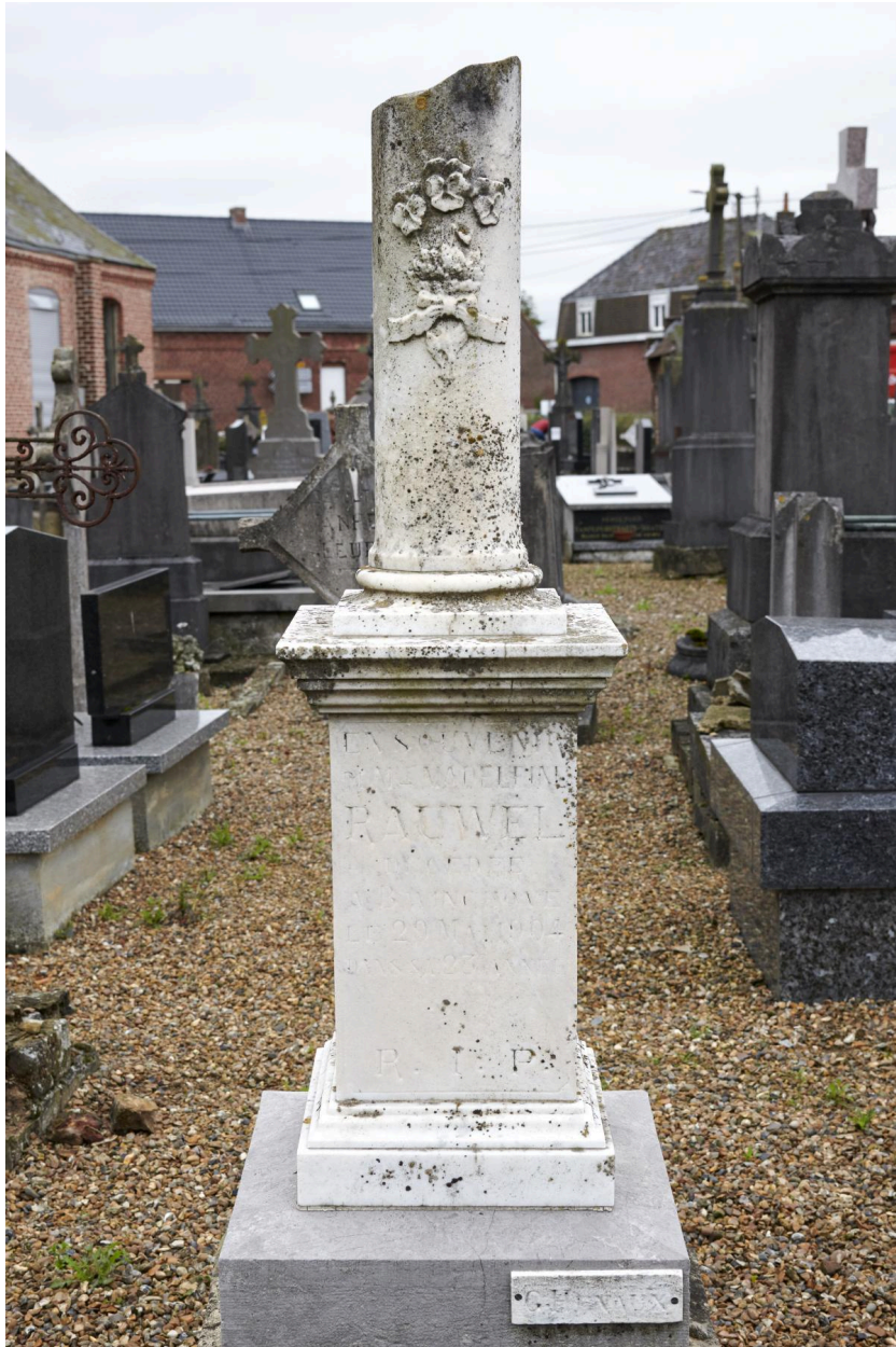
Piédestal et colonne funéraire en marbre blanc. RAUWEL. 1904.