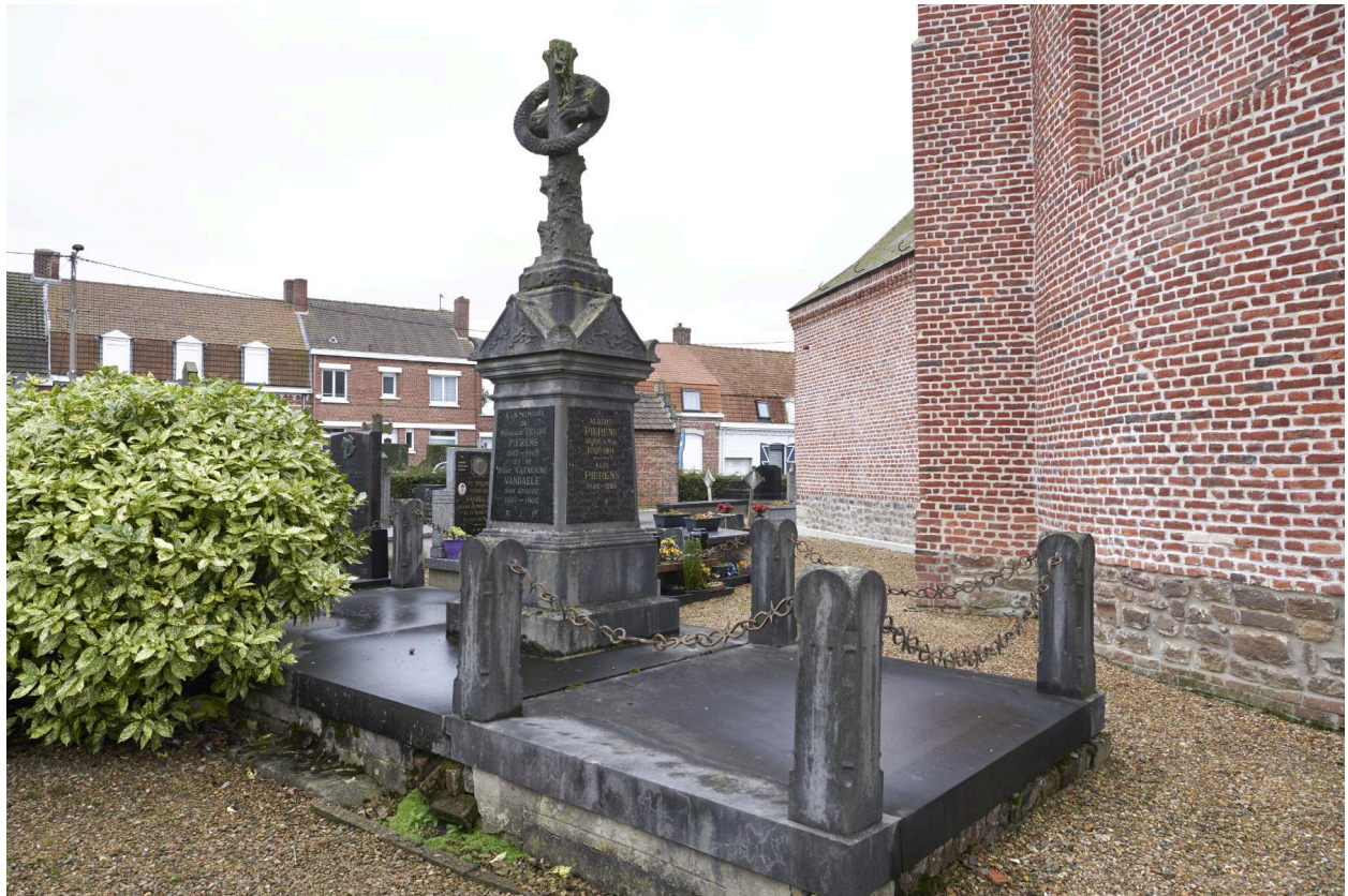
Tombeau PIERENS, VANDAELE, début XIXe siècle.