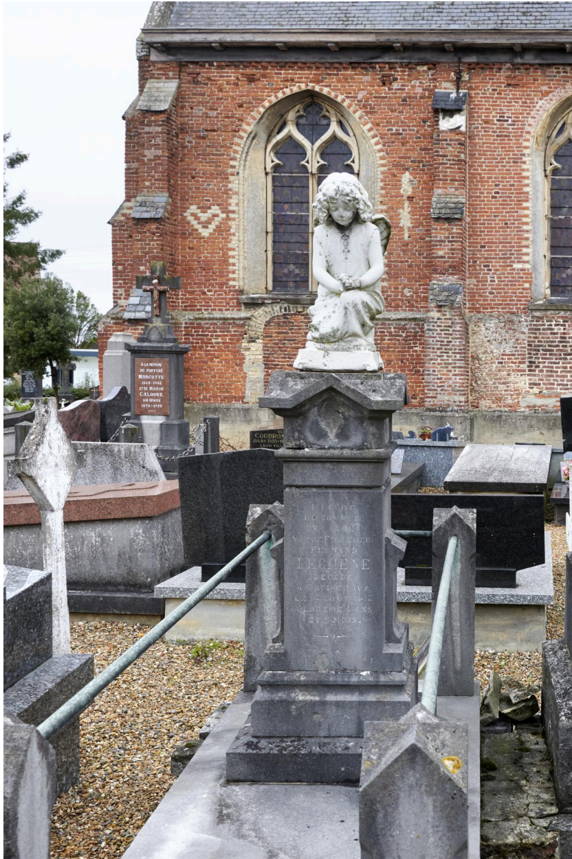
Tombeau d'enfant avec statue d'ange en pierre calcaire. 1913.