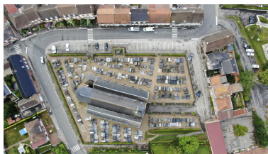
Vue aérienne du cimetière. IVR32_20255901385NUCA