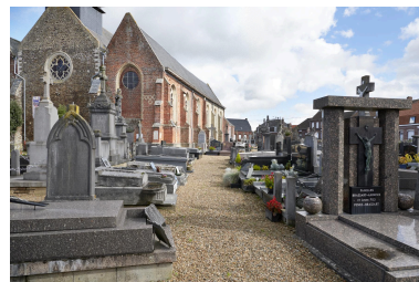
Allée sud du cimetière.