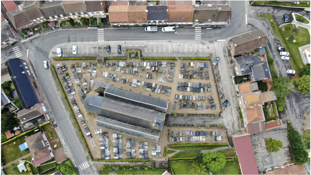
Vue aérienne du cimetière.