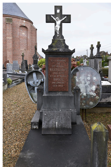
Tombeau BERTHELOOT, XX e siècle. Deux boîtes-vitrines funéraires.