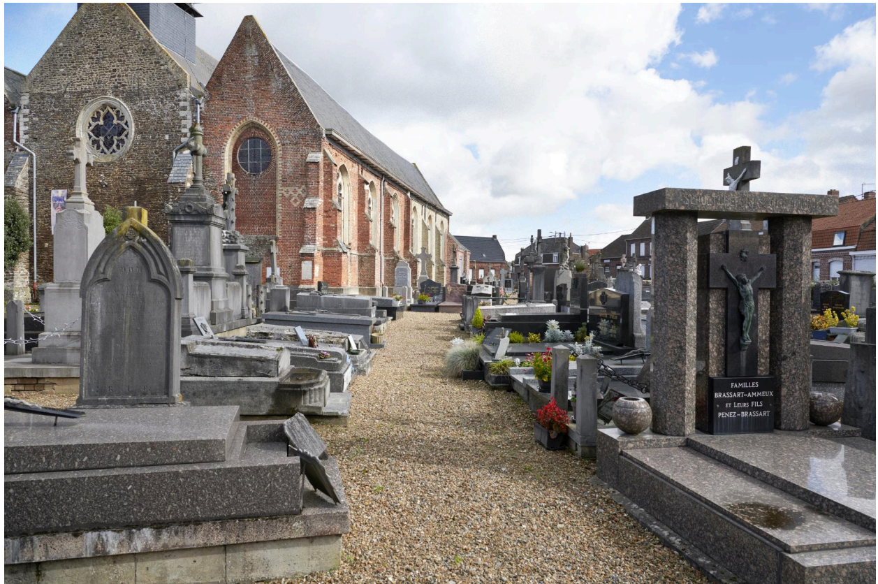
Allée sud du cimetière.