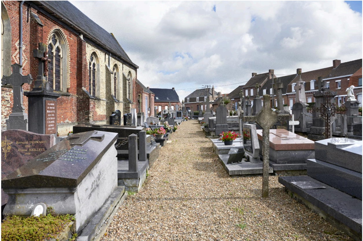
Allée située le long du bas-côté sud de l'église.