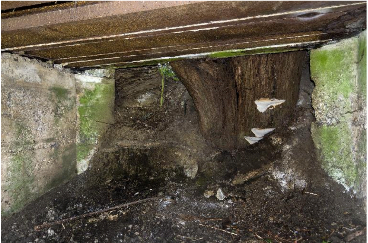
Sortie de la chambre de tir, vers le nord, depuis l'intérieur