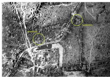
Position de l'édifice (cercle du haut) sur une photographie aérienne britannique du 12 sept. 1918 IVR32_20175901095NUCA