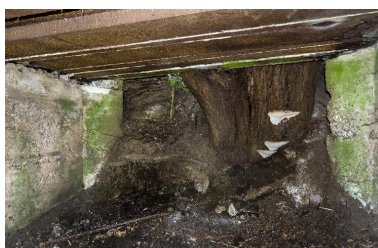
Sortie de la chambre de tir, vers le nord, depuis l'intérieur