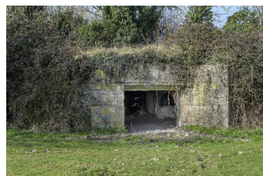
Elévation sud, entrée du canon IVR32_20165901000NUCA